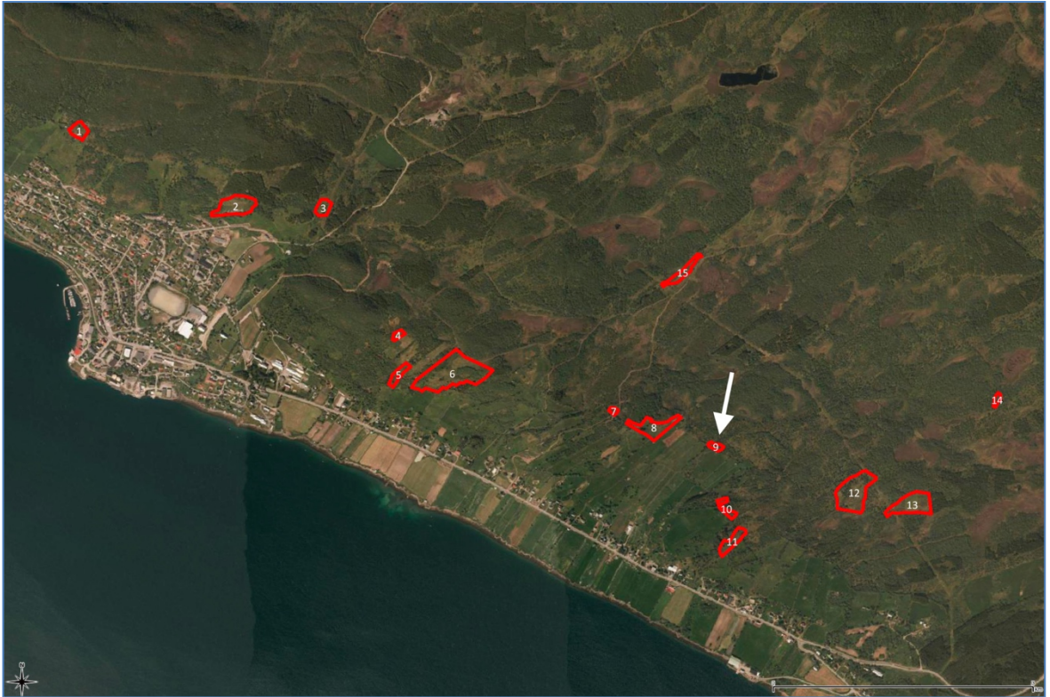
Flyfoto som viser hvor plasseringen av lokaliteten i UKL Skallan-Rå. Borkenes sentrum til venstre i utsnittet.