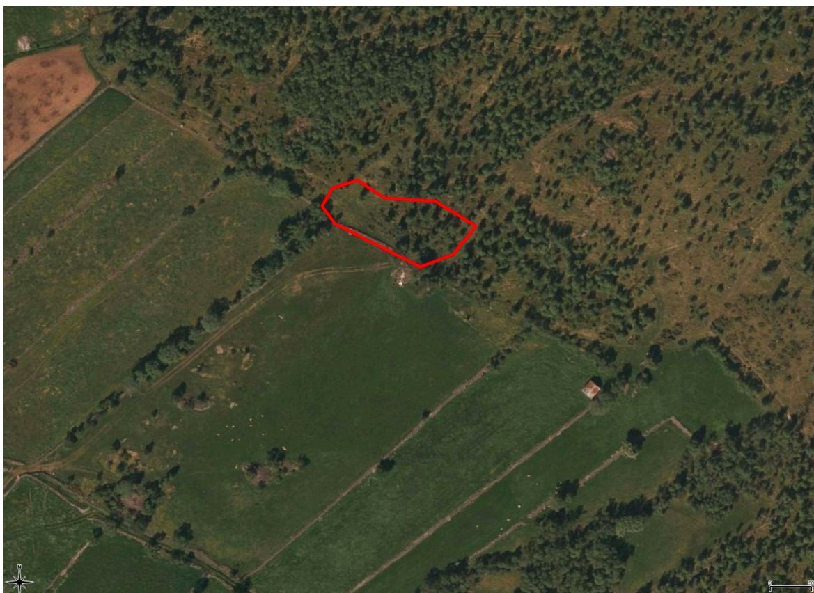
Ortofoto som viser lokalitetens beliggenhet. Kartgrunnlag: Kartverket (ortofoto) 2019.