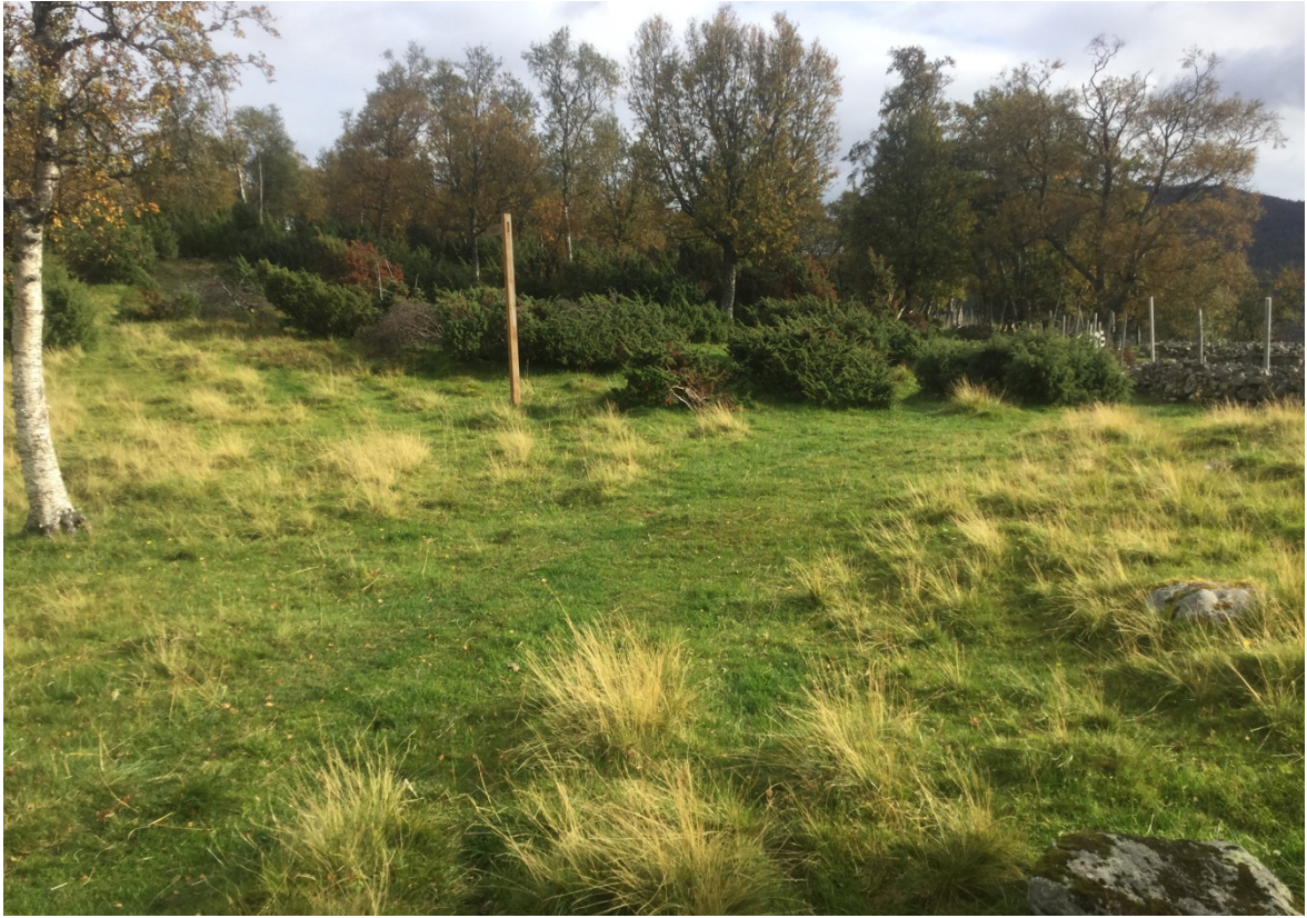
Lokaliteten sett fra vest mot øst. Den vestre delen av lokaliteten består av godt nedbeitet natureng, mens det i øst er nokså tett med einer og bjørk.