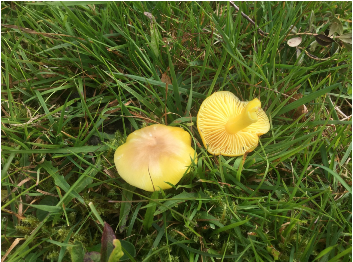
Gul vokssopp funnet på lokaliteten.