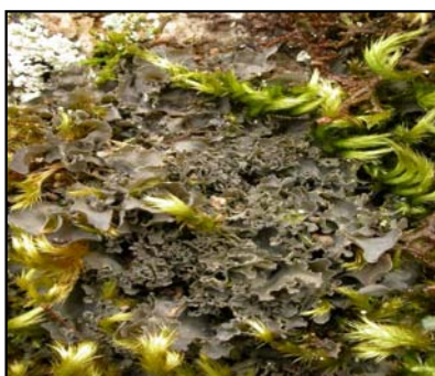
Prakthinnelav (grå), Krypsilkemose (grøngul), Matteblæremose (raud).