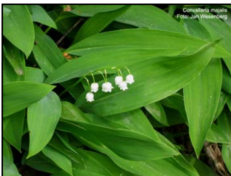
Liljekonvall trivst i sørvendte edellauv-skogar.

Føremålet med fredinga av Ørestø naturreservat er å ta vare på eit spesielt naturområde, der gradienten frå sjøen og opp til lågheia går gjennom edellauvskog, naturleg furuskog, bjørkeskog og vidare opp til skogsnaue, fuktige lyngheier. Området har stor naturrikdom i form av naturtypar, økosystem, artar og naturlege økologiske prosessar, og har stor verdi som vitskapeleg referanseområde. Den eigenarta edellauvskogen med lind, eik og ask og mange styvingstre har ein svært interessant lav- og moseflora. Området har eit rikt fugleliv, og er eit viktig hekkeområde for spurvefugl og hakkespettar.