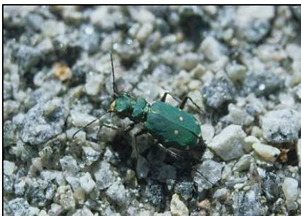
Grønn sandjeger.

Insektsfaunaen har fleire gode indikatorartar. Eit par av artane er her funne for første gong i Sør-Rogaland ( Nielsen 2000 ). Reservatet har stort biologisk potensiale, med mange nisjer for eit stort mangfald av insekter og andre invertebratar, og utgjer i så måte eit lokal ressursområde for forskning og undervisning.