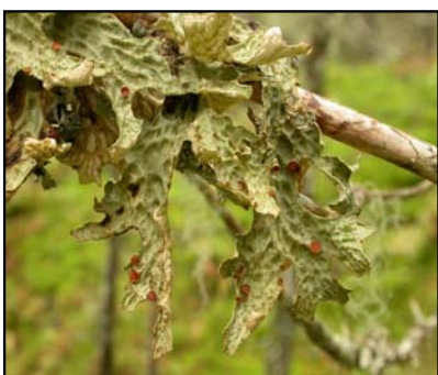
Lungenever ( Lobaria pulmonaria ).

I feltskiktet finn ein regionalt sjeldsynte artar som skogsvingel , kjempesvingel , myske , vanleg maigull , maurarve , slakkstorr og skognesle . Sjå bilete av artane på nettsidene http://www.nhm.uio.no/botanisk/nbf/plantefoto/index-alfnor.htm . Sjeldsynte hannelav-arter som Leptogium cochleatum ( Prakthinnelav ), irsk hannelav , kranshinnelav og bladmosen butt urnemose finn ein fleire stader i området. Lav-floraen er elles rik på forureinings-kjennslege artar, og nøkkelartar for biologisk interessante biotopar; så som Lungenever ( Lobaria pulmonaria ), filtlav ( Pannaria sp og Degelia sp. ) og porelav ( Sticta sp. ). Sjå bilete av desse artane på http://www.toyen.uio.no/botanisk/lavherb.htm .