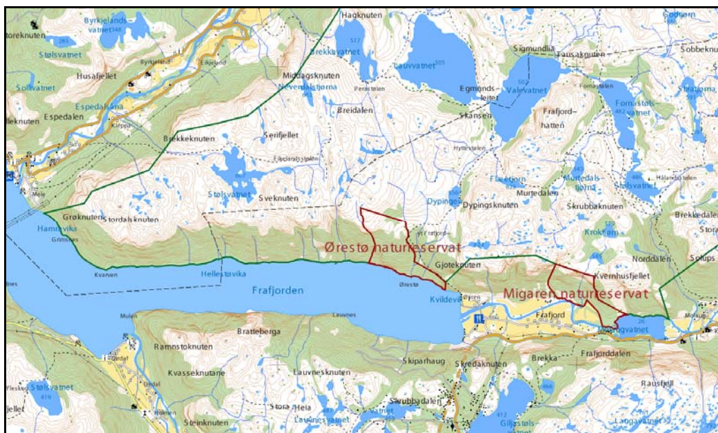
Kart over Migaren og Ørestø naturreservater med raud grense, Frafjordheiane landskapsvern med grøn.

Naturreservata ligg langs nordsida av fjorden (Ørestø) og dalbotn (Migaren) i Frafjord, Gjesdal kommune, sørvest i Frafjordheiane landskapsvernområde.