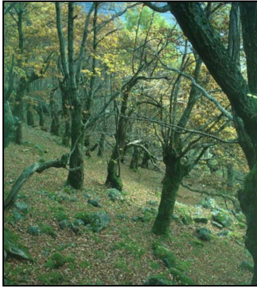
Styva eik i Ørestø, kulturminne og levestad for rik flora og fauna.

Begge naturreservata er i noko grad kulturpåverka gjennom mellom anna beiting og styvingstre. Det er lenge sidan det vart styva, og hogsten har vore svært avgrensa dei siste åra. Mange og til dels sjeldne artar er spesielt knytt til dei gamle styva trea i naturreservata. Hovudregelen er at jo eldre tre desto større mangfald. Konkret dokumentasjon i høve til enkeltartar skal liggja til grunn for skjøtsel. Til dømes er lavartane Leptogium hibernicum (Irsk hannelav) registrert i Migaren, medan arten Leptogium cochleatum (Prakthannelav) er funne i begge naturreservata. Begge desse artane er registrert som direkte truga i den nasjonale raudlista over truga artar. Dei fleste funna av desse artane er gjort på gamle styva asketre.