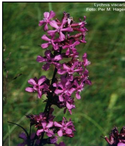
Engtjæreblom - ei vakker plante i Ørestø.

Det er først og fremst langsiktig ivaretaking av naturtypene og dei tilhøyrande artane som skal vurderast i høve skjøtsel , ikkje omsynet til visuelle verdiar/ kulturminneaspektet. Innanfor naturreservata er det registrert eit stort mangfald av virvellause dyr, sopp og mosar. Desse gruppene har store krav til livsmiljøet, i første rekke gamle tre, daud ved og fuktig trevirke. For desse artane vil all hogst, uttak av gamal og ny skog og anna rydding kunne vera negativt. Mangfald innanfor desse gruppene vil og skapa grunnlag for eit rikt fugleliv ( Nielsen, T. 2000 ). Dette tilseier at skogen som hovudregel bør få ei fri utvikling utan vesentleg menneskeleg påverknad. I dei spesielle tilfella som er beskrive nedanfor kan det likevel vera aktuelt å setja inn skjøtsel stiltak.