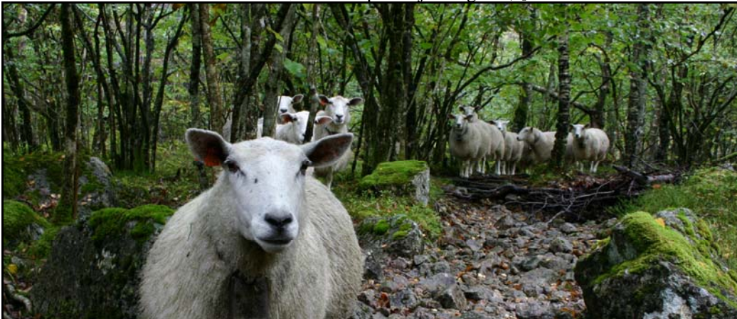
Saubeite set tydeleg preg på marksjiktet og "beiteskogen".

Beiting vil kunne halda fram slik det har vore praktisert dei seinare åra. Vesentleg endring av beitebruk og nye dyreslag som vil kunne ha uheldig innverknad på naturmiljøet, t.d. meir konsentrert/uheldig beitepress eller redusert naturleg forynging av treslag, er likevel ikkje tillate. Naudsynte tiltak/inngrep i samband med beitedrifta, som t.d. utbetring av skårfeste og oppsetting av gjerde er i utgangspunktet i strid med regelverket. Eventuelle tiltak i samband med beitedrift vil måtte vurderast i høve til dispensasjonsregelen, § 7 i forskriftene.