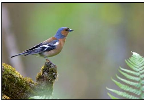
Bokfink – eit godt døme på den rike fuglefaunaen.