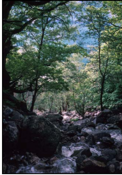
Bekkane gjennom reservata er livgivande.