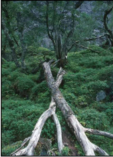
Daud ved – viktig for lav, mose og insekt.