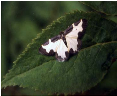
Svartrandmålar liknar svart og kvit fugleskit, og unngår dermed å bli eten av fuglar.