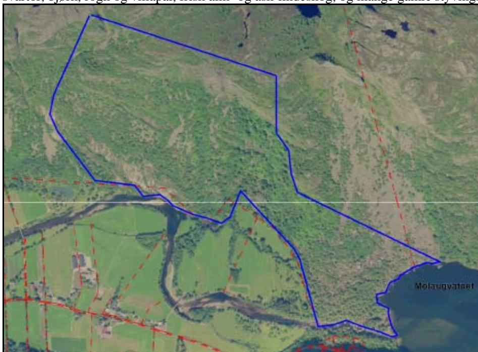
Migaren naturreservat med omtrentleg vernegrense i blått. Nord er øvst i bilde. Frå vatnet og til øvst i reservatet er det ca 575 m.

Vegetasjonssonane er sterkt prega av den dominerande og vekslande rasmarka, med større parti med ur. Den til dels storvaksne og grove edellauvskogen har artar som hegg, gråor, svartor, bjørk, rogn og villapal, frisk alm- og ask-lindeskog, og mange gamle styvingstre.