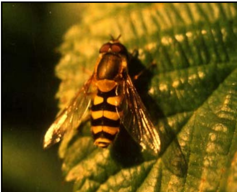
Blomsterflugene er viktige for plantepollinering. Larvane av mange artar èt bladlus og er såleis positive for plantelivet.