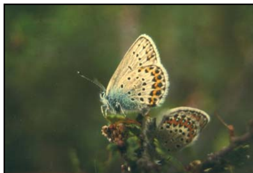
På varme sumardagar flyg blåvengene i opnare lende. Larvane lever på erteplanter.