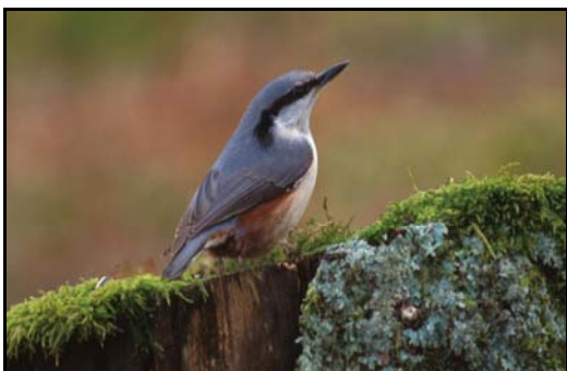
Spettmeisen – ein annan karakterart.

Utetter bergveggen finn ein rik oseanisk flora med regionalt sjeldsynte planteartar som engtjæreblom , liljekonvall , olavskjegg , lintorskemunn , prikkperikum og bitterbergknapp . Kystplante så som kusymre , bergflette (sørleg) og blodtopp er sjeldsynte i Frafjord – Espedalområde. Det same gjeld meir varmekjære planter som bergperikum , orkideen breiflangre (sjeldsynt), lundgrønaks og sanikel . I gråorskogen langs sjøen veks fine bestandar av slakkstorr . Reservatet er sørvendt, ligg ved sjøen og har mange bekkar. Som i Migaren-området skaper dette grunnlag for eit særst rikt mangfald av plantenedbrytarar, så som insekt, sopp, lav og mose og anna flora ( Nielsen 2000 , Johnsen 2000 ).