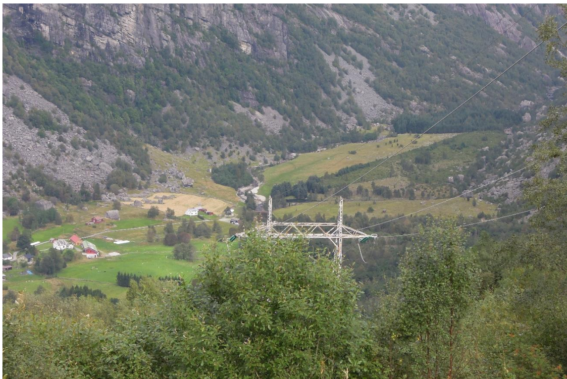
Utsikt fra Lyseveien mot Moen hvor Viltåkeren, Tyttebæråkeren, Kvednamoen og Elisabethmoen ligger.