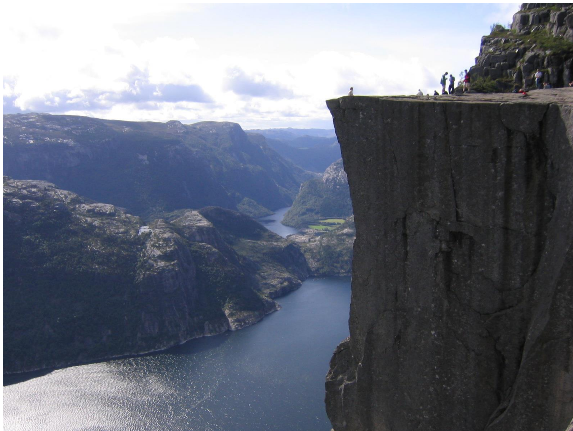
Utsikt fra Preikestolen-området mot Nedre Eiane og Eiavatnet.

Eiane ligger i et område som brukes både av turister og friluftsfolk. Eiane har ikke mye tilrettelegging for denne virksomheten, men sjokoladefabrikken med utsalg og kurs, flere T-merka stier samt parkeringsplassen på Skrøyla som er utgangspunktet for mange flotte turer er slike tilrettelegginger.