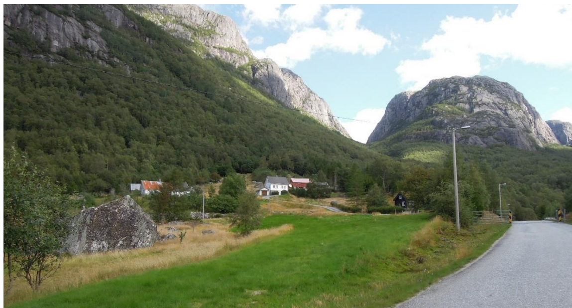
Innmarka fra veien og oppover mot Auklend er tydelig holdt i hevd med slått slik skjøtselsplanen anbefaler.

Eiendommen ble befart i september 2015 og det er tydelig at kulturlandskapet holdes i hevd. Områdene er ryddet slik skjøtselsplanen la opp til, og innmarka slås som avtalt 2-3 ganger hvert år. Steingardene kommer tydeligere fram som resultat av hogst av gjengroingstrær. Arealene beites ikke.