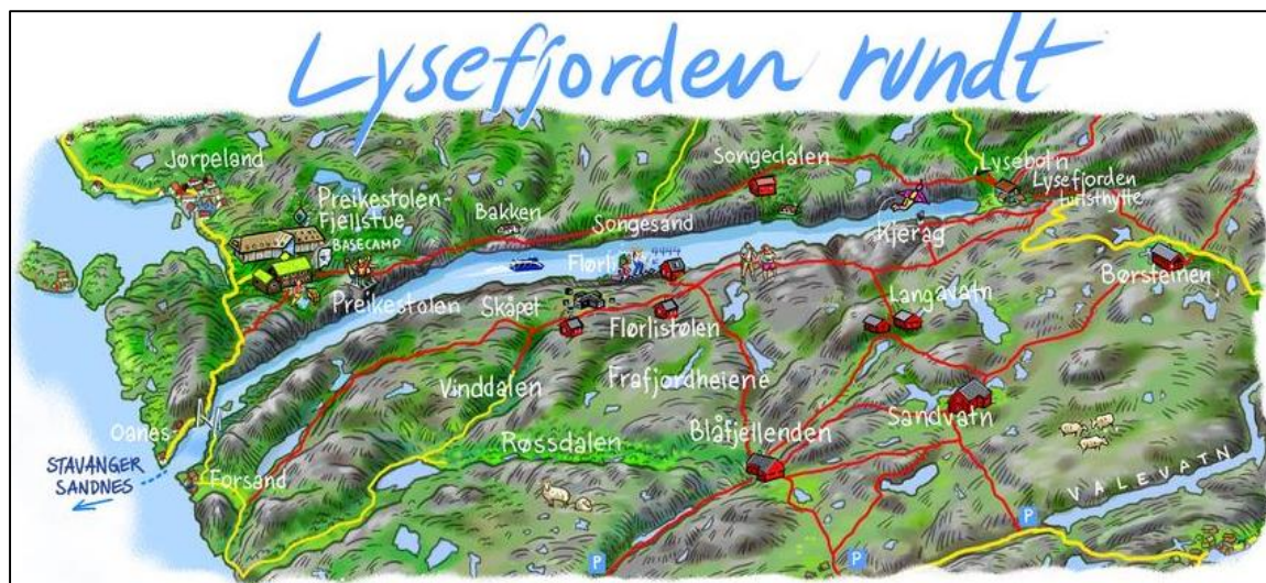
Figur 6.1. Stavanger Turistforenings satsing Lysefjorden rundt ( https://lysefjordhikes.dnt.no/ ).