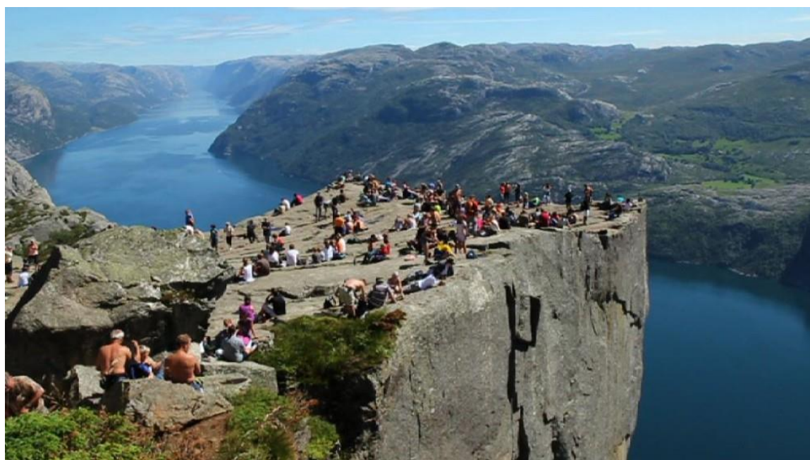
Utsikt fra Preikestolen innover Lysefjorden og over mot Fossmork på andre sida av fjorden.

Kulturlandskapet på Fossmork holdes i god hevd av grunneiere eller andre som har dette som levevei, enten alene eller i tillegg til annet. RMP-Lysefjordtilskuddet har hatt stor betydning for at arbeidet skal gå i null økonomisk. Det vurderes likevel ikke som avgjørende for om en fortsetter med sauer og skjøtsel her på kort sikt. Sauehold og storfehold er hobby eller del av aktivt arbeid og egeninteressen for å skjøtte og holde egen eiendom i hevd, åpen og fin er viktig drivkraft.