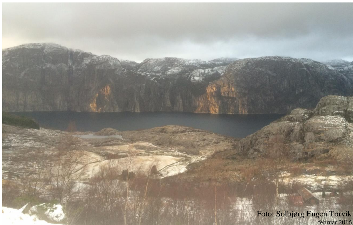
februar 2016

Utsikt over Myrane, fra brua ved Indre Fossmork. Her ser en litt mer av selve Lysefjorden.