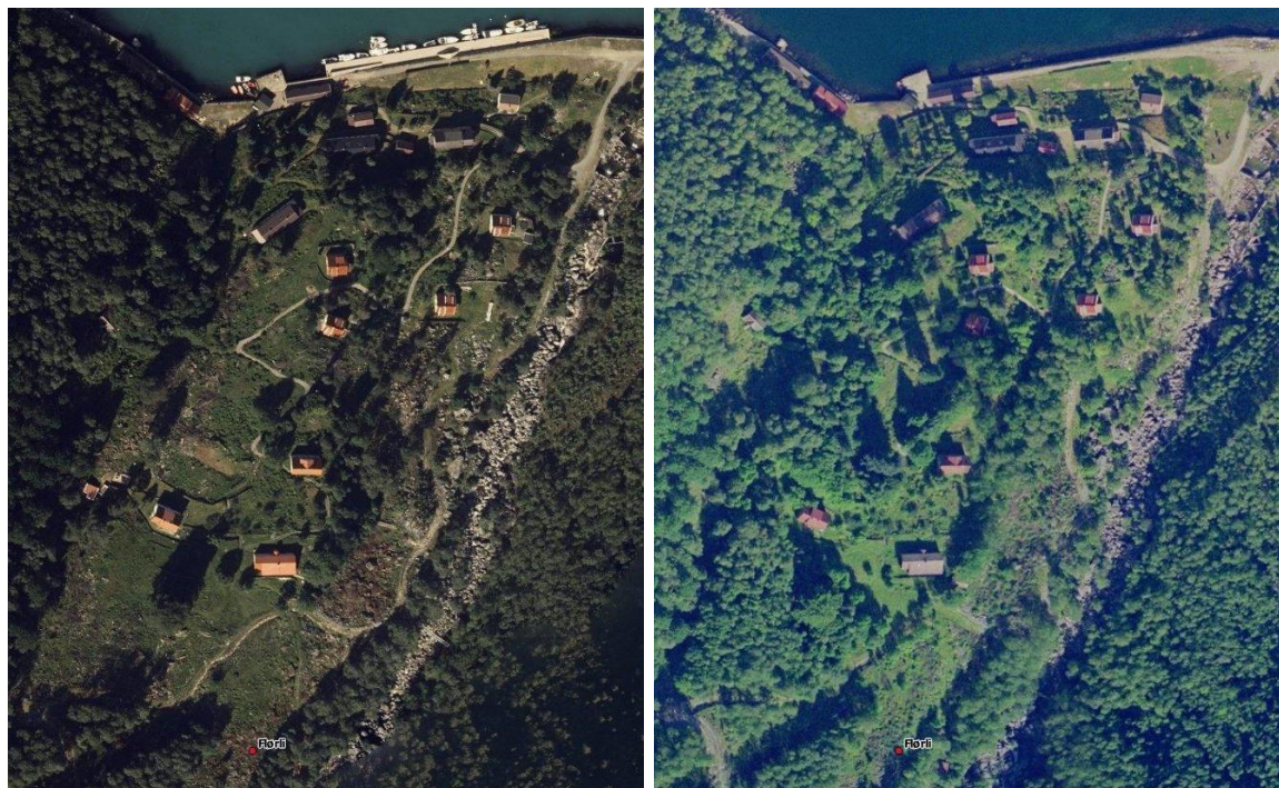
Flyfoto av Flørli fra 2013 (t.v.) og 2003 (t.h.).

Flørli ble ikke befart i 2015, men intervju med Kåre Nilsen og Roar Larsen samt flyfoto (Norge i bilder) ligger til grunn for vurderingene. Tilstanden på kulturlandskapet i Flørli er blitt mye mer åpent etter omfattende rydding de senere år. Etter å ha vært svært gjengrodd er mye skog ryddet og bygda er betydelig mer synlig fra fjorden med hus, hager, beitemarker og veier. Likevel gjenstår det trolig noe i forhold til skjøtelsesplanen, særlig nederst mot sjøen, i områdene 1, 2 og 3. Dette kan nok også skyldes ulik oppfatning blant hytteeiere av hvor og hvor mye som skal tas ned av trær og skog. Samtidig er det ryddet skog i områder som ligger utenfor de avgrensede områdene planen. De områdene som er ryddet sammenfaller godt med det som er avmerket som innmarksbeite i Kilden Arealinformasjon (NIBIO). I skjøtelsesplanen var skjøtelsesarealene ikke detaljert avgrenset på kart fordi grensene gir seg naturlig mot hage, vei, o.l.