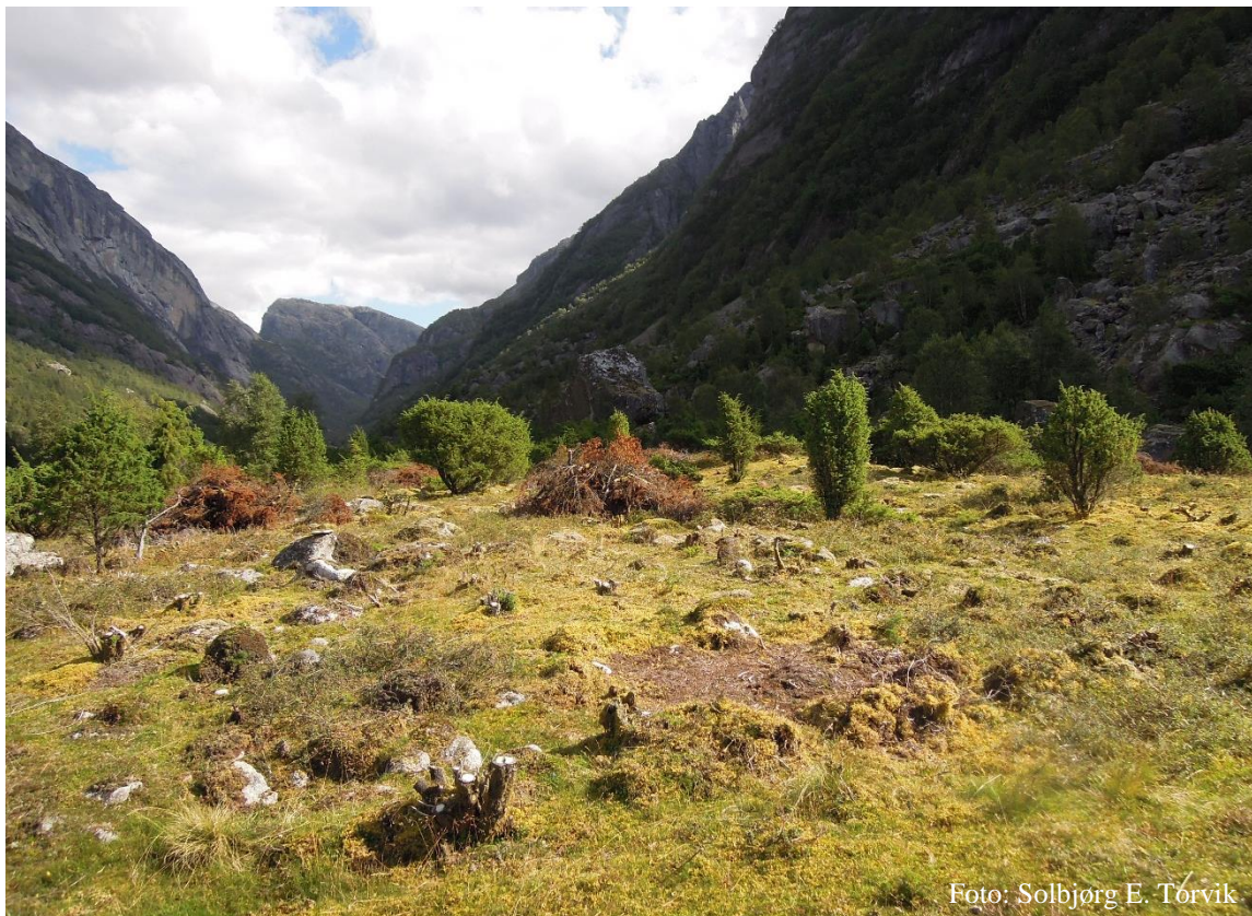
Elisabethmoen. Einer kuttes ned og kvistavfallet brennes.