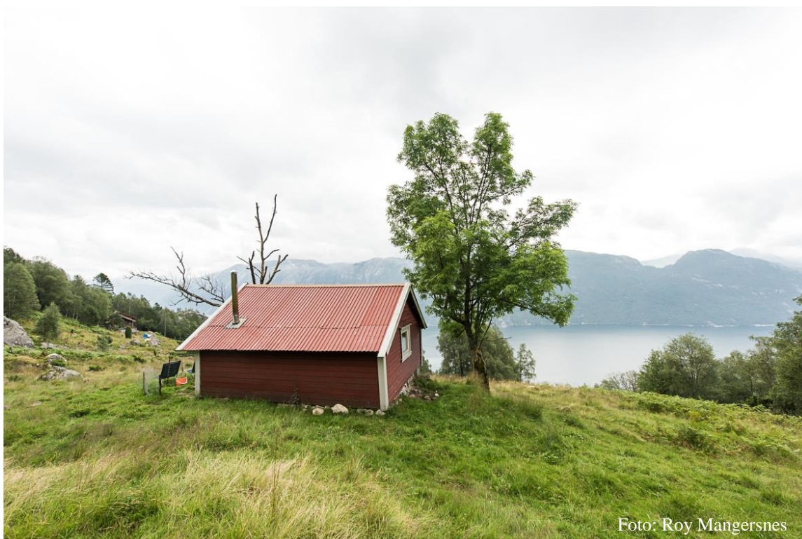
Øvre Bratteli med utsikt mot fjorden fra bak hovedhuset. Det ene tuntreet er nesten helt dødt.