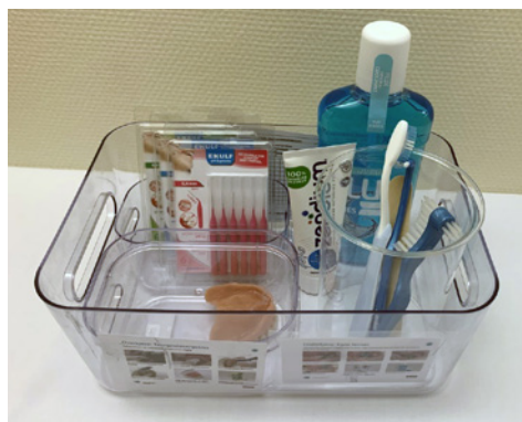
Prototyper på munnstellboks

Det ble opprettet egne tiltak i pleieplanene i dokumentasjonssystemet Gerica, hvor utførelse av munnstell hver dag (morgen og kveld) ble dokumentert som utført eller ikke utført. Det var også mulighet for å utdype hvorfor tann- og munnstell eventuelt ikke ble utført, eller man kunne dokumentere andre utfordringer ved munnstell for den aktuelle pasienten.