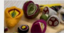
Filtning av liten ullskulptur