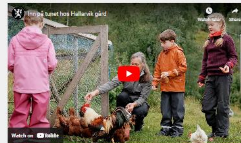
Inn på tunet hos Hallarvik gård, produsert av Dan Mariner og Cato Lauvli for Statsforvalteren i Nordland