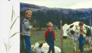
Gården som ramme for estetiske læringsprosesser