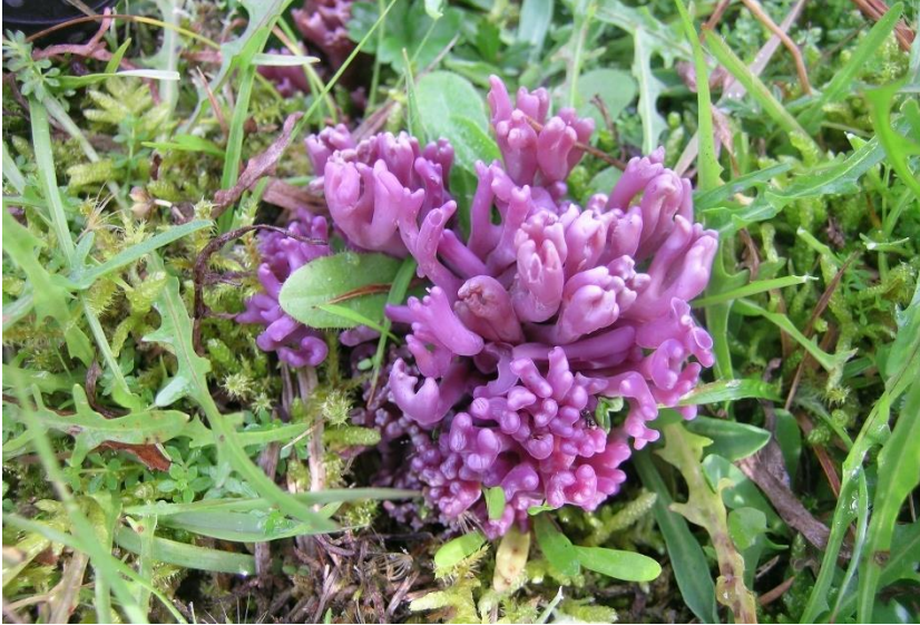
Fiolett greinkøllesopp Clavaria zollingeri (VU - sårbar på rødlista) funnet i Trøndelag: Oppdal: Vinstradalen.