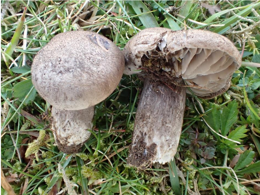
Grå narremusserong Porpoloma metapodium (EN - sterkt truet på rødlista) funnet i Hordaland: Bømlo: Vestre Vika.