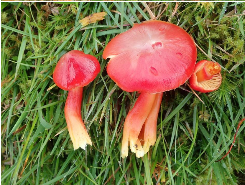
Rød honningvokssopp Hygrocybe splendidissima (VU - sårbar på rødlista) funnet i Hordaland: Lindås: Lygra.