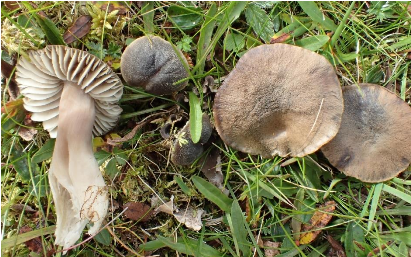
Lutvokssopp Hygrocybe nitrata (NT - nær truet på rødlista) funnet i Trøndelag: Oppdal: Vinstradalen.