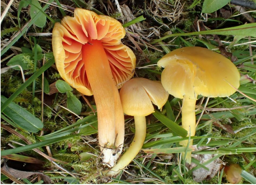
Rødskivevokssopp Hygrocybe quieta (NT - nær truet på rødlista) funnet i Trøndelag: Oppdal: Vinstradalen.