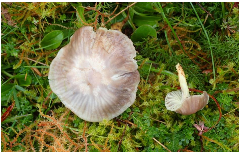
Gulfovokssopp Hygrocybe flavipes (NT - nær truet på rødlista) funnet i Hordaland: Lindås: Lygra.