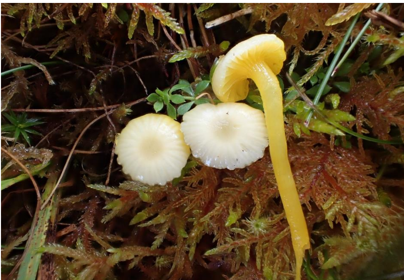
Gul slimvokssopp Hygrocybe vitellina (VU - sårbar på rødlista) funnet i Hordaland: Bømlo: Vestre Vika.