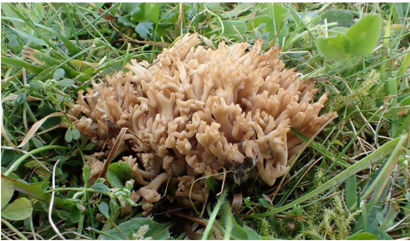
Grå småfingersopp Clavulinopsis umbrinella (NT - nær truet på rødlista) funnet i Hordaland: Bømlo: Vestre Vika.