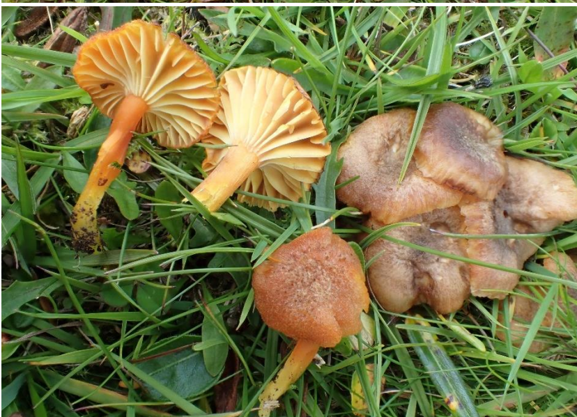
Mørkskjellet vokssopp Hygrocybe turunda (NT - nær truet på rødlista) funnet i Trøndelag: Oppdal: Vinstradalen.