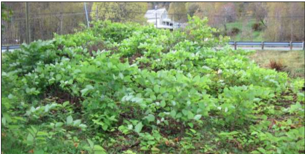
Figur 7 Parkslirekne i sterk spreining

Tjørnvågosen er i ferd med å gro igjen. I tillegg til framande planteartar, så veks det opp stadeigne lauvtreartar som bjørk, selje og rogn. Gjengroing er ein generell trussel i dei fleste lågareliggande verneområde. Det bør hoggast lauvskog, og vidare oppvekst av stubbeskott må hindrast ved beiting eller stubbebehandling.