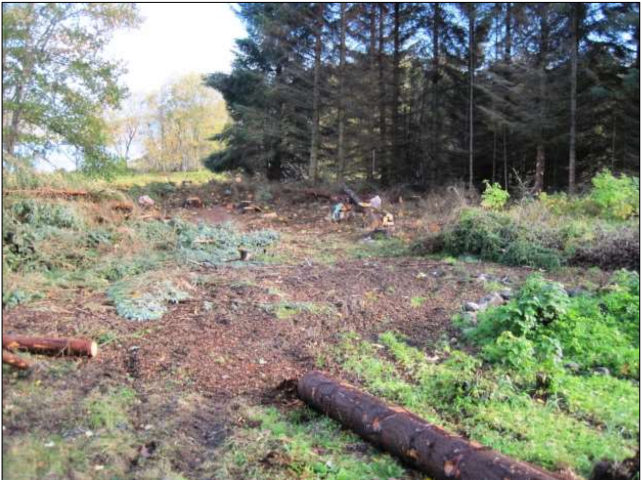
Figur 8 Det er starta hogst av utanlandske treslag - det er viktig å hindre nyetablering

Forvaltingsplanen for Tjørnvågosen naturreservat gjeld fram til ny forvaltingsplan er vedtatt. Fylkesmannen er ansvarleg for revideringa av planen. Ein tek sikte på å gjere dette ca. kvart 10. år, første gong ca. 2020. Fylkesmannen kan revidere planen på eit tidligare tidspunkt om det er nødvendig. Bevaringsmåla vil bli reviderte i samsvar med nasjonale standardar når desse føreligg, uavhengig av rulleringa av forvaltingsplanen.