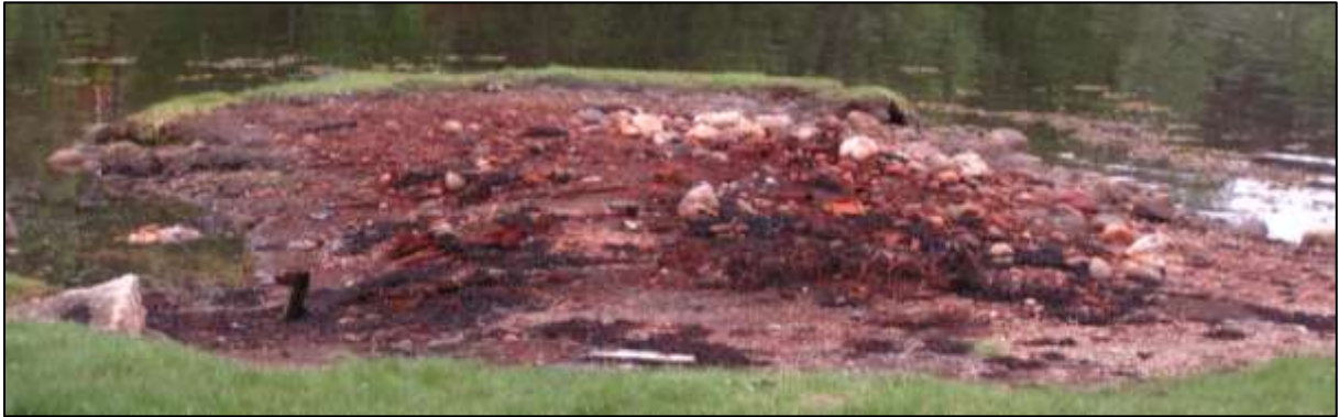
Figur 5 Den gamle bålplassen

Tjørvgåosen vender mot nord-nordvest, og er såleis utsett for søppel som driv i land frå havet. Det er gode dugnadsordningar for å samle søppel.