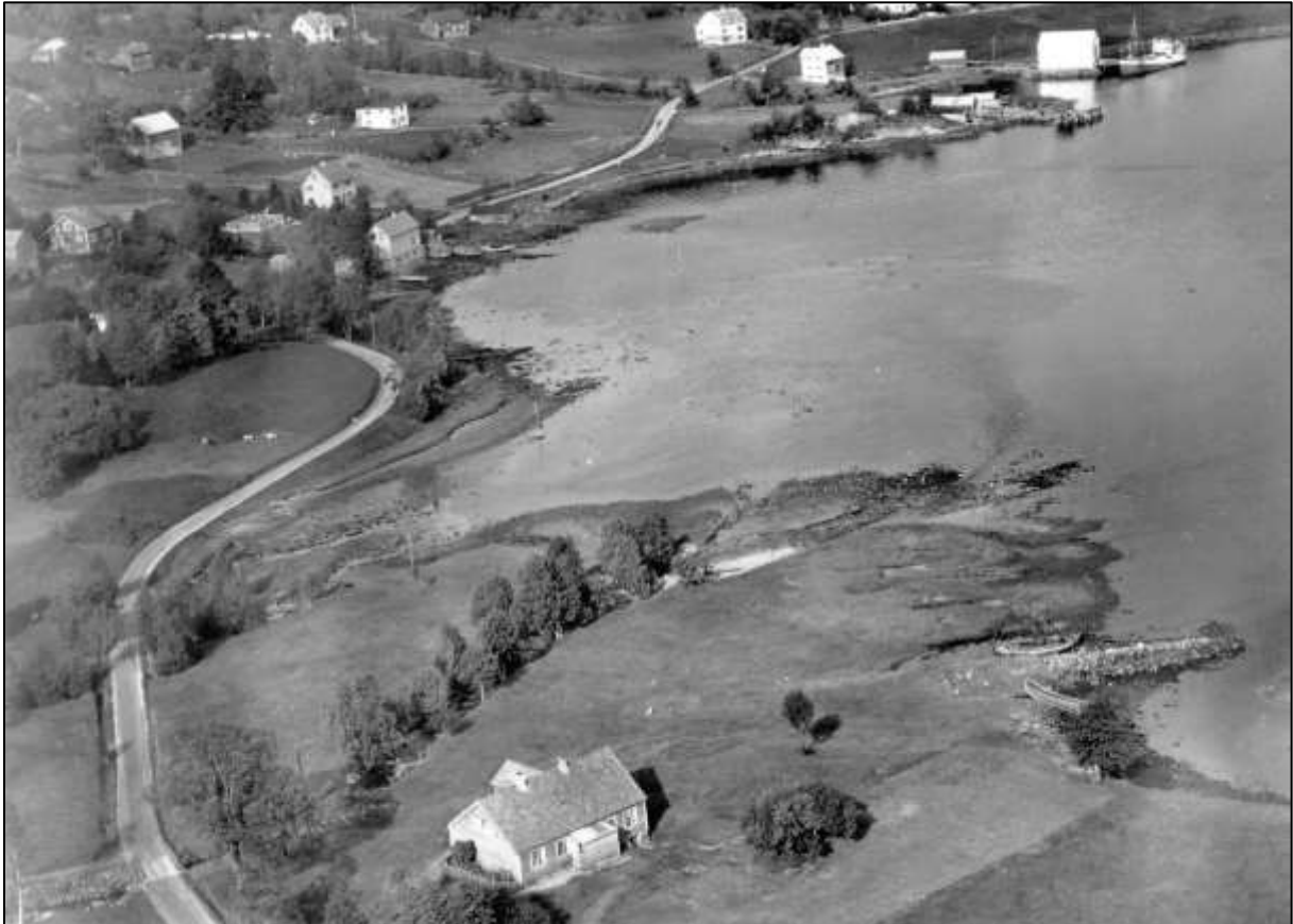
Figur 2 Tjørnvågosen med Tonningarden på 1950-talet