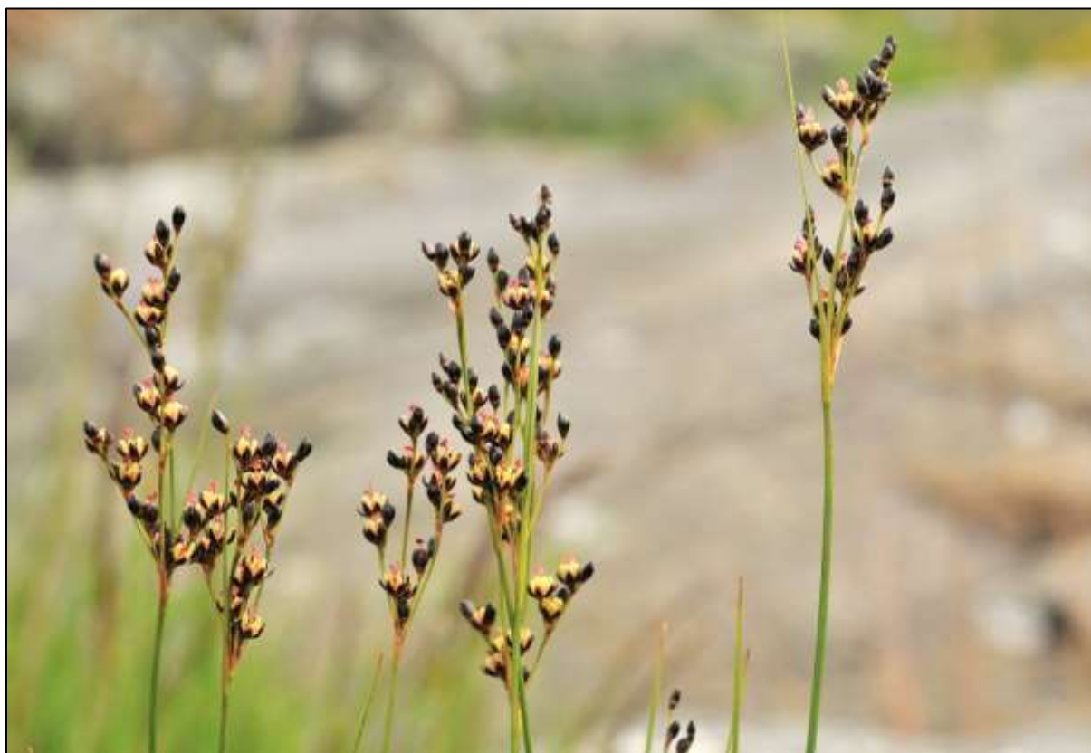
Figur 3 Saltsiv er ein karakterart i reservatet

Vegetasjonstypene er saltsiv-eng, raudsvingel-tiriltunge-fjørekoll-eng, strandkryp-forstrand, fjøresivaks-eng, rustsivaks-eng, fjørestorr-eng, kveke-voll. Her er strandskog med gamal gråor (urskogliknande sumpskog) i vestenden av lokaliteten. Mest strandvegetasjon ligg på grusøyra i indre del av elveutløpet. Elles finst det her småhavgras (U2a, kjelde: A. O. Folkestad).