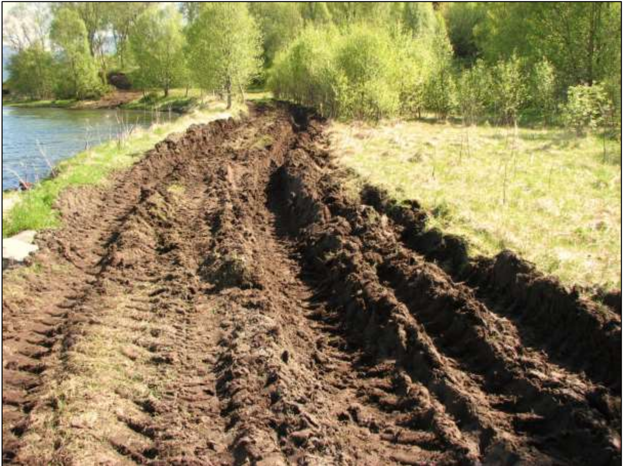
Figur 6 Terrengskader etter køyring med byggematerialar til naust

Erfaring frå transporten av byggematerialar er at dette skapte store transportskader i reservatet, med tilhøyrande skade på vegetasjonen. Det er ikkje ønskjeleg med slik køyring i framtida, og evt. transportbehov må løysast på anna vis.