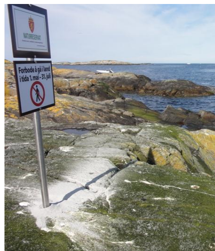
Figur 4: Merking av Grip naturreservat.

Med ein stadig veksande privat småbåtflåte på kysten og i fjordane, er det viktig å informere sjøfarande om vernet og om ferdselsforbodet i hekketida. Vi ser det også som eit mål å informere om fuglelivet og naturkvalitetane i sjøfuglreservata. Fylkesmannen vil utarbeide informasjonsplakatar om naturreservatet med m.a. kart, foto og vernereglar til å hengje opp på plassar der båtfolk ferdast, t.d. småbåthamna.