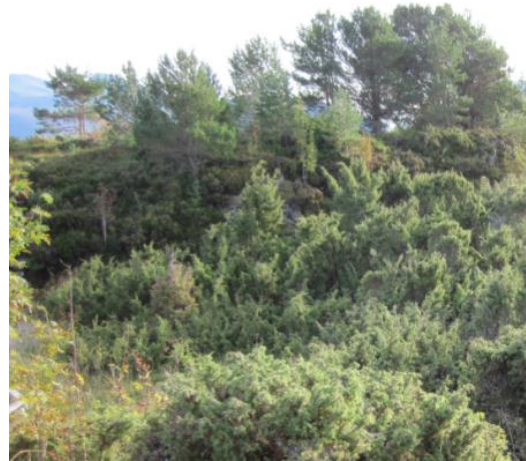
Figur 3: Gjengroinga har kome langt på Løholmen.

Tre, buskar og kratt må fjernast før dei blir så høge og av eit slikt omfang at det gjer området mindre eigna som hekkeplass for sjøfugl. Vegetasjonen bør haldast så låg at han ikkje tek den frie utsikta for fuglar som ligg på reir, gir færre reirplassar eller kan fungere som sitjeplassar/skjul for eggrøvarar som kråke og ramn. Det skal likevel stå att noko kratt av krypeiner nærast sjøen, sidan slikt kratt gir attraktive hekkeplassar for t.d. ærfugl.