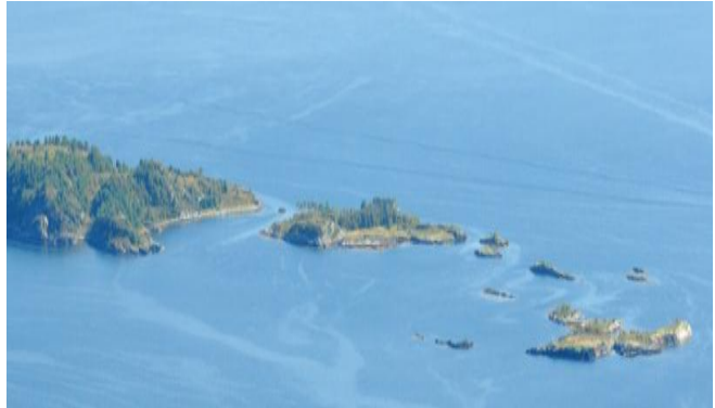
Figur 2: Flyfoto av Tautra vest naturreservat i Midsund kommune.

Tautra er ein viktig hekkelokalitet for sjøfuglane i ytre delar av Romsdalsfjorden. Her har det vore gode hekkebestandar av måsefuglar over lang tid. I 1975 blei det registrert over 200 par hekkande fiskemåsar her. Talet var redusert til 100 par i 1994, med ein vidare nedgang til rundt 11 par i 2011. Andre artar som har hekka eller framleis hekkar her er ærfugl, svartbak, sildemåse, gråmåse, ternar og tjuvjo.