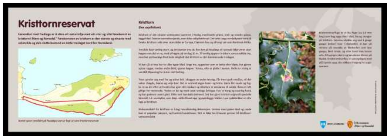
Figur 20 Informasjonstavle over kristtornreservatet, står ved tunet på Instøya.

Raudøya naturreservat er merka på strategiske grensepunkt med Miljøverndepartementet sine offisielle verneskilt. Det manglar ekstra merking for bandtvang for hund heile året. Informasjon om kva fugleartar som held til og besøkje reservatet gjennom året bør setjast opp for å auke interessa for verneområdet. Slik informasjon kan setjast opp i gapahuken.