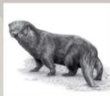
Tegning: Arne Kjørstevn

Av pattedyr er sjansen størst for å treffe på otter. Otteren lagar tydelege stiar som kan sjåast mange stader på øya. Det streifar også innom ein og annan fjort, men berre på kort viltst, og vi veit ikkje om han har fast tilhald på øya.