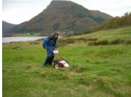
Slått for første gong på 40 år er tungt