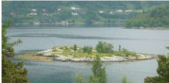
Figur 9 På holmen Blæja finn vi ein ternekoloni. Holmen bør ryddast.

For mange fugleartar som krev eit oppe landskap for å hekke vil ein generell auke i skogdanninga vere ein trussel. Dette gjeld spesielt det opne lyngheilandskapet, generelt langs strandsona, på Blæja og Raudøyholmen.