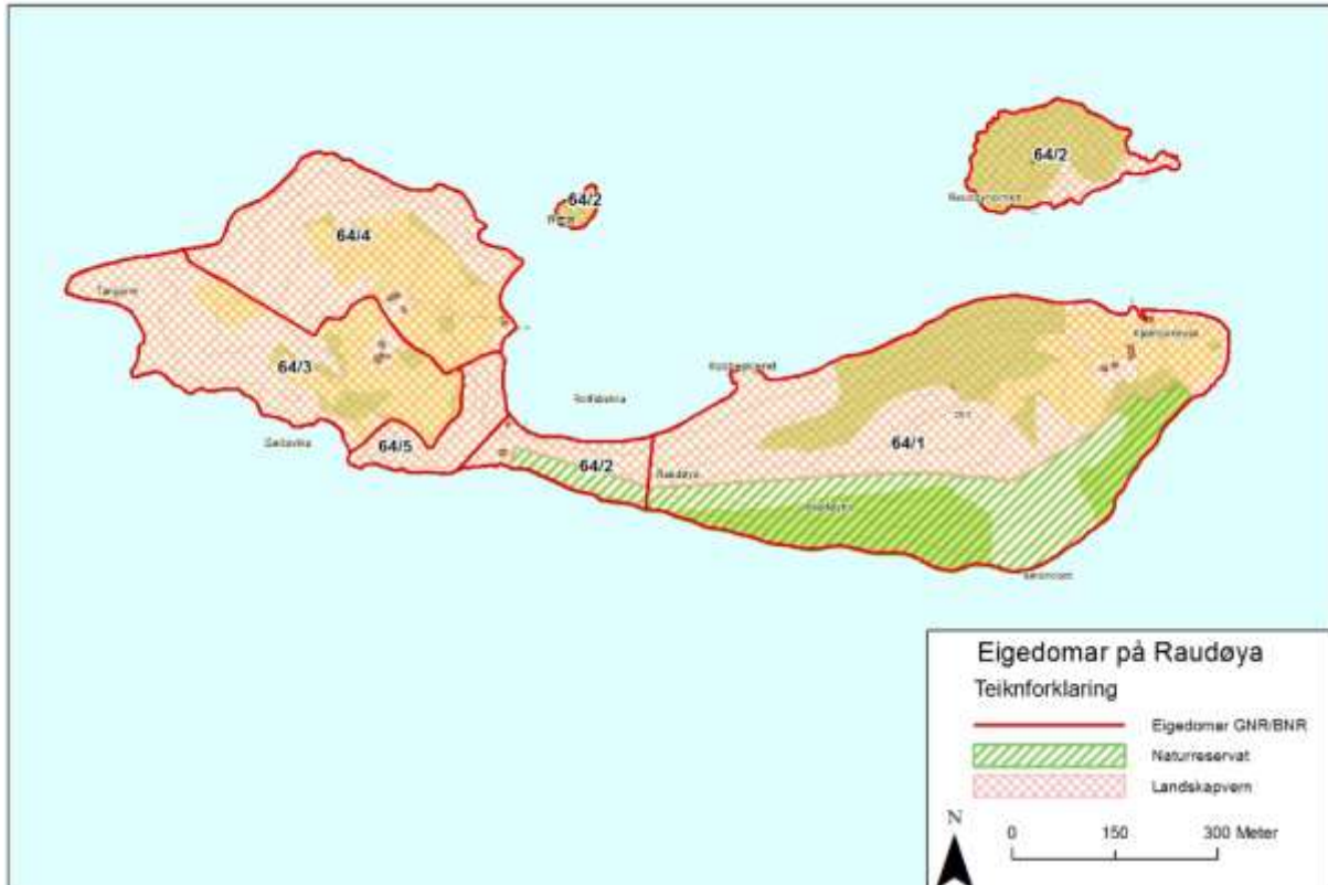
Figur 4 Oversikt over dei ulike bruksnumra på Raudøya.

Raudøya naturreservat gjeld i følgje verneforskrifta følgjande gnr/bnr: 64/1,2,4 og er på om lag 78 da. Så godt som alt areal ligg på statens grunn på gnr/bnr 64/1. Raudøya landskapsvernområde omfattar i følgje verneforskrifta følgjande gnr/bnr: 64/1,2,3,4 og 5, og er på om lag 380 da. Ut frå nytt kartgrunnlag ser det ut som om det er feil i begge forskriftene. Naturreservatet omfattar ikkje 64/4, og landskapsvernområdet omfattar i tillegg 64/5. Dette vil bli retta med det første