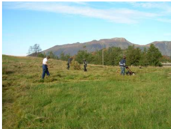
Figur 19 Kjekke ungdomar i arbeid på slåttemarka.

Det bør opnast opp for å fjerne kristtorn som etablerer seg på slåtte- og beitemark i landskapsvernområde. Større kristtorntrær bør òg kunne klippast etter nærare retningslinjer.