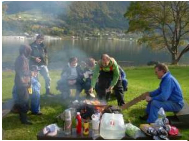
Figur 16 Elevane ved Ørsta ungdomsskole, avd. Liadal testar bålplassen dei har laga.

Området er mykje nytta av båtfolket om sommaren. Desse kjem naturlegvis sjøvegen og dei fleste nyttar seg av flytebrygga som er lagt ut ved naustet og den gamle støa. Dei aller fleste nyttar området til dagsturar, men nokre overnattar òg på både Instøya og Raudøyholmen.