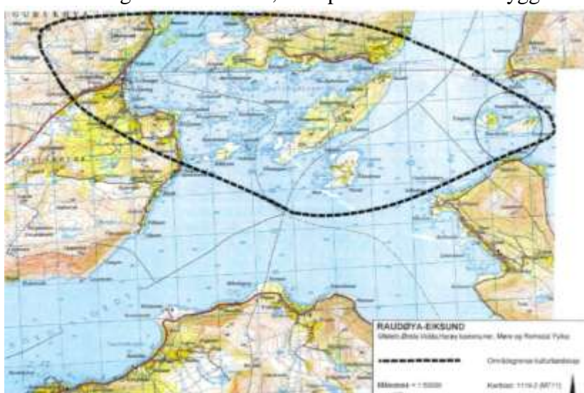
Figur 3 Raudøya som del av verdifullt kulturlandskap i landskapsregion ytre fjordbygder på Vestlandet.

Berggrunnen består i hovudsak av harde gneisbergartar som inneheld band og flekkar av mørk lettare forvitrelege bergartar. Delar av berga er blankskurd, men på sidene av slake ryggar finn ein ofte eit tynt lausjorddekke, dels morene og dels marine avsetjingar. Ved dei brattaste berga i sør finn vi òg blokkmateriale. Rullesteinsmark finn vi nær ved og i sjølve strandsona. Inne i førekomstane av kristtorn er jordsmonnet mørk mold, med innslag av stor stein. Store delar av øya er dekt av torv. Alle dei djupaste lausavsetningane har vore dyrka.