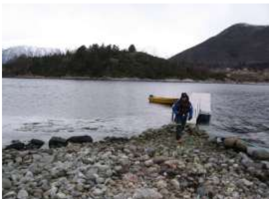
Figur 15 Flytebrygga er det første møtet med Raudøya for dei fleste.

Det er fylkesmannen som har forvaltingsansvar for det sikra friluftsområdet, medan det er Ørsta kommune som har ansvaret for tilsyn og drift. For eit par år sidan fekk Ørsta kommune laga ein enkel forvaltingsplan for friluftsområdet på Raudøya. Planen er i hovudsak knytt til innmarka på Instøya. Denne planen er godkjend av fylkesmannen. Planen er i tillegg til å fremje friluftinteressene med på å byggje opp under verneformålet i landskapsvernområdet. I planen vert det synleggjort kva tiltak det var behov for å få utført dei næraste åra. I tillegg vart behovet for fortløpande driftsoppgåver gjennom året synleggjort. Dette var eit strategisk