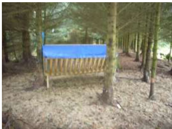
Figur 12 Godt ly og god mat er viktig, men treslaget bør fasast ut over tid.

Forskriftene i kapittel IV er ikkje til hinder for vedlikehald av eksisterande gjerde, men oppføring av nye, faste gjerde er søknadspliktig. Oppsetjing av flyttbare gjerde, til dømes el-gjerde, krev òg dispensasjon frå forskrifta, men det kan søkjast om eit fast gjerdemønster over fleire år.