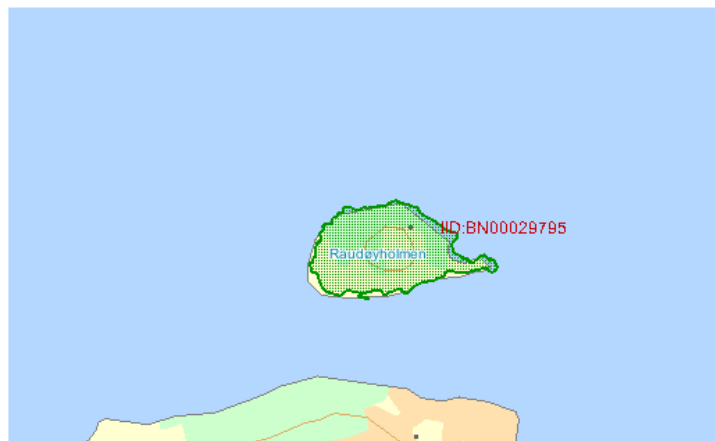
Figur 7 Raudøyholmen med sine kulturminne og kystlynghei.