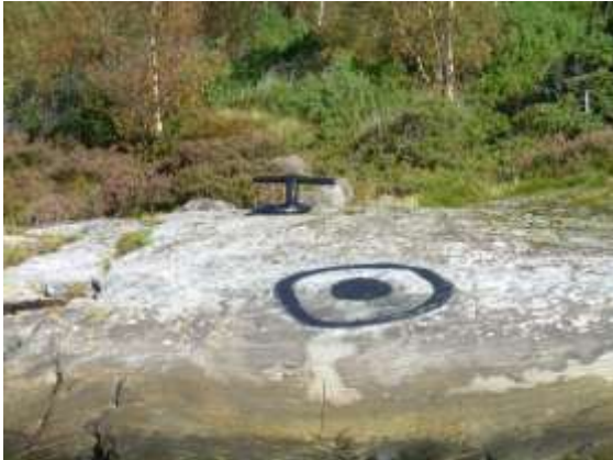
Landfeste med merke pussa og måla