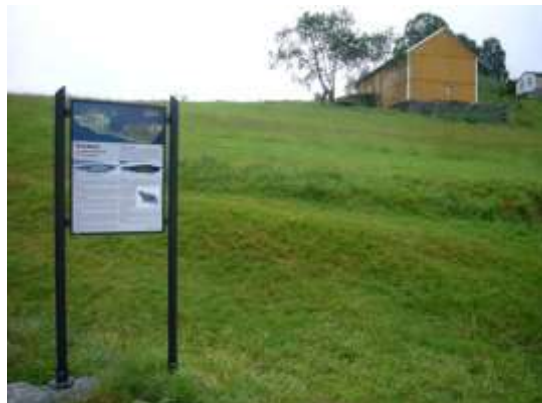
Figur 14 Informasjonstavle er sett opp ved naustet.