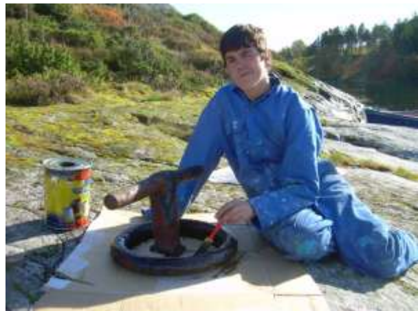
Figur 10 Eit gammalt landfeste vert pussa og måla.

Faste fornminne er automatisk freda etter "Lov om kulturminne". I nyare tid har Per Fett (1950) kartlagt fornminna på øya som del av kartlegging og skildring av fornminne på Sunnmøre. Seinare (1983) er dette kontrollert og registrert på Økonomisk kartverk (Historisk museum, Universitetet i Bergen). I alt er det kartlagt 8 gravrøyser eller samlingar av gravrøyser, sjå vedlagte kart. (A.O. Folkestad 2006)