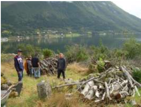
Gammal hagemark blir rydda for tre