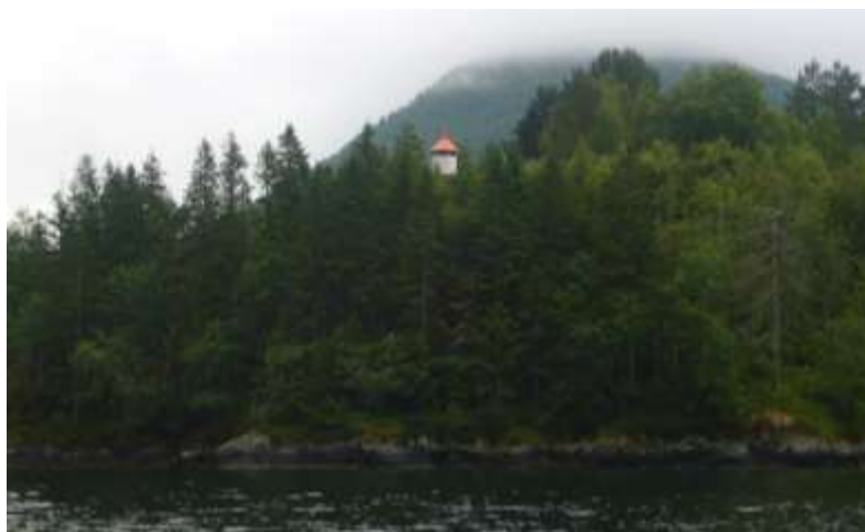
Figur 17 Grantrea mellom fyrlykta og sjøen bør fjernast.

Kystverket har eit fyr på Raudøyholmen, F1 304600 Raudøy, sjøkart nr. 30. Dette fyret har viktige sektorliner over delar av hovudøya i tillegg til Raudøyholmen. Dersom ein ikkje får gjort noko for å halde trevegetasjonen stabilt nede vil større tre etter kvart vekse inn i siktlinene til dei ulike sektorane frå fyret. Nokre sektorar på Instøya går over naturreservatet. Fylkesmannen erkjenner at Kystverket har eit viktig samfunnsansvar ved å hindre ulykker til sjøs. Men som forvaltningsstyresmakt for dei verna områda føreset vi at det vert søkt om dispensasjon frå vernereglane. Fylkesmannen må handsame søknader om denne typen dispensasjonar etter § 48 i naturmangfaldlova.