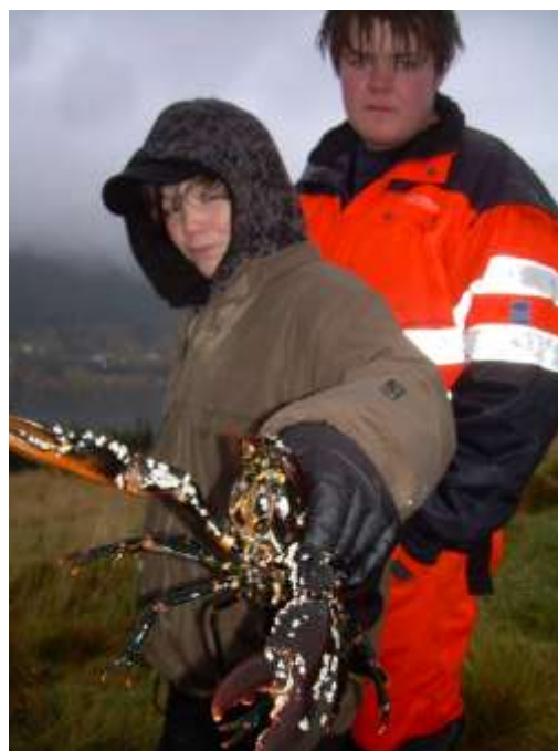
Figur 13 Stolte fangstmenn med base på Raudøya.

I område som staten ved DN har kjøpt inn til allment friluftsområde har DN gitt fylkesmennene myndigheit til å avgjere om det kan drivast jakt. Fylkesmannen i Møre og Romsdal som representant for grunneigaren (staten) vurderer jaktverdiane i friluftsområdet som så små i forhold til verneverdiane og