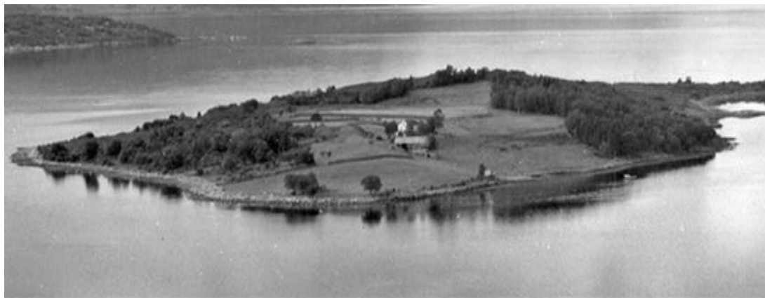
Figur 5 Instøya med velstelt innmark fotografert 1956.

Ein viktig naturtype på Raudøya er kystlynghei. Kystlynghei er eit samleomgrep for trelause, lyngdominerte heiar langs kysten. I Noreg vart dei danna alt for ca. 4000 år sidan av menneske som mellom anna trong beiteområde for husdyr, særleg vinterstid. Dei vart danna og halde ved like ved brenning, beite og slått. Raudøya er ein del av eit slikt gammalt beiteområde for sau. Det er ikkje kjend at kystlyngheia på Raudøya har vore brend i nyare tid. Kystlynghei er ein menneskeskapt naturtype og er derfor avhengig av skjøtsel for å bestå. Fortsatt beiting av sau er derfor ei “førstehjelp” for å oppdretthalde verneføremålet i landskapsvernområdet.