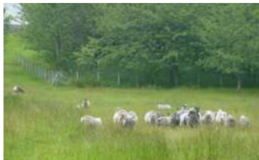
Figur 11 Viktige kulturlandskapsarbeidarane på Raudøya.

Det er planta ein del gran og sitkagran med det føremål å få le i området samt trematerial til bygningar. Desse plantingane må ikkje få spreie seg. Vi ser eksempel på småplanter av gran på Instøya, men spreieing frå sitkaplantingane på Ysteøya er meir alvorleg. Dei gamle plantingane av sitkagran bør fasast ut når ein har alternative leplassar til dyra. For å halde i hevd den prioriterte naturtypen kystlynghei på Ysteøya er det viktig at ikkje sitkagrana spreiar seg. Å stimulere til å halde fram med beitedyr er òg avgjerande for å