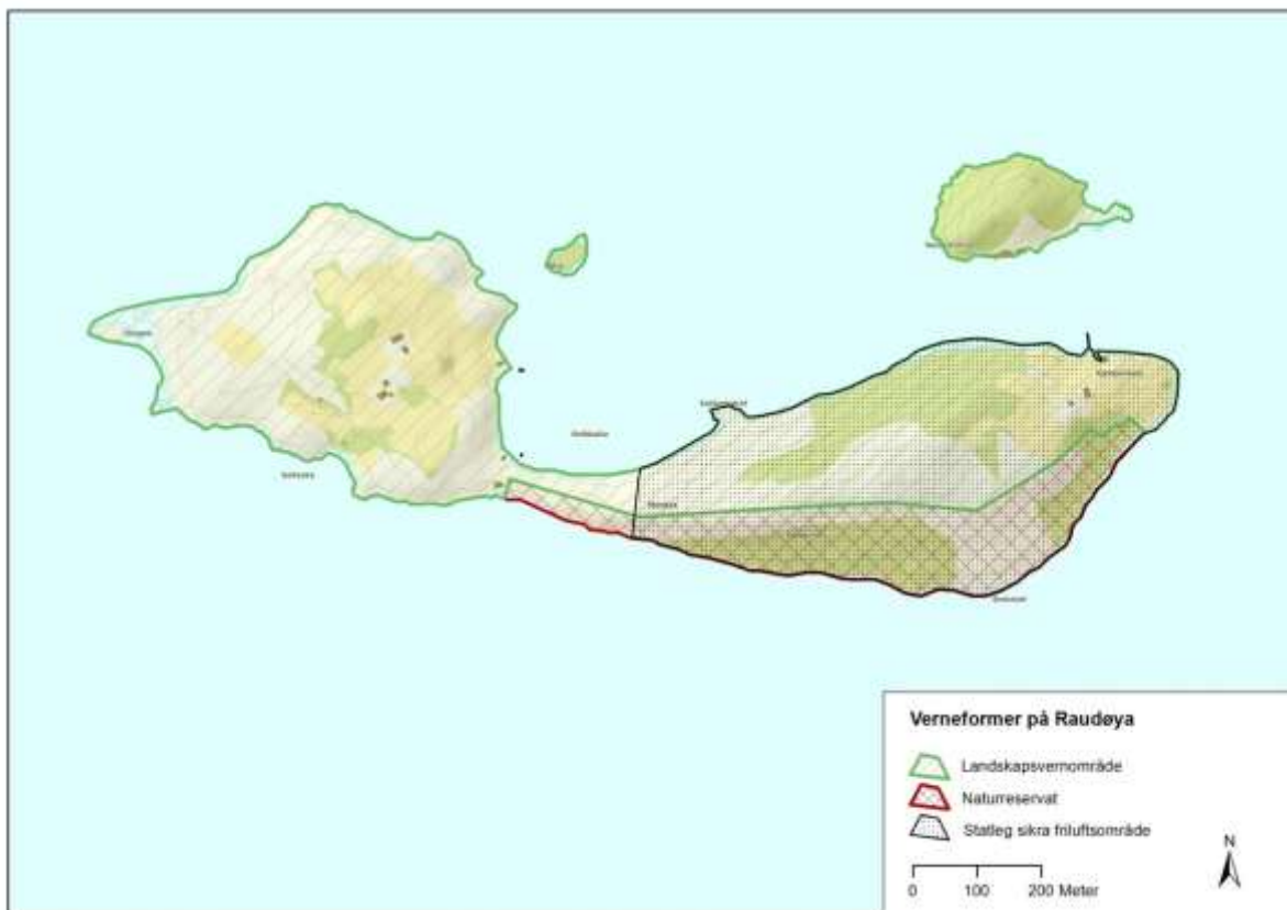
Figur 2 Heile Raudøya er verna. Den austre delen av hovudøya er òg sikra til ålment friluftsmål.

Som rettleiing for denne planen er Direktoratet for naturforvaltning (DN) si handbok nr.17-2001 med oppdateringar frå september 2010 i medhald av naturmangfaldlova. Dette er den første forvaltingsplanen som er utarbeidd for dei verna områda på Raudøya med holmane omkring.