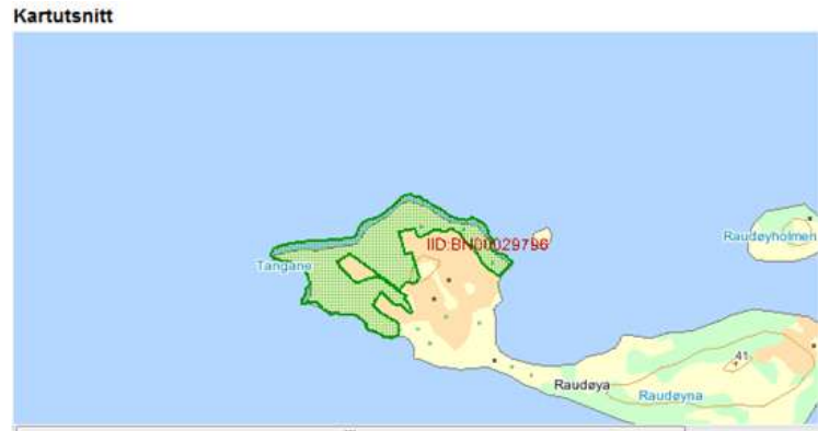
Figur 8 Det mest intakte kystlyngheilandskapet finn vi lengst vest på Ytsteøya.

Attgroing er òg ein trussel mot dei mange kulturminna både i reservatet og i landskapsvernområdet. Gravrøyser, gamle tufter og dei mange gamle steingardane på øya vert øydelagt av røtene til tre som sprengjer seg inn mellom steinane. Her er òg kristtorn ein trussel mot verneformålet i landskapsvernområdet. Det er såleis ikkje heldig at kristtorn er totalfreda i landskapsvernområdet. Dette både med tanke på at kristtorn etablerer seg i kulturlandskapet og at kristtorn slår rot langs gamle steingardar, tufter og gravrøyser.