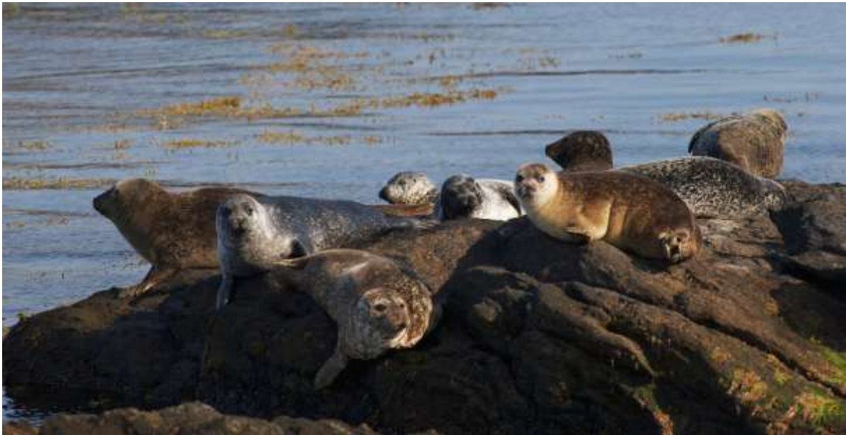
Figur 21 Er du heldig får du sjå steinkobbe langs Raudøya.