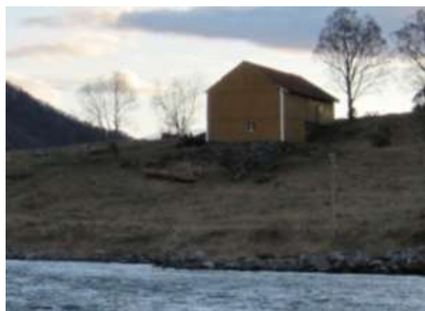
Løveggen i dag