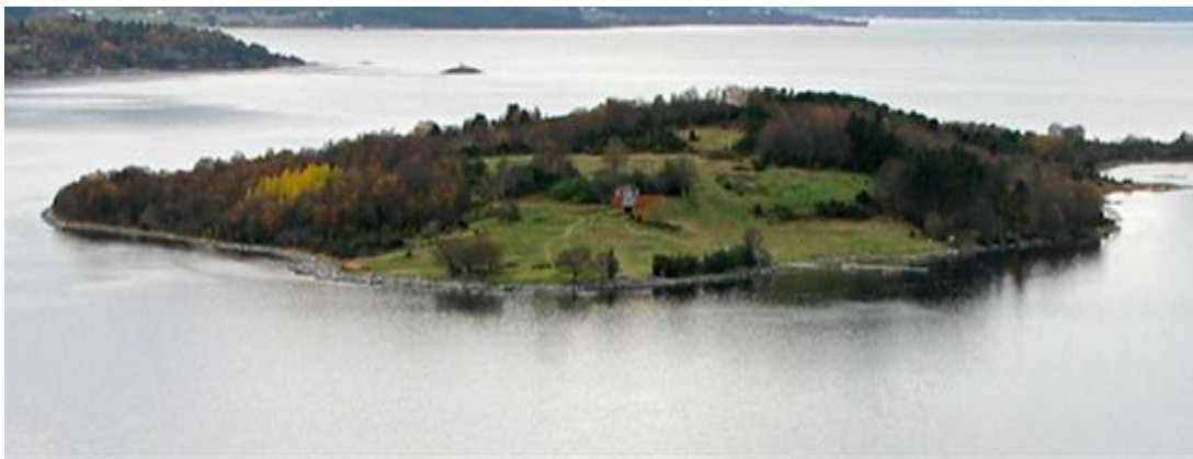
Figur 18 Tunet og innmarka på Instøya 2010 viser tydeleg teikn på attgroing.