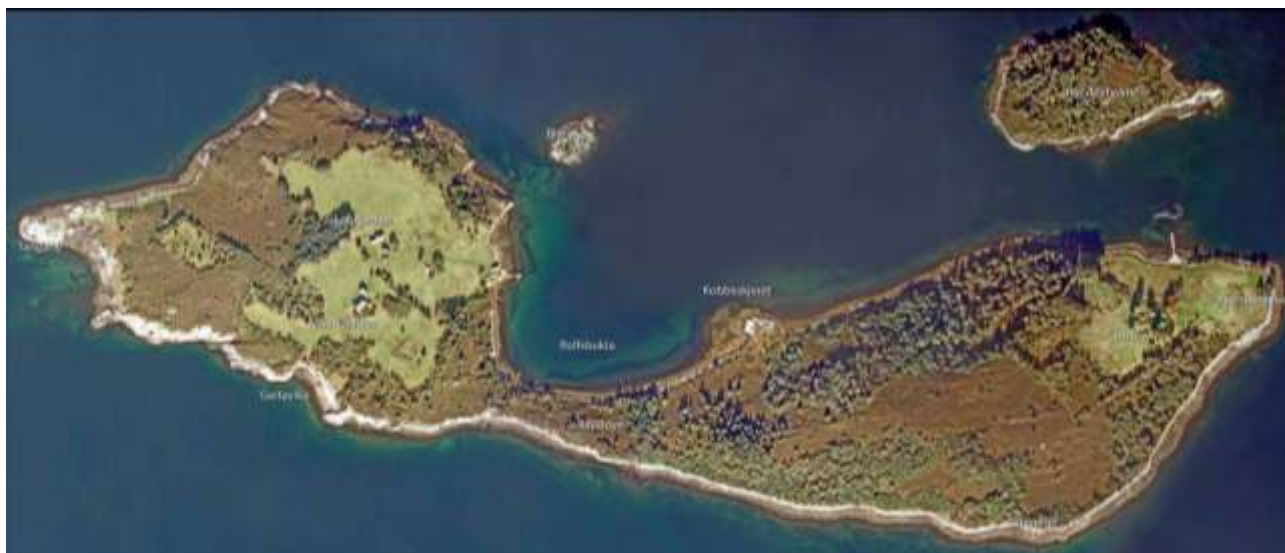
Driftfoto over Raudøya 2010