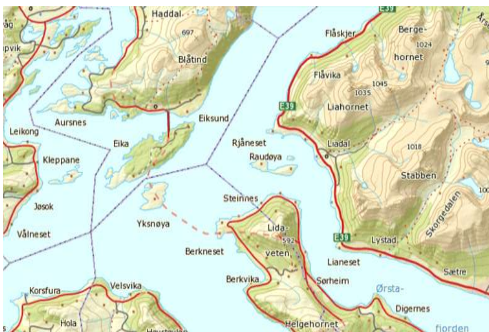
Figur 1 Som einaste øya i Ørsta kommune ligg Raudøya yst i Ørstafjorden.

Raudøya naturreservat og landskapsvernområde ligg i Ørsta kommune yst ute i Ørstafjorden der Vartdalsfjorden møter Voldsfjorden. Verneområda omfattar Raudøya, Raudøyholmen og Blæja. I 2003 blei det avsett midlar til kartlegging av registrering og samanfatning av eksisterande kunnskap om historie, kulturlandskap og naturverdiar på Raudøya. Dette resulterte i ein rapport laga av A.O. Folkestad i 2006. Rapporten inneheld eit framlegg til skjøtselplan og tiltaksplan. Dette er ein grundig rapport og mykje av den naturfaglege og kulturhistoriske informasjonen i denne rapporten er henta derifrå.