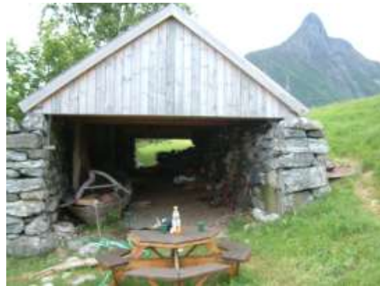
Naustet har fått nytt tak