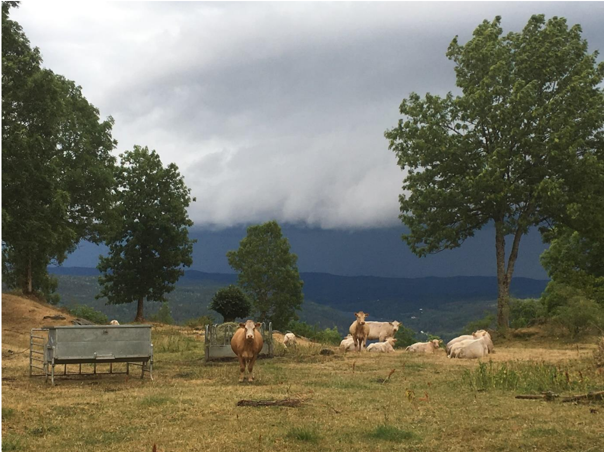
Melås i Gjerstad