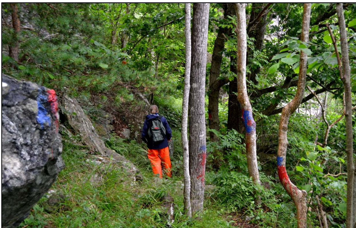
Merking av stiane i reservatet er fleire stader gjort for tett, og på ein litt for slurvete måte.