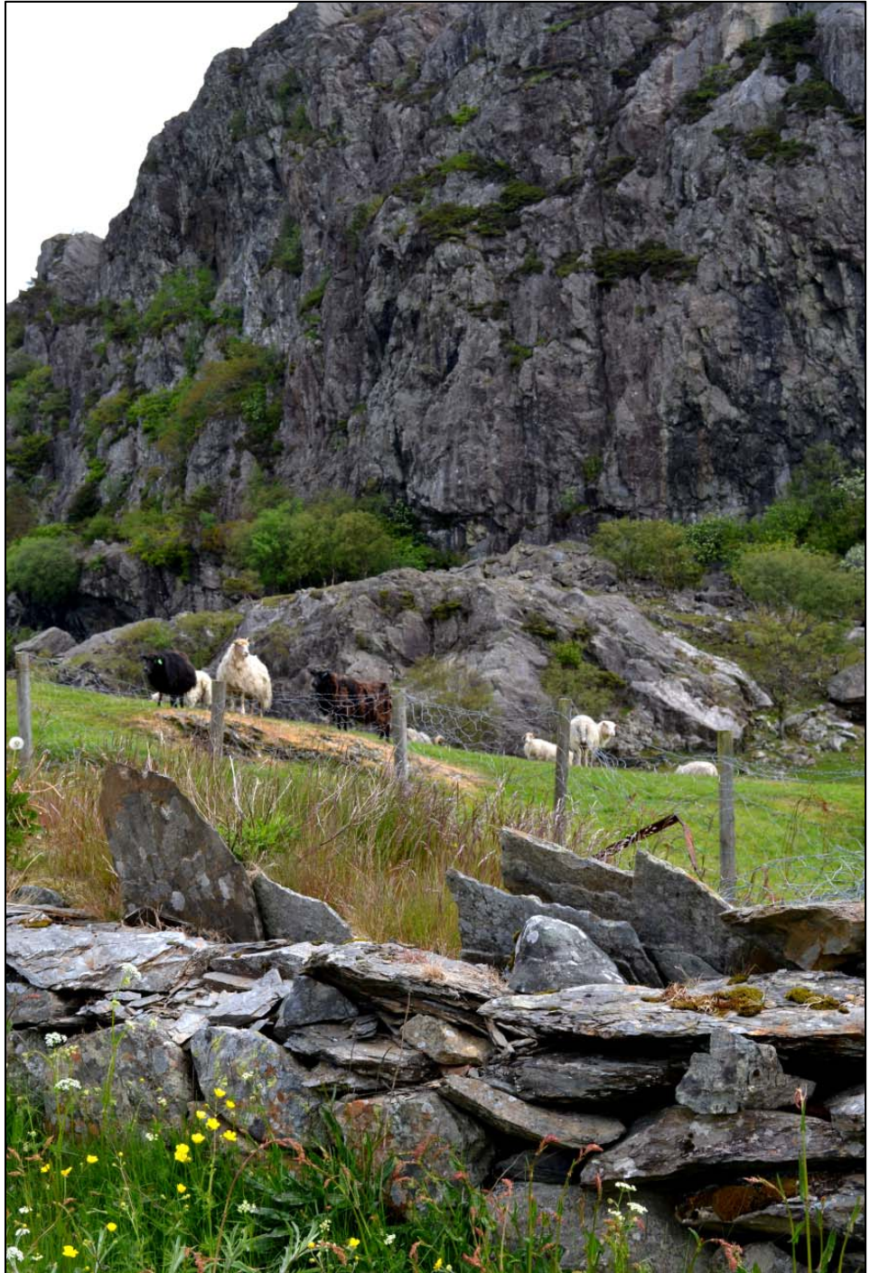
Sau på innmarksbeite på Berge, sørvest for naturreservat .

Skogafjellet naturreservat er tidlegare lynghei- og beiteland som har grodd igjen over dei siste hundre åra. Skogen har få spor av inngrep i nyare tid, og har i det store og det heile eit urørt preg. Hovudkonsekvensen av vernet er totalforbod mot utbygging og noko innsnevring i bruk av utmarka. Av brukarinteresser er vi kjend med to hovudtema som vert behandla under. Desse er husdyrbeite og bruk og vedlikehald av turstiar. Retningslinjer for bruk av Skogafjellet naturreservat er lista opp på slutten av kvart tematiske delkapittel. Desse er også lista opp samla på slutten av kapittel 3.