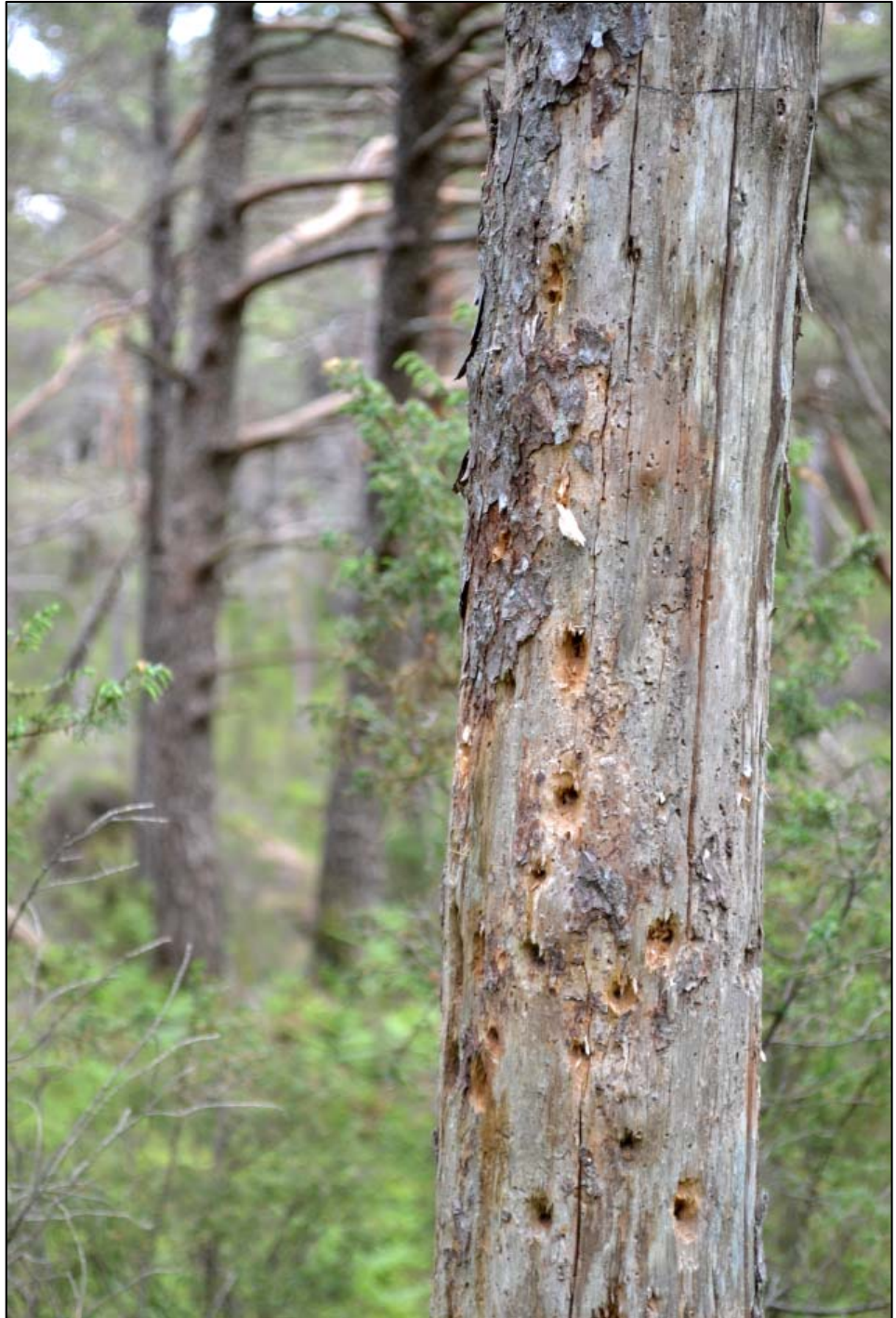
Hakkespor etter spettar i daut ved er det mykje av i reservatet.

I det pågåande arbeidet med faggrunnlag for handlingsplan for kystfurskog er det diskutert ein metode for å verdisette purpurlyngfurskog basert på storleik, dekningsgrad, variasjon i miljøet, alder på skogen og grad av inngrep. Ettersom førre grundige skildring av området stammar frå perioden 1985-1991 er det ikkje mogleg å seie noko om korleis purpurlyngfurskogen i Skogafjellet naturreservat vil passe inn i eit slikt system, og det vil vere naudsynt med ei ny verddivurdering. Det kan også vere ønskjeleg med ein revisjon av kapitla som handlar om kalkfurskog og