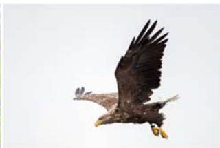
Havørn ( Haliaeetus albicilla ) er eit vanleg syn i nærleiken av Skogafjellet naturreservat. Dette er den største rovfluga i Nord-Europa.