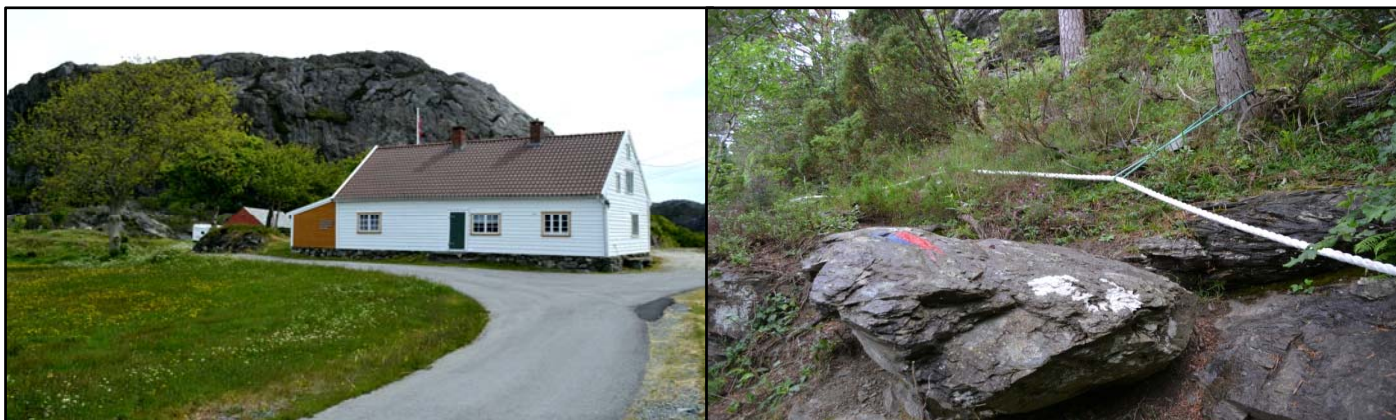
Venstre: Bergeshuset på Berge. Høgre: Sikring av stien i den nedre delen av reservatet.