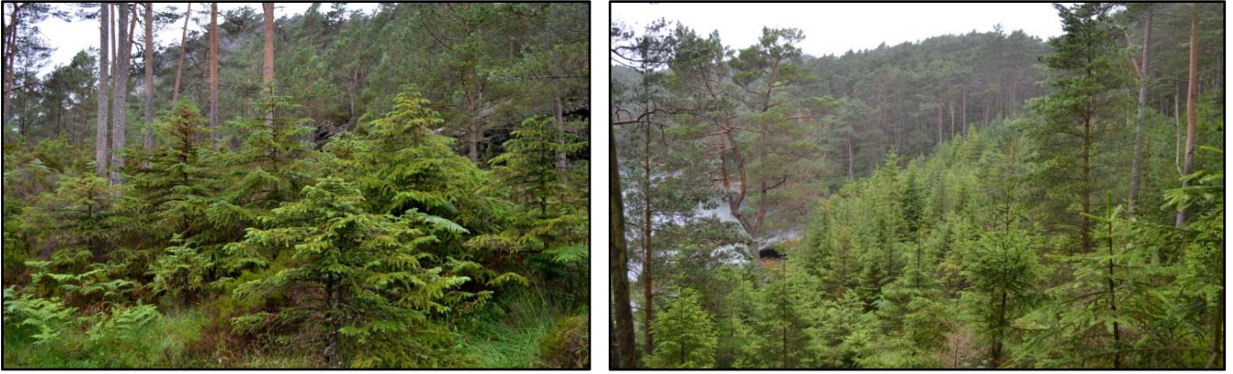
Venstre: Sitkagrana aust for reservatet. Høgre: Norsk gran i Skåravågen.