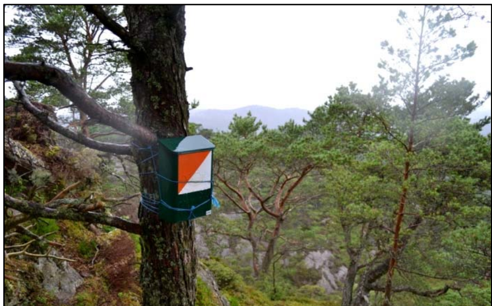
Postkassa på Dugnadssåta er mykje besøkt.

Status på stiane i området, og dei endringane som følgjer av slitasje skal vurderast fortløpande av Fylkesmannen og Statens naturoppsyn gjennom synfaring. Den øvre stien går gjennom ganske fuktig terreng, og det kan difor bli aktuelt med tilrettelegging og klopping for å minimere slitasjen på utsette strekk.