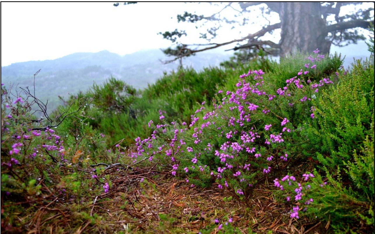
Purpurlyng på Dugnadssåta.

Delar av Skogafjellet naturreservat har i dag rimelig spreidd trevekst, og skogbotnen har difor gode lysforhold. Det er mogleg at kronesjiktet i framtida vil bli tettare enn det er i dag, og at dette kan påverke purpurlyngen. Likevel vil dette truleg skje over svært lang tid, og er ein naturleg prosess i eit barskogreservat. Slik sett har Skogafjellet naturreservat eit potensiale som studieområde for skogsuksesjon og påverknad på purpurlyng og andre feltsjiktartar.