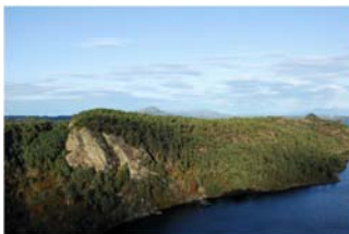
Skogafjellet naturreservat med Bergesvatnet i forgrunnen. Dugnadsstida er den vesle toppen til hegre i bildet. Sett frå Bergesfjellet.