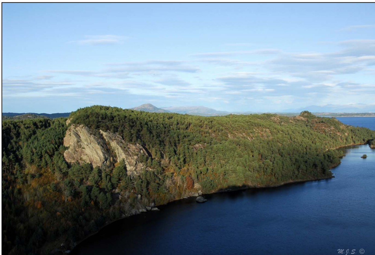
Skogafjellet naturreservat sett frå Bergesfjellet.

Brev om oppstart av planarbeidet vart sendt ut til grunneigarar, kommunen og aktuelle lag og organisasjonar den 14. mai 2012. Her blei partar og interesserte inviterte til eit informasjonsmøte på Bømlo folkehøgskule som vart gjennomført 8. juni 2012. På dette møtet vart bakgrunn for vernet og føremålet med ein forvaltningsplan presentert, og fram møtte fekk anledning til å uttale seg om planane og den vidare prosessen. Sakshandsamar hjå Fylkesmannen var på synfaring i området same dag, 8. juni 2012, og saman med Statens naturoppsyn den 27. juli 2012.