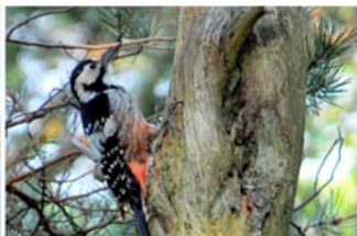
Kvitryggspett ( Dendrocopos leucotos ) held til i Skogafjellet naturreservat og hakkespor i daut ved er eit svært vanleg syn.