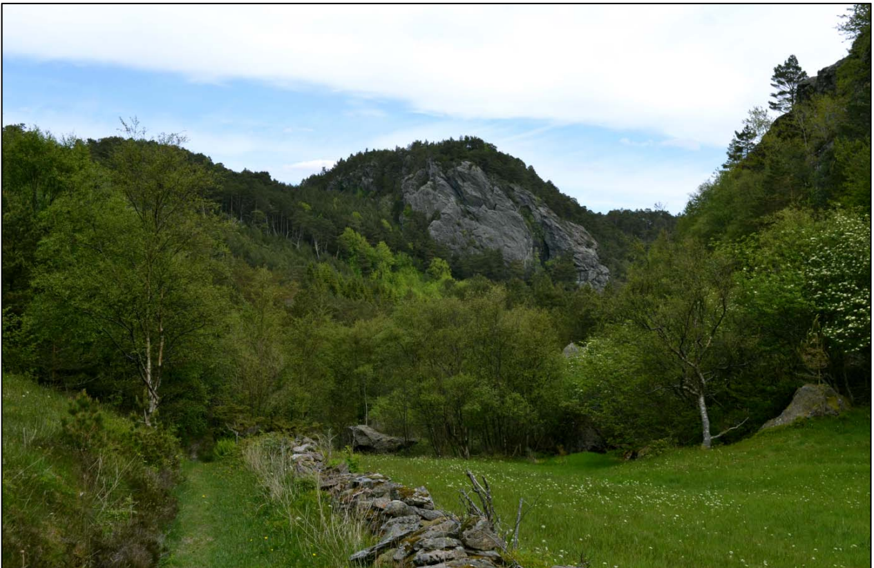
Restar av gamal slåtteng og stien inn mot reservatet.

I førre hundreår var det lynghei i området, og ei omfattande gjengroing har ført til dagens vegetasjon med furuskog i området. Det finst spor etter hogst før vernet på små flater ned mot Bergesvatnet, men dette er av lite omfang. Mot aust grenser området mot grøfta myr som er tilplanta med sitkagran ned mot Steinavikane, og det veks også gran både vest og nord for reservatet.