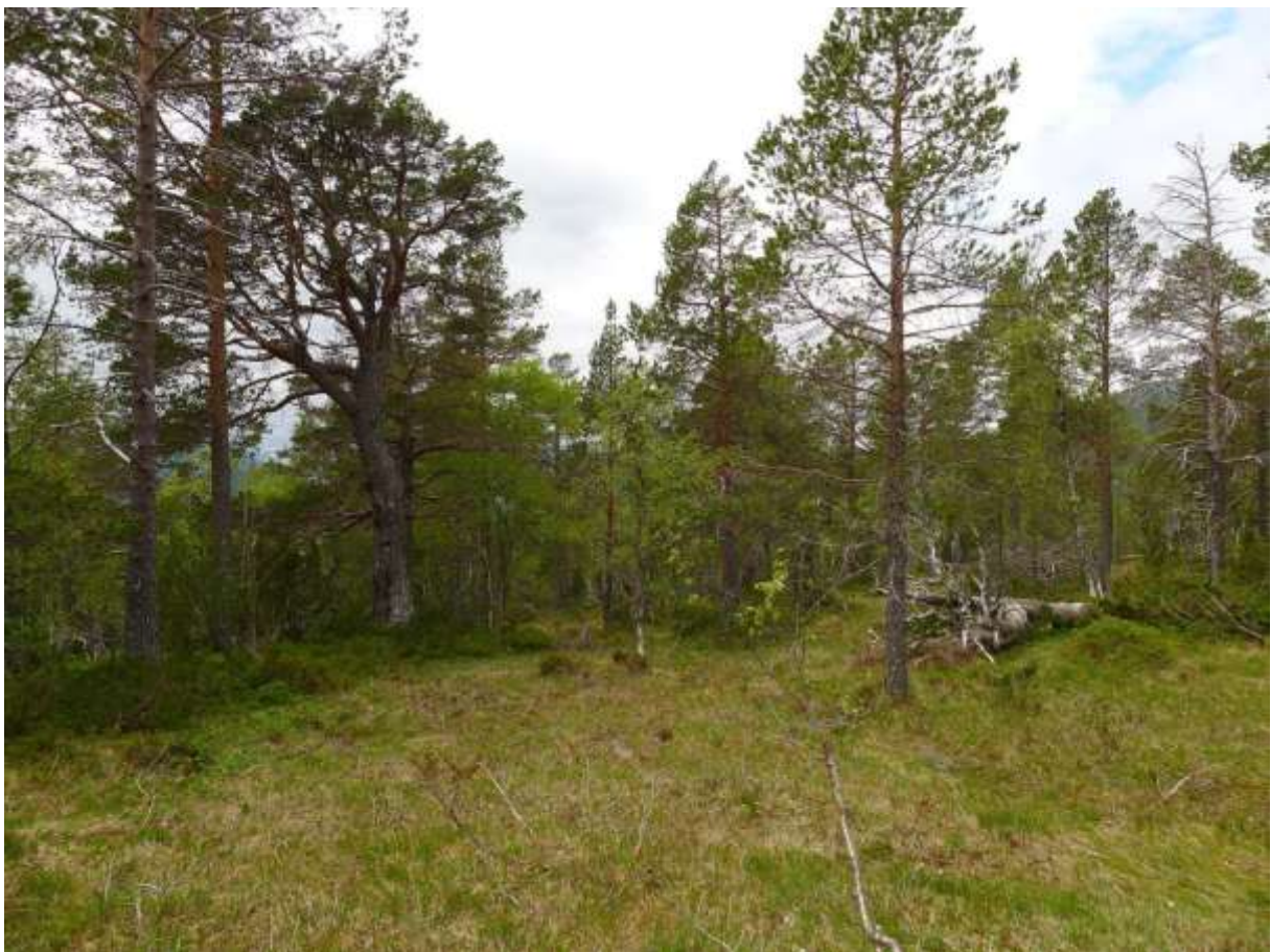
Figur 4.11. Frå dei øvste delane av Giskemoberget, med glissen, gammal og baserik furuskog.

Grunngjeving for verdivurdering: Lokaliteten får verdi A (svært viktig) fordi den har eit etter måten bra areal med intakt og gammal furuskog, med god skogstruktur og bra med daudved. Den fuktige utforminga, med nokså mange artar assosierte med rikmyr er også svært uvanleg, og ikkje kjend frå andre delar av Sunnmøre.