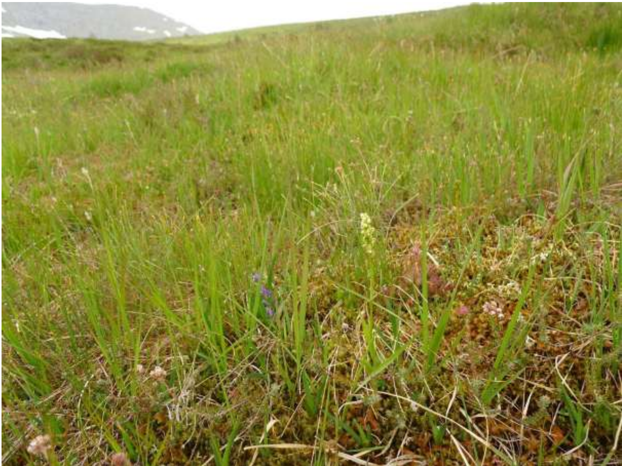
Figur 4.35. Kvitkurle (NT) i kystfjellheia vest for Kvanndalsetra.

Grunngjeving for verdivurdering: Lokaliteten får verdi B (viktig) fordi den har eit etter måten bra areal med beite kystfjellhei, er artsrik og har ein raudlisteart i lågare kategori. Kystlynghei er dessutan ein truga naturtype.