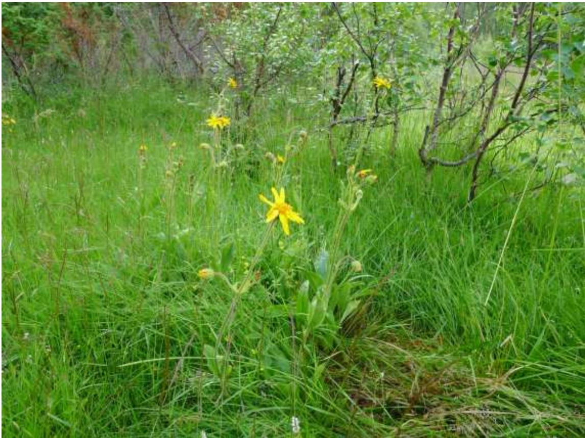
Figur 4.19. Solblom ved Svartløksetra, og som ein kan sjå gror her att.