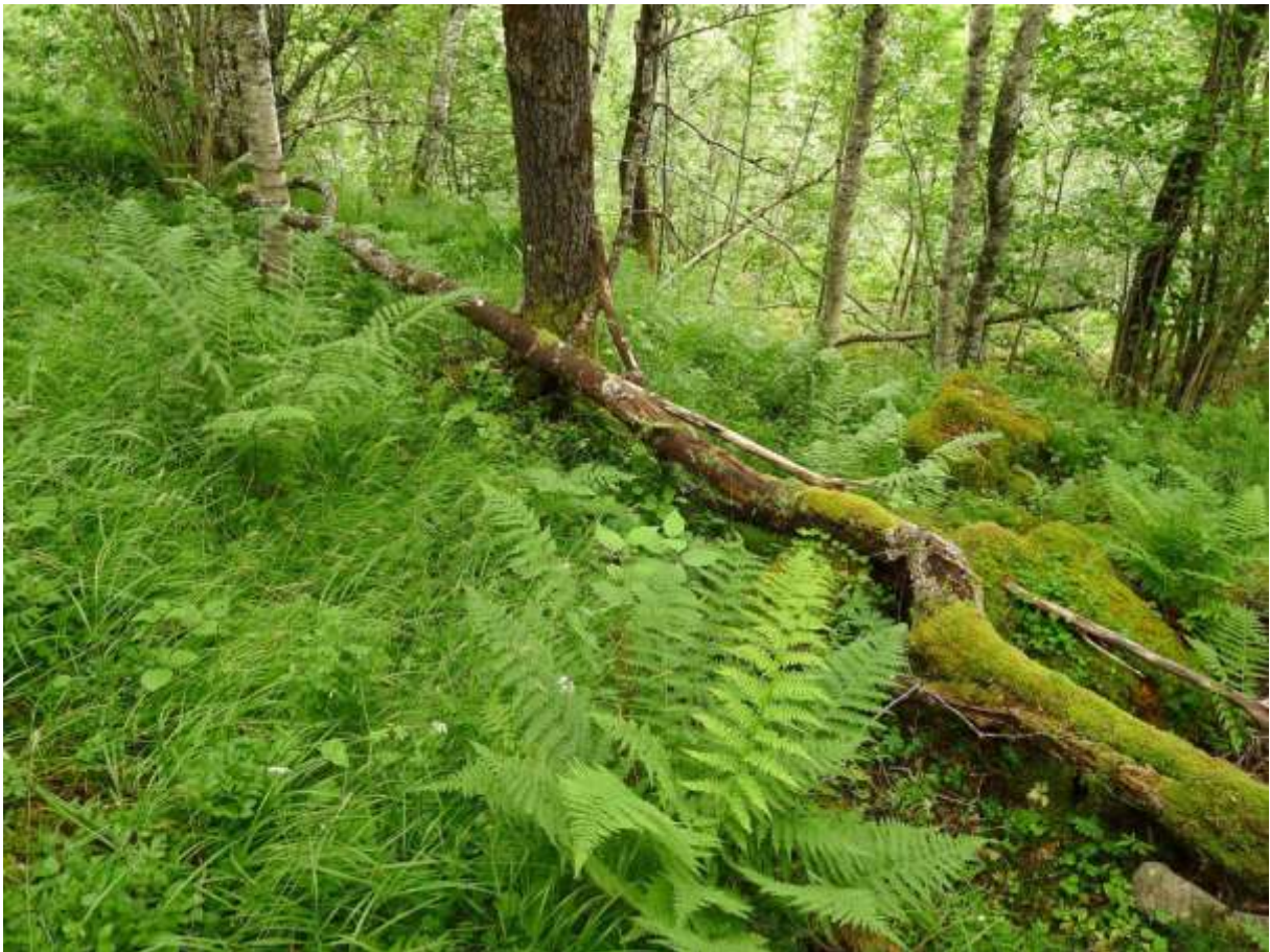
Figur 4.15. Typisk skoginteriør ved Kamben/Furenakken, med grasdominert mark og ulike lauvtre.

Grunngjeving for verdivurdering: Lokaliteten får verdi B (viktig) på grunn av den gode førekomsten av barlind (VU), som tel kring 30 buskar.