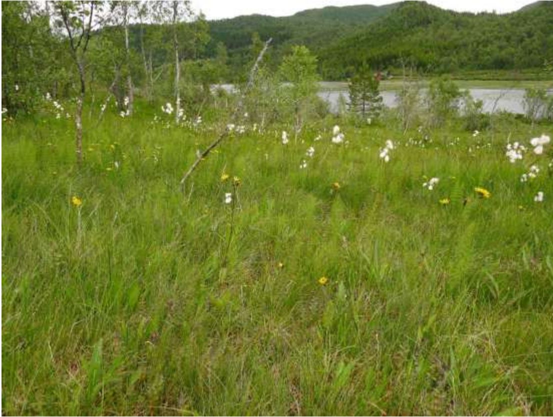
Figur 4.3. Frå området på sørvestsida av Akslevollvatnet (i bakgrunnen), med mykje breiull, myrsnelle og sumphaukeskjegg. Heilt i bakgrunnen skimtar ein Svartløkfjellet (562 m o.h.).