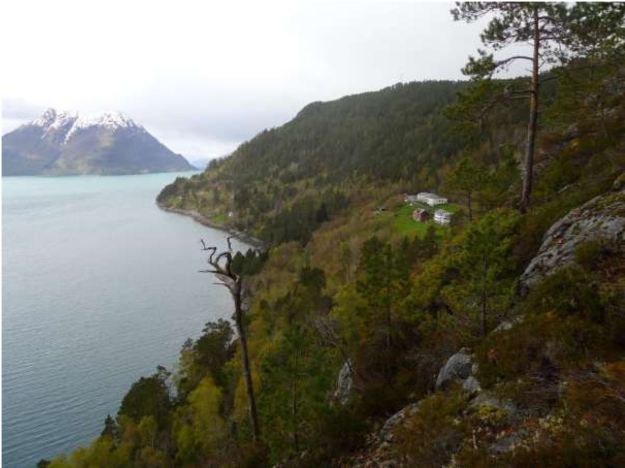
Figur 4.7. Lokaliteten Bruna er åssida bak garden Lisetvik.

Grunngjeving for verdivurdering: Lokaliteten får verdi B (viktig) fordi den har eit etter måten bra areal med intakt og gammal furuskog, med innslag av ein mindre vanleg type som fuktig furu-hasselskog.