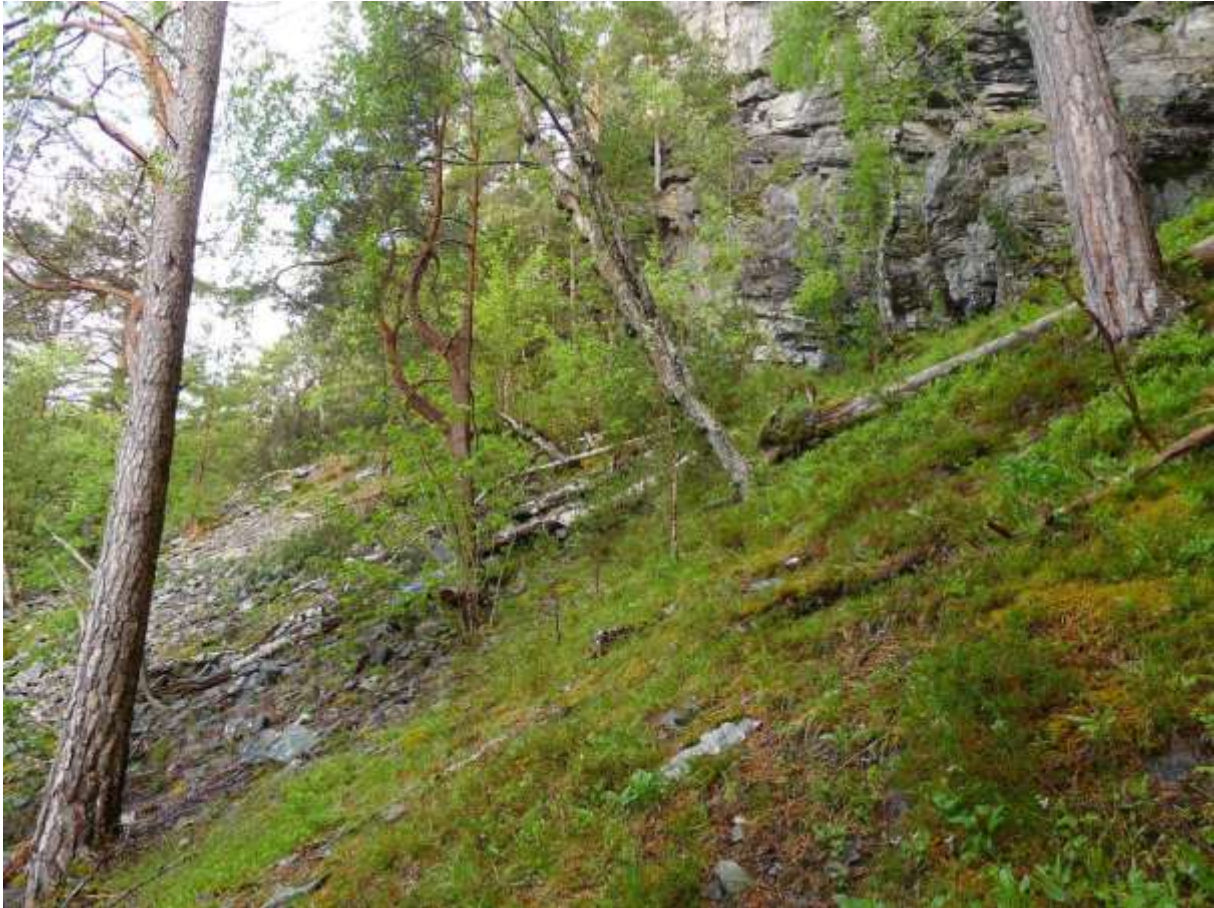
Figur 4.8. Frå furuskogen under Høghaugen, her ei tørr og svak lågurtutforming som kan minne mykje om dei rike kalkfuruskogane lenger inne i Storfjorden.