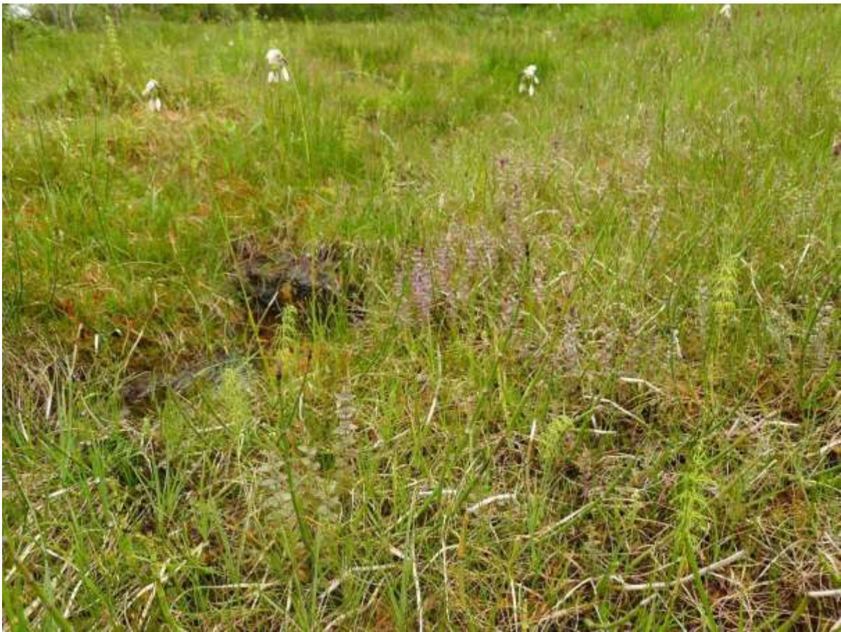
Figur 4.37. Skavgras (dei tjukke, grønne og ugreina stenglane), breiull og avblomstra svarttopp.

Grunngjeving for verdivurdering: Lokaliteten får verdi B (viktig) fordi den er nokolunde artsrik, og har førekomst av engmarihand.