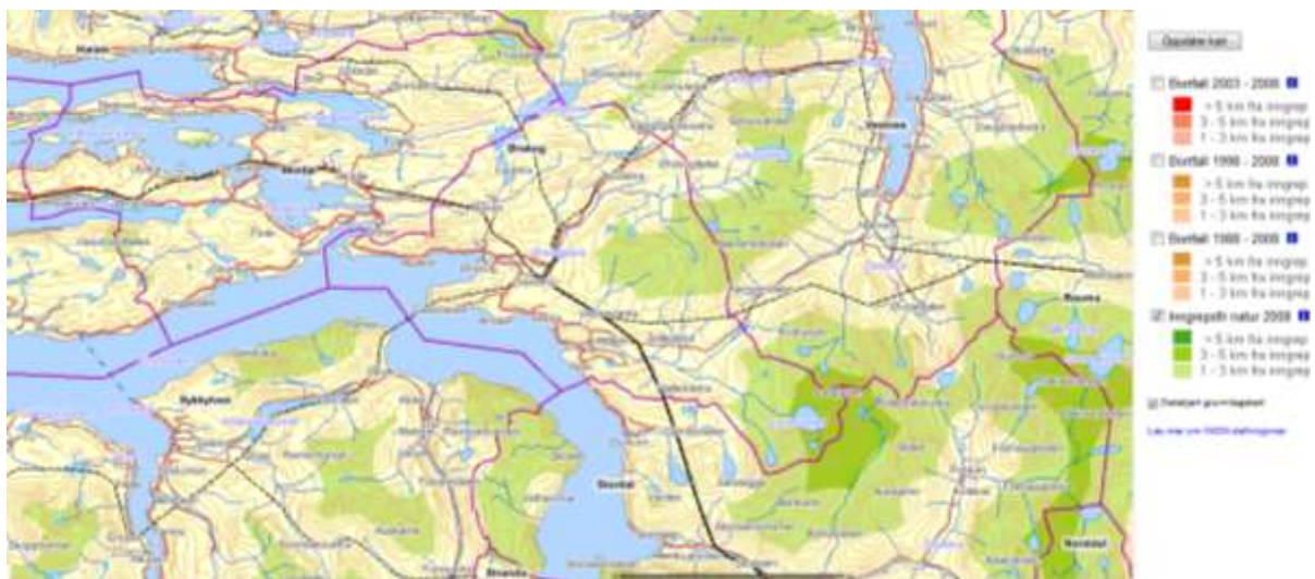
Figur 3.3. Inngrepsfrie naturområde i Ørskog ( http://www.dirnat.no/kart/inon/ ), oppdatert januar 2008.