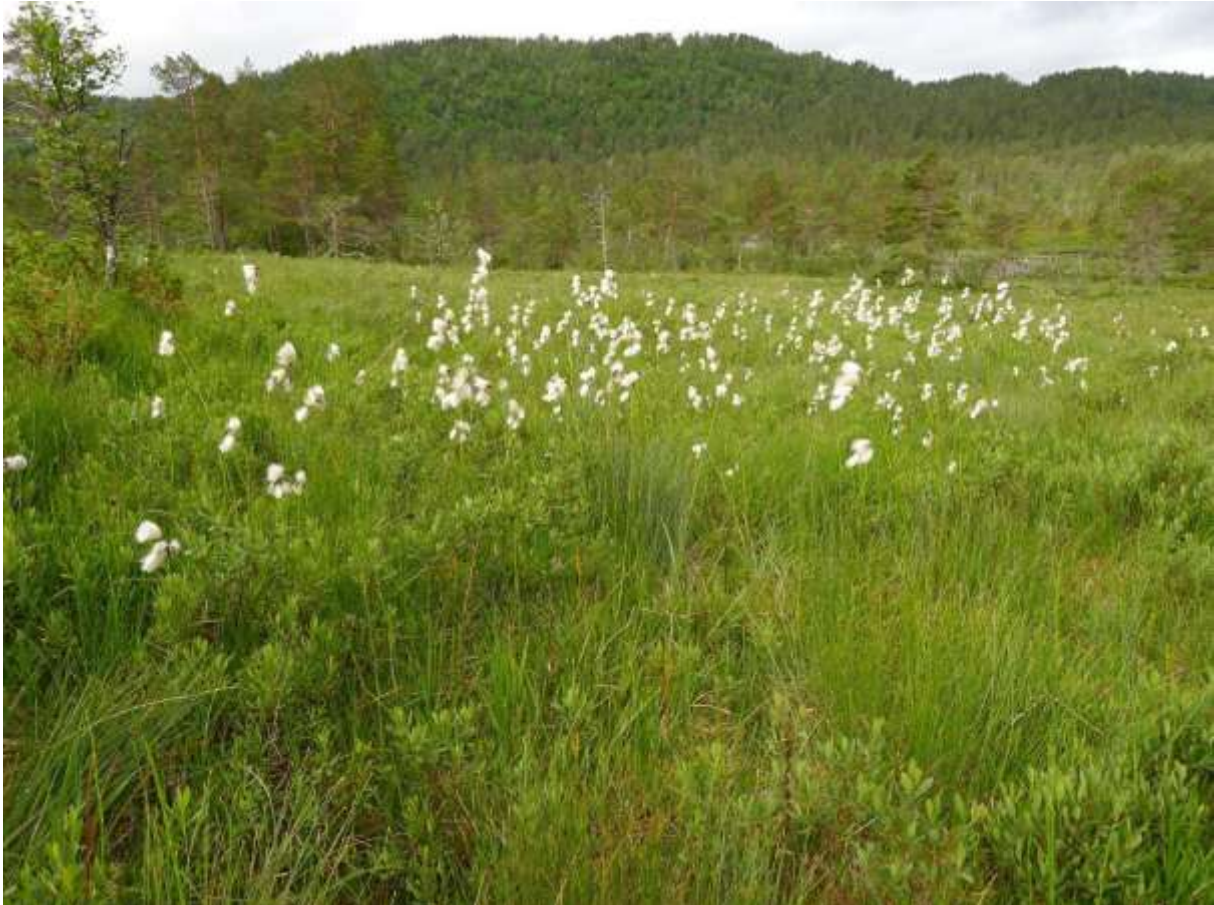
Figur4.1. Frå rikmyra nordaust for Akslevollvatnet, her med mykje breiull, bjørneskjegg og pors i framgrunnen. I bakgrunnen ser ein Furenakken/Kamben (345 m o.h.).