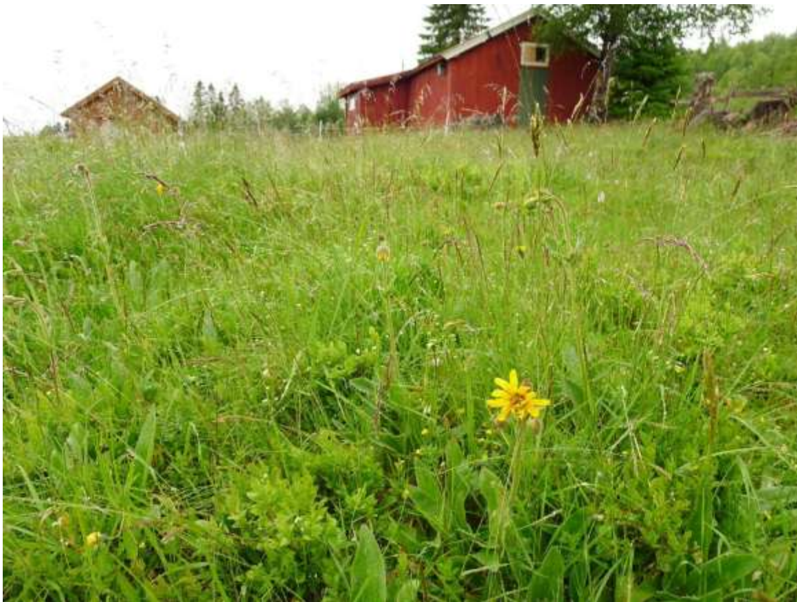
Figur 4.30. Solblom (VU) ved Sollisetra på Vaksvikfjellet i sterkt attgroande naturbeitemark, kor blåbærriis no er i ferd med å overta.