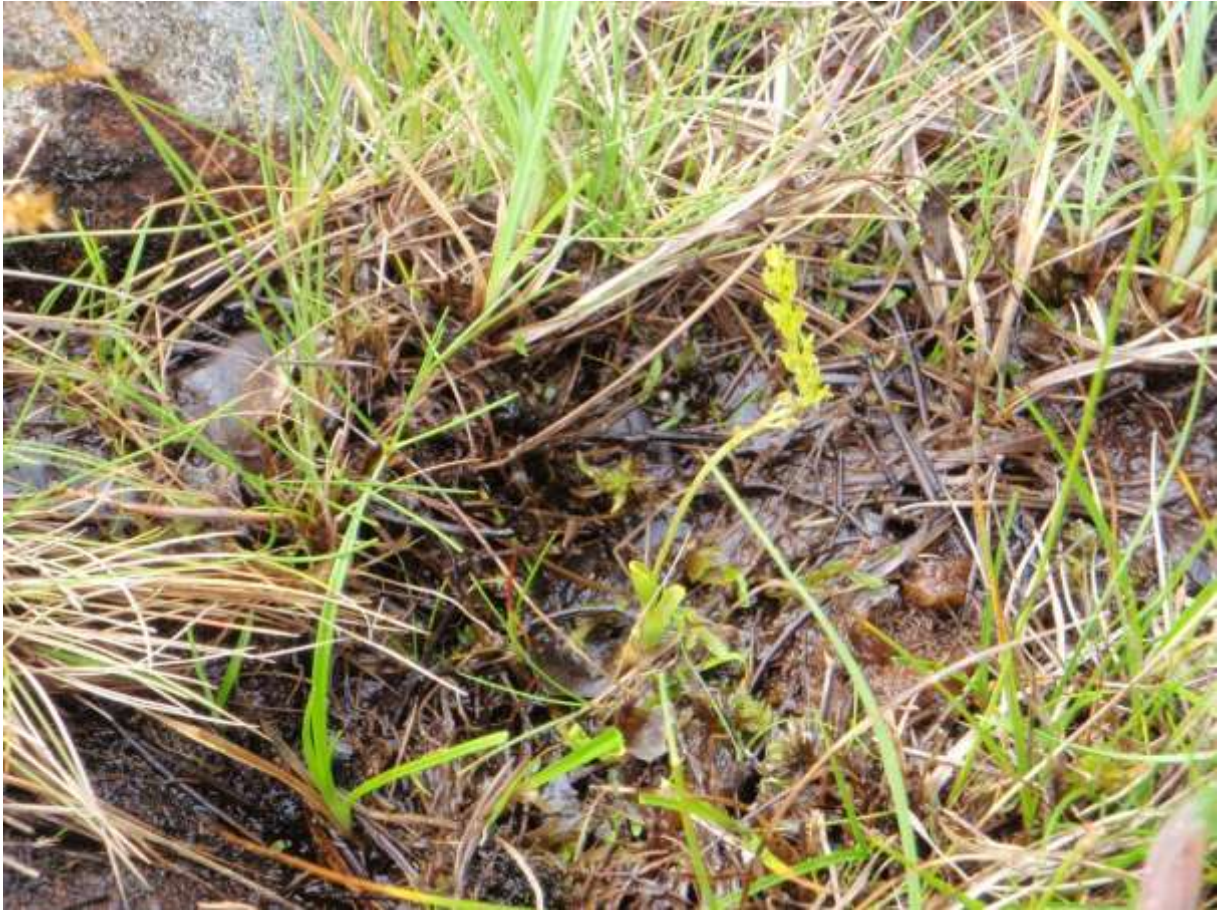
Figur 4.32. Myggblom (NT) er ei lita og spe plante, som er lett å oversjå.