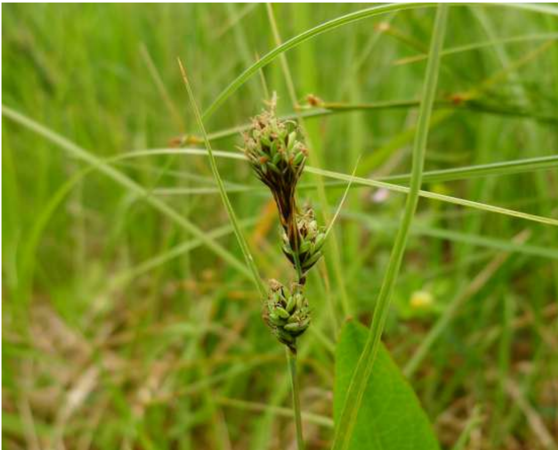
Figur 4.4. Klubbestorr er svært sjeldan på Sunnmøre, med berre eitt eller to stadfesta funn.