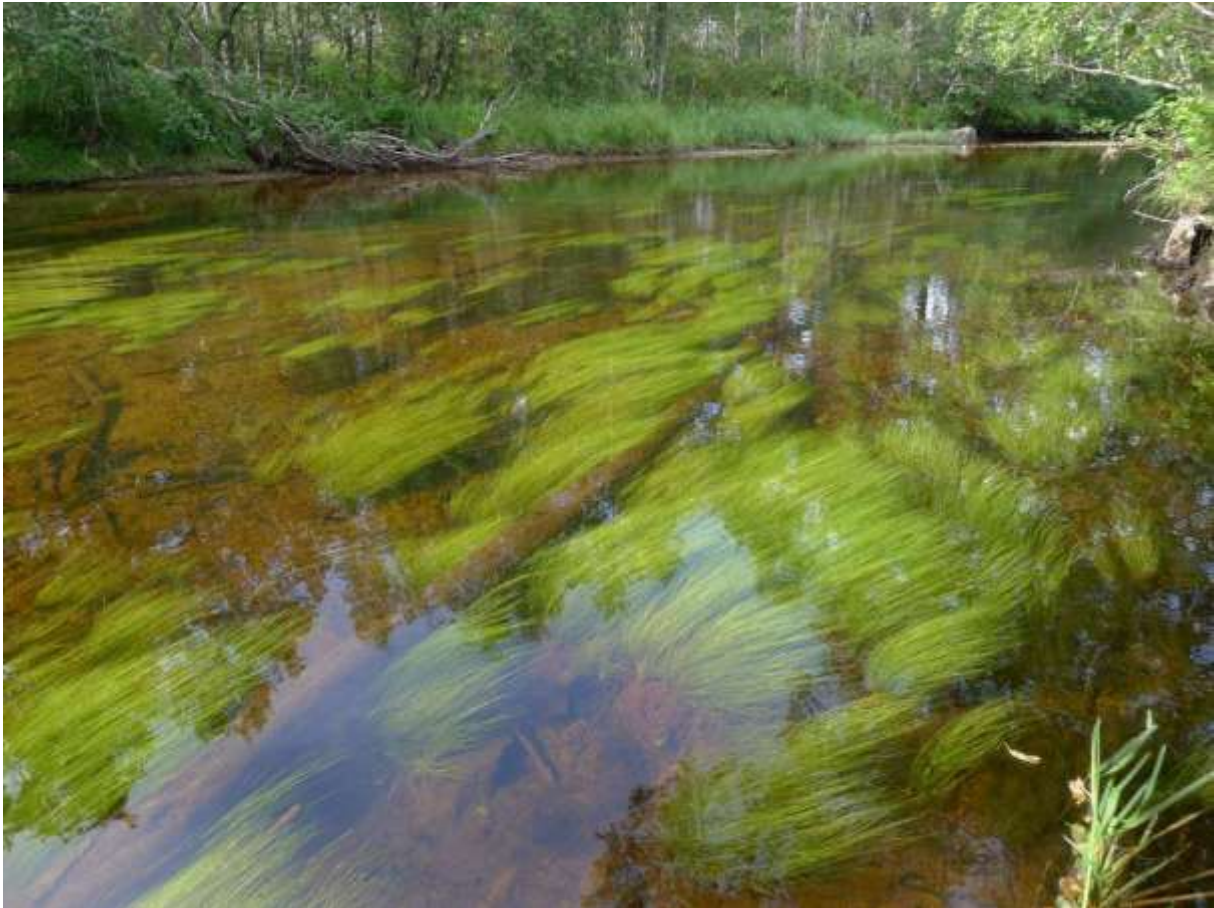
Figur 4.13. Parti frå Solnørelva med mykje krypsiv på botnen.

Grunngjeving for verdivurdering: Lokaliteten får verdi A (svært viktig) fordi den har elvemusling, samt er ei viktig elv for laks og sjøaure. Meanderar er lista som EN i raudlista for naturtypar, og vurderast som avgjerande for verdivurderinga.