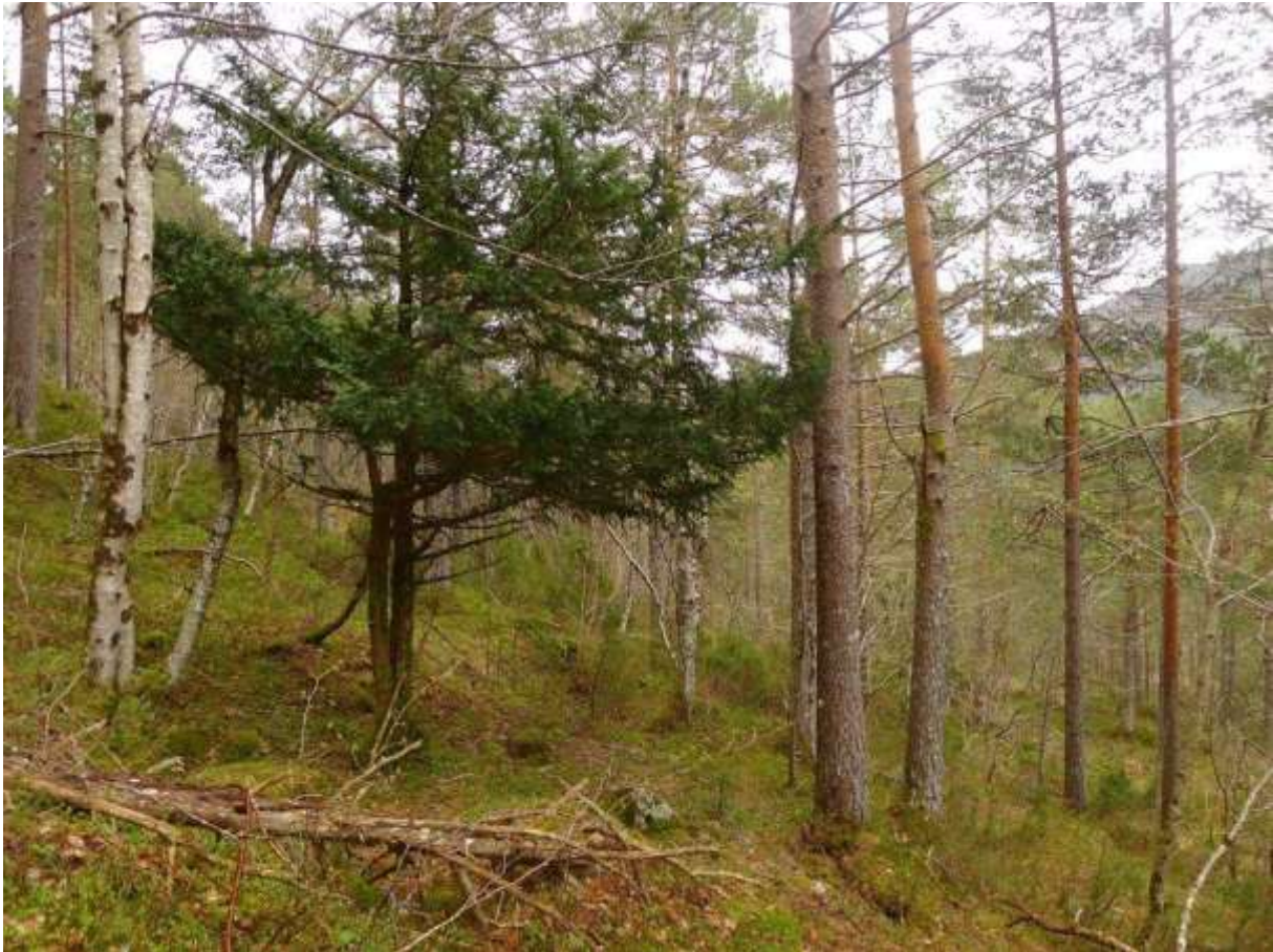
Figur 4.17. Frå Solnørdalslia, her med barlind.

Grunngjeving for verdivurdering: Lokaliteten får verdi B (viktig) fordi den har eit etter måten bra areal med intakt og gammal furuskog, med noko fuktig furu-hasselskog, og dessutan innslag av barlind (VU).