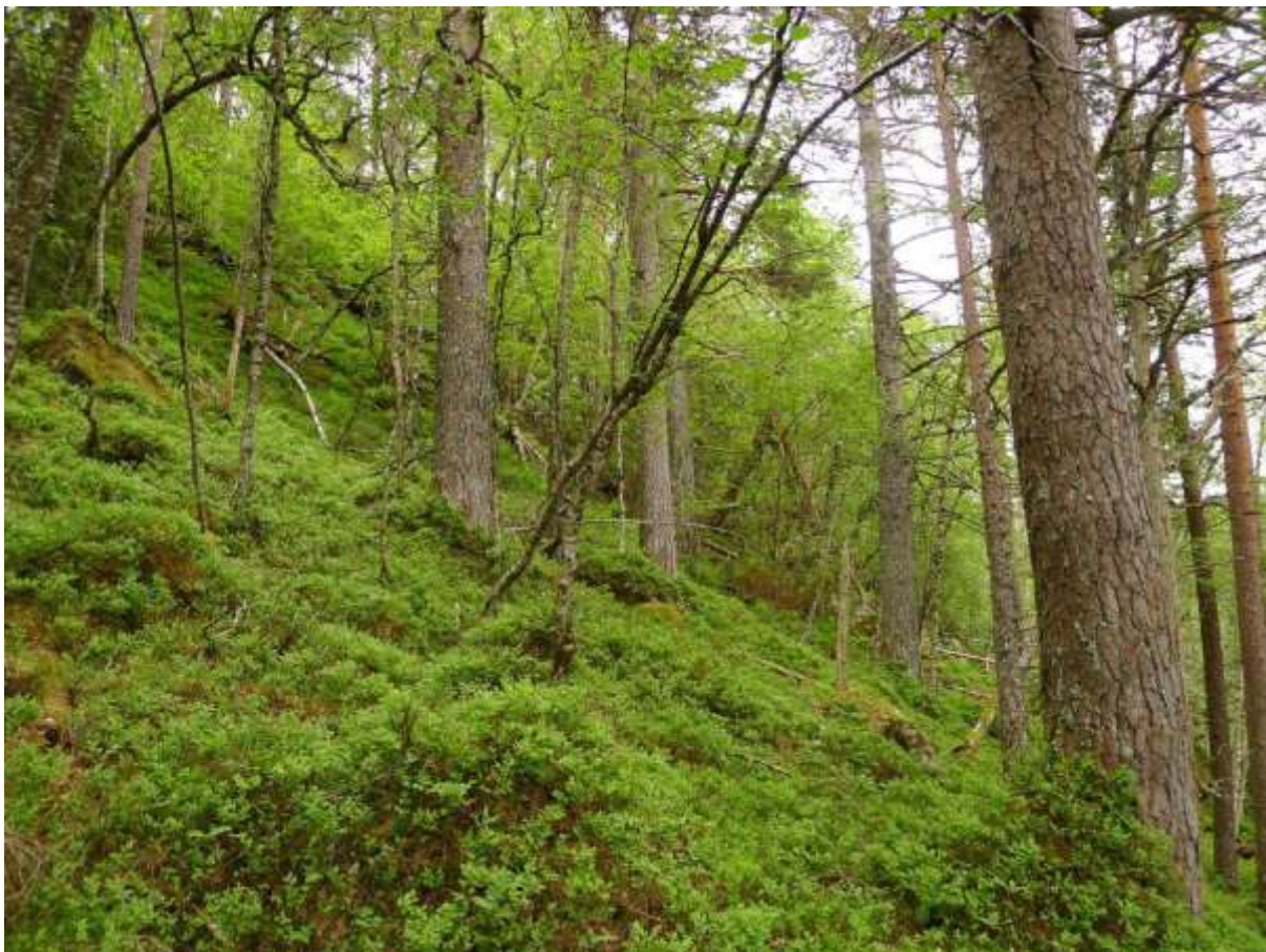
Figur 4.10. Frå dei øvre delane av Børdalen, med grov furuskog og blåbær-småbregnevegetasjon.