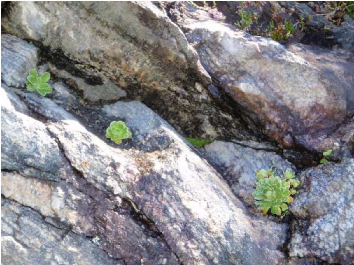
Figur 4.28. Rosettar av bergjunker (NT)(eller krysninga mellom denne og bergfrue) til høgre, til venstre bergfrue.