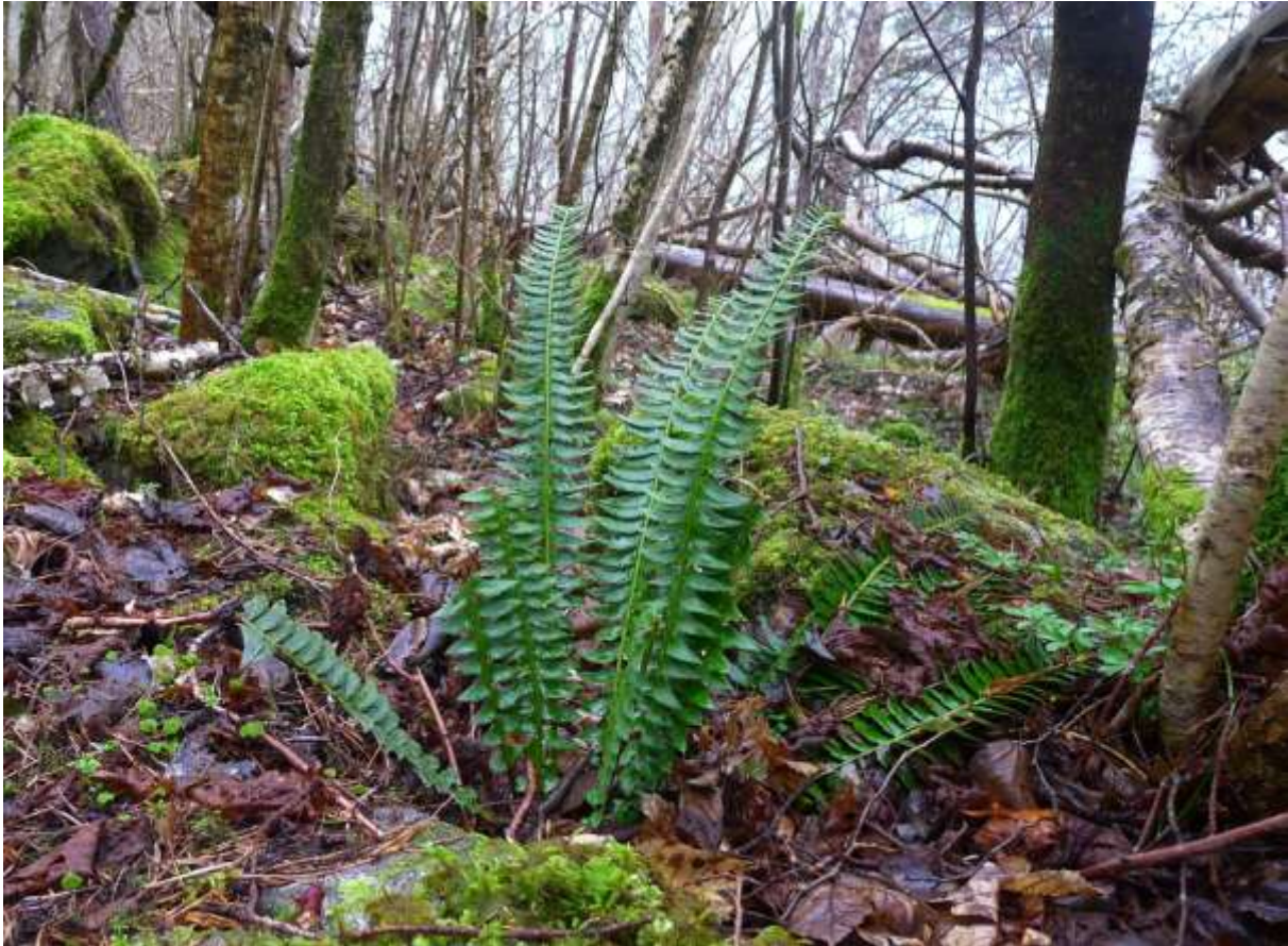
Figur 4.23. Taggbregne er alltid ein god indikator på rikare mark.