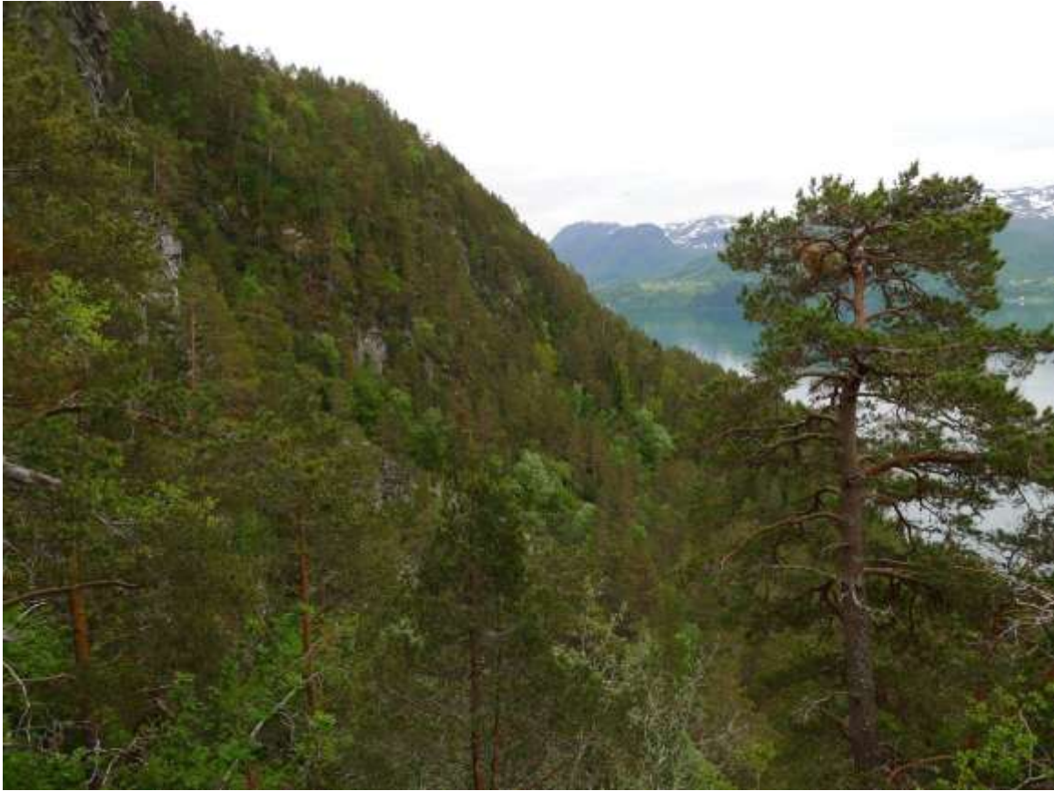
Figur 4.21. Gausneset sett mot sør, med Ramstaddalen i Sykkylven kommune i bakgrunnen.