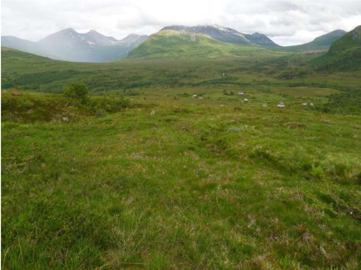
Figur 4.36. Kvanndalsetra (i bakgrunnen) og dei store hei- og myrområde her inne.