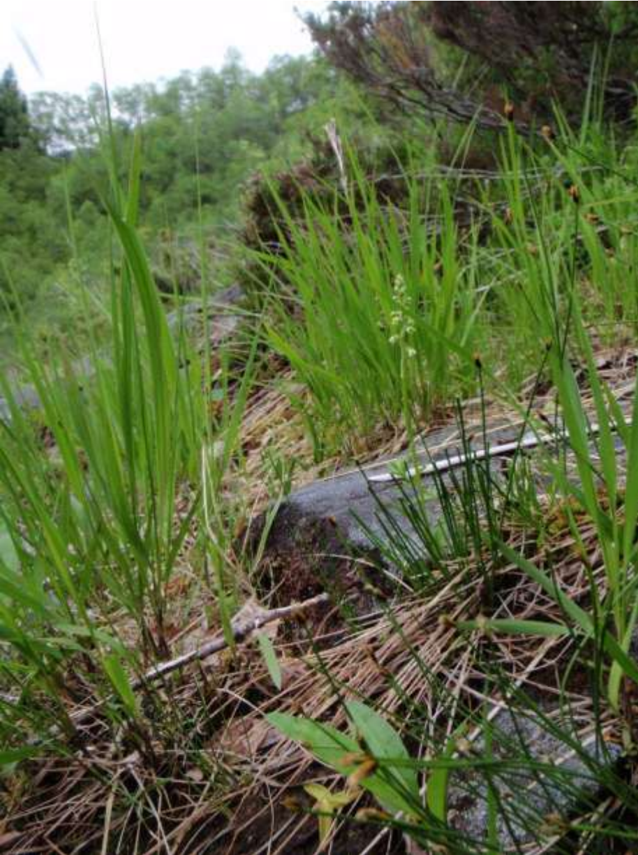
Figur 5.1. Kvitkurle (NT) .