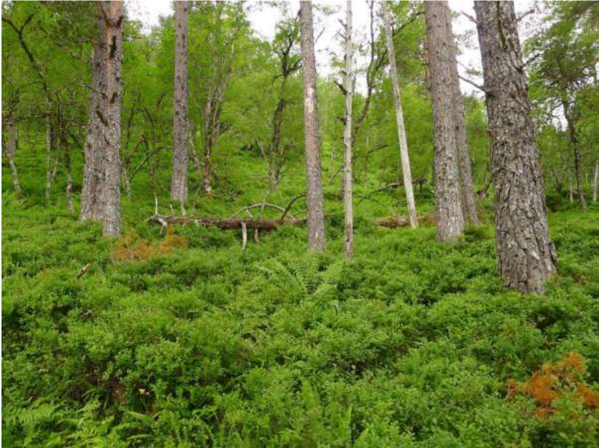
Figur 4.14. Representativt parti frå området ved Haugfjellet, med sterkt oseanisk blåbærskog som har mykje av bregnane bjørnkam og smørtelg som typiske innslag.