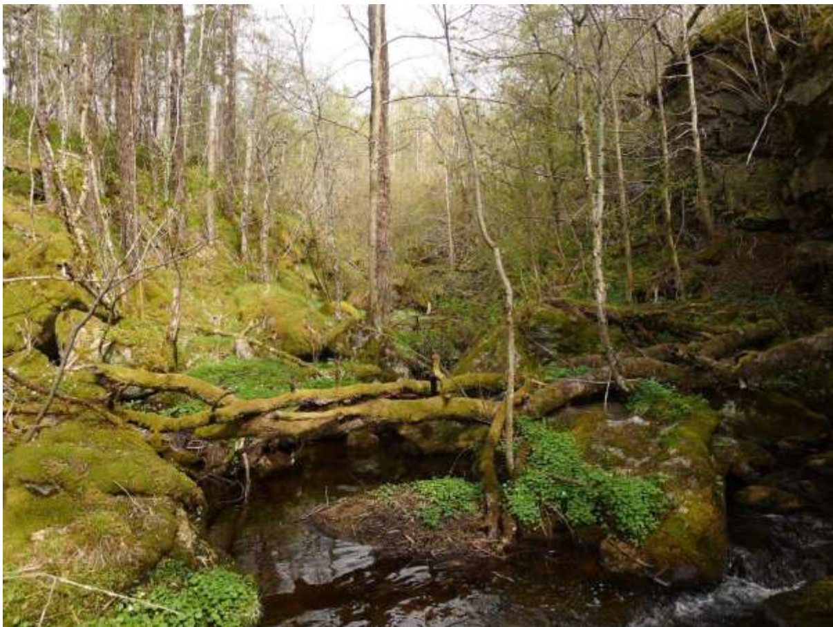
Figur 4.6. Frodig bekkemiljø, med mykje vårkål langs bekkjen, i Ådalen noko sørvest for Amdam.