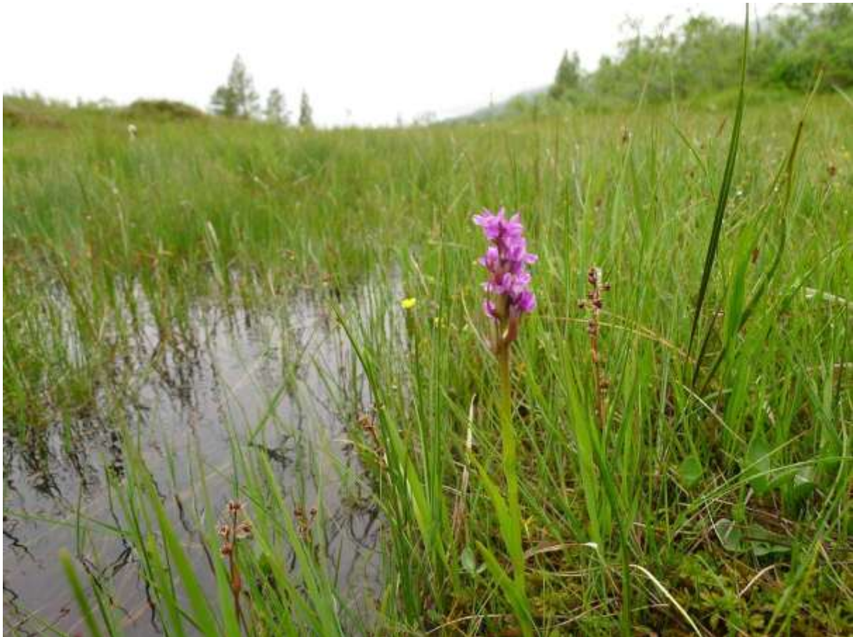
Figur 4.29. Engmarihand (den rosa planten) er ein orkidé som er ein god indikator for rikmyr.

Grunngjeving for verdivurdering: Lokaliteten får verdi A (viktig) fordi den har eit etter måten bra areal med intakt rikmyr, samstundes som den er artsrisk og har ein god bestand av rikmysorkidéen engmarihand. Det vektleggast vidare at dette er mellom dei 3-4 beste utformingane for naturtypen på Sunnmøre, pluss at lokaliteten er ei av dei rikmyrene i fogderiet som samstundes har størst areal.