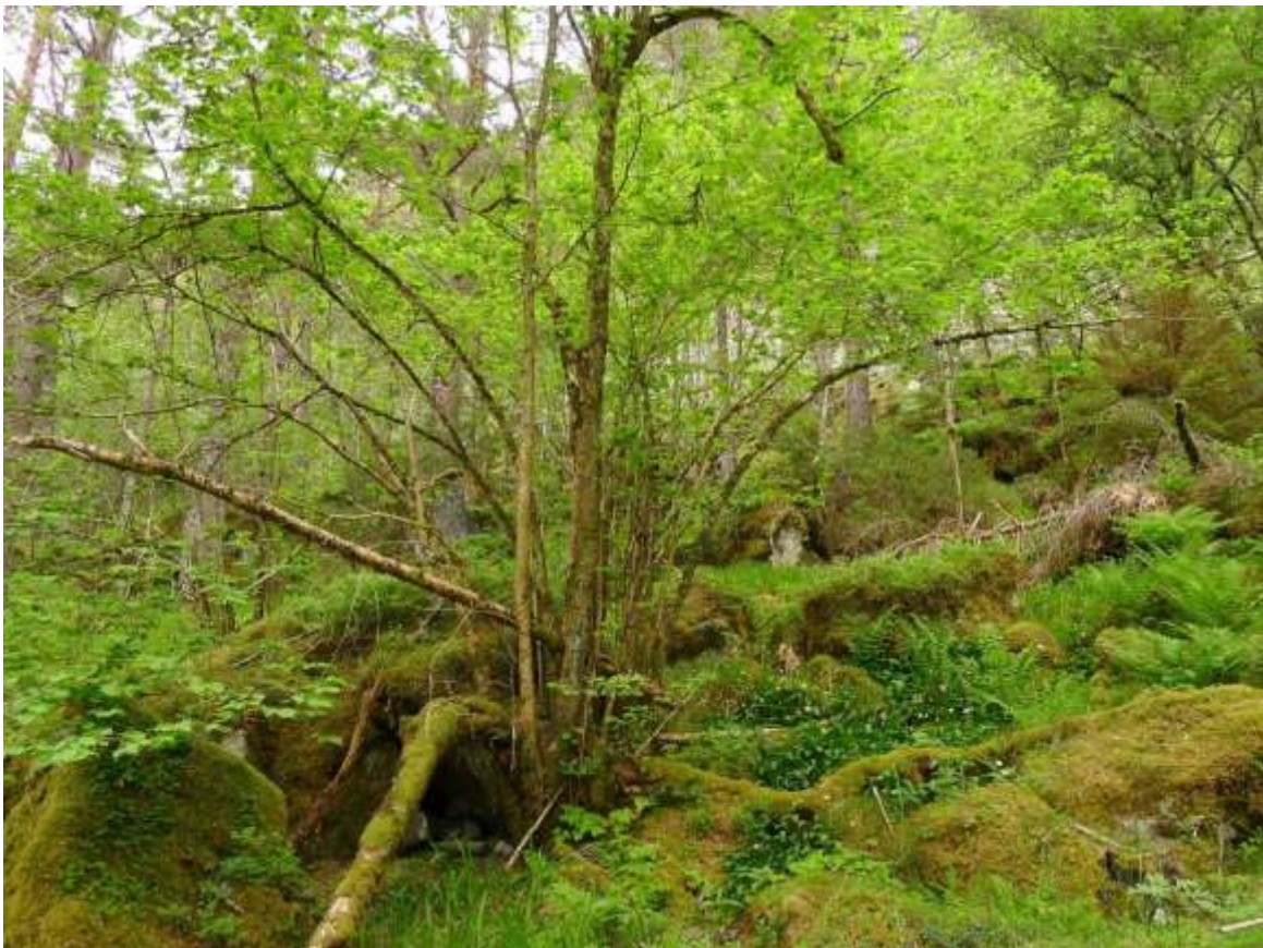
Figur 4.22. Frodige og artsrike hasselkratt på vestsida av Gausneset, i ein fuktig furu-hasselskog.