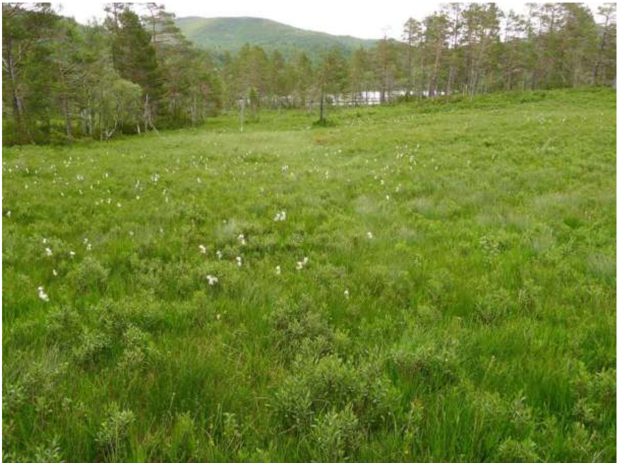
Figur 4.2. Frå rikmyrflekkane på nordvestsida av Akslevollvatnet, her med bjørneskjegg, breiull og pors. I bakgrunnen skimtar ein Lebergsfjellet (628 m o.h.).

Grunngjeving for verdivurdering: Lokaliteten får verdi C (lokalt viktig) fordi den er intakt, med innslag av ein del meir eller mindre kravfulle rikmyrsartar. Samla sett er området etter måten artsfattig, og sidan m.a. viktige orkidear som brudespore, engmarihand og stortviblad ser ut til å mangle, held det ikkje til verdi B (viktig).