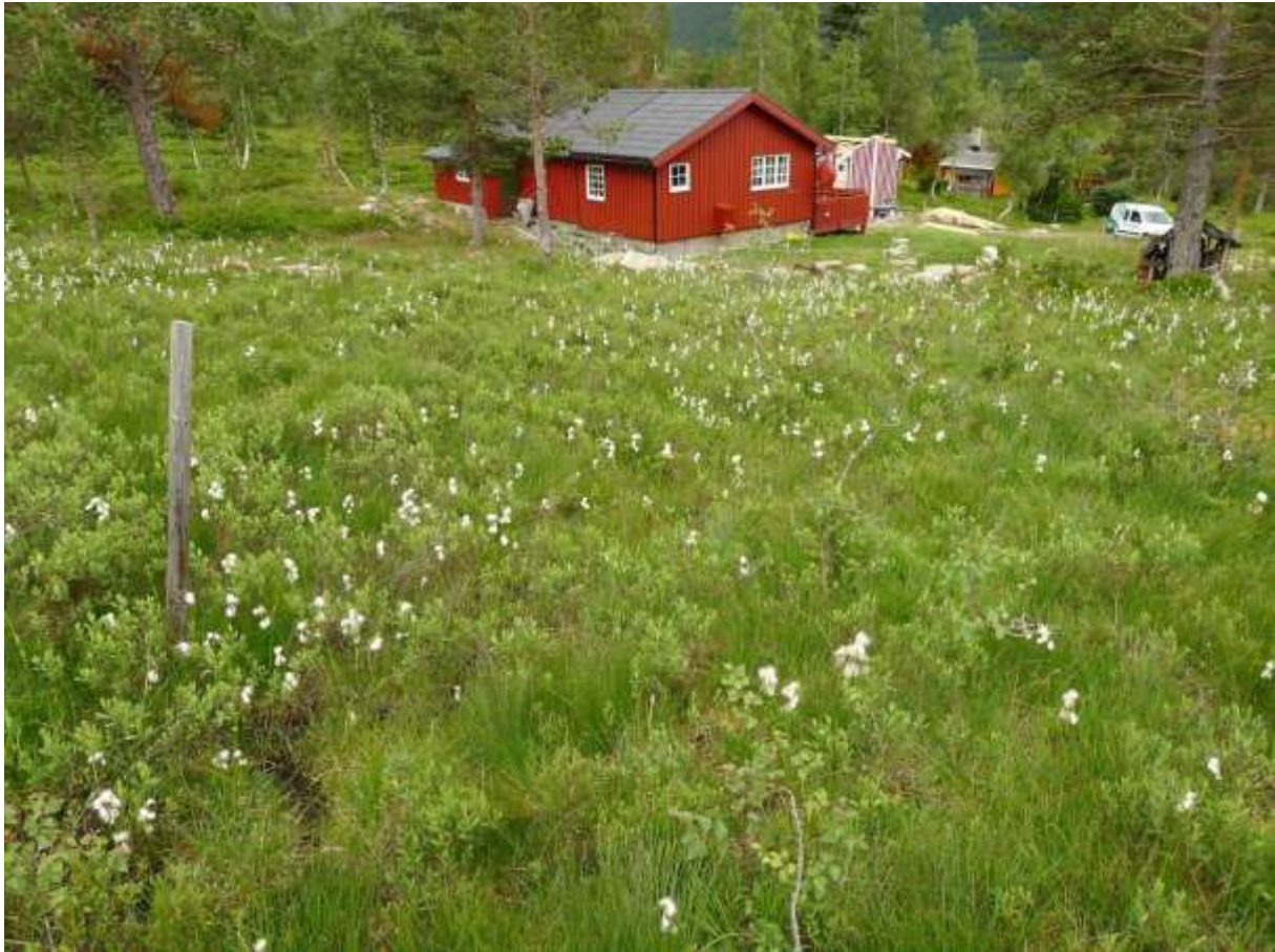
Figur 4.31. Masseførekomst av rikmyrarten breiull ser ein fleire stader i området vest for Sollisetra på Vaksvikfjellet, kor det stadig kjem fleire fritidsbustader. Desse er eit stort trugsmål mot naturmangfaldet i lokaliteten dersom ein får byggje inne på myrflatene.

Grunngjeving for verdivurdering: Lokaliteten får verdi A (viktig) fordi den har eit etter måten bra areal med intakt rikmyr, samstundes som den er artsrik og har ein god bestand av rikmyrsorkidéen engmarihand. Det vektleggast vidare at dette er mellom dei 3-4 beste utformingane for naturtypen på Sunnmøre, pluss at lokaliteten er ei av dei rikmyrene i fogderiet som samstundes har størst areal.