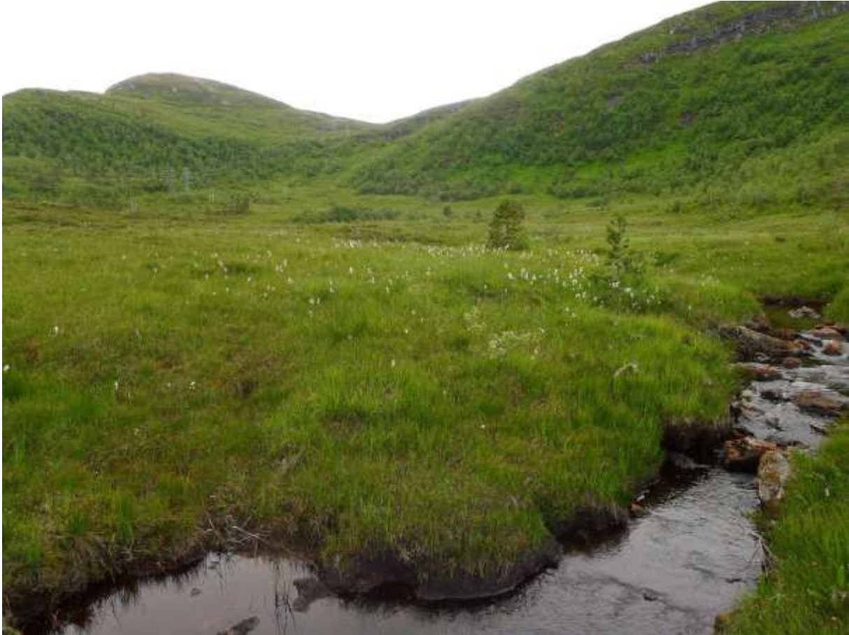
Figur 4.33. Frå myrområda i Visetbotnen. Myggblom og kvitkurle (begge NT) er begge funne ved bekken.