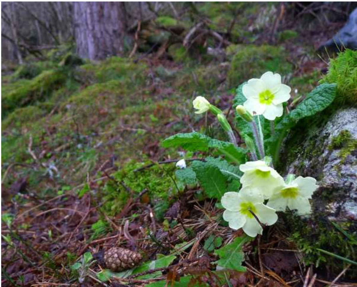
Figur 4.24. Kusymre kan ofte vere talrik i godt utvikla lågurtskog, slik som i Tysseskogane.

Grunngjeving for verdivurdering: Lokaliteten får verdi A (svært viktig) fordi den har ein uvanleg godt utvikla skogstruktur, med mange grove tre og mykje daudved, fordi den er svært variert, med fleire ulike naturtypar og vegetasjonstypar og etter måten artsrik. Potensialet for funn av rauslista sopp er også med og dreg verdien opp.