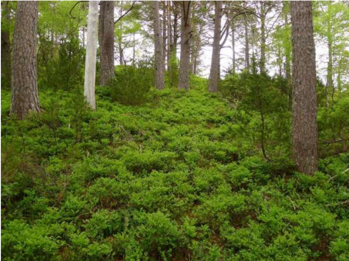
Figur 4.34. Typisk gammal blåbærfuruskog ved Vestreberget.

Grunngjeving for verdivurdering: Lokaliteten får verdi B (viktig) fordi den har eit etter måten bra areal med intakt, virkesrik, kompakt og gammal furuskog.