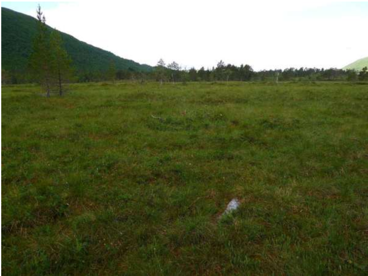
Figur 4.9. Parti frå den austre delen av Løkmyra (Heiane).

Grunngjeving for verdivurdering: Lokaliteten får verdi B (viktig) fordi den har eit etter måten bra areal med intakt kystmyr, og er svært representativ for naturtypen. Kystnedbørsmyr er dessutan raudlista (VU).