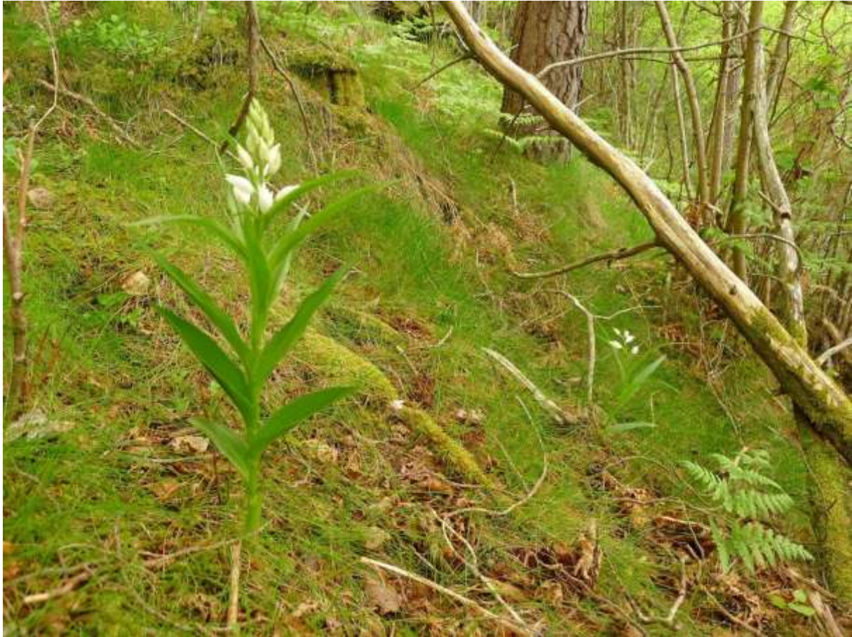
Figur 4.25. To av om lag 80 stenglar med kvit skogfrue som vart registrert vest for Viset i 2012.