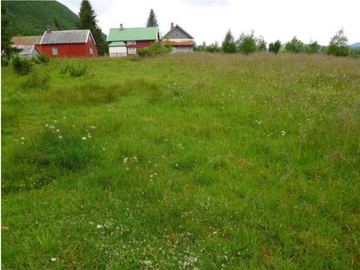
Figur 4.18. Parti frå Svartløksetra, med mykje kystmaure, ryllik og sølvbunke.