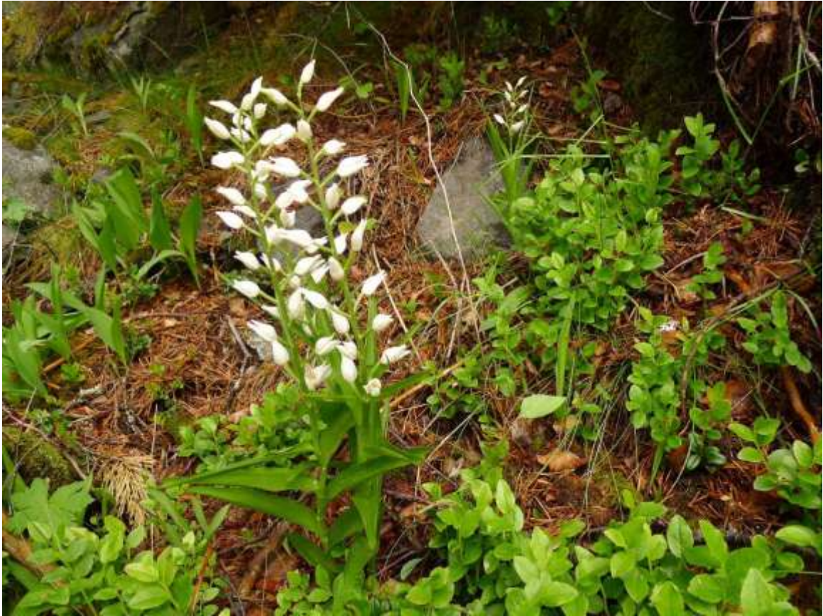
Figur 4.26. Kvit skogfrue aust for Visethalsen i 2012, i svak lågurtmark. Samla sett utgjer bestanden av arten i områda kring Viset ein av dei 3 viktigaste i Møre og Romsdal, med minst 330 registrerte stenglar.