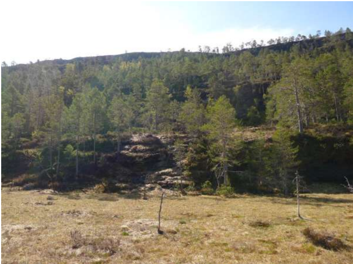
Figur 4.16. Typisk parti på nordsida av Liaffjellet; boreal og uproductiv furuskog med ein del myrflater.