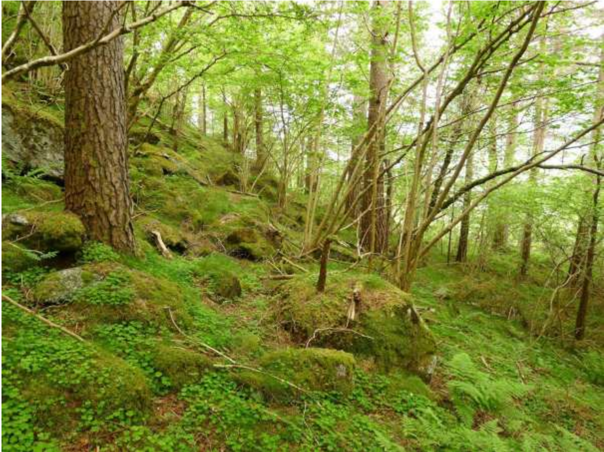
Figur 4.5. Frisk og berglendt furu-hasselskog på oversida av vegen ved Amdam.