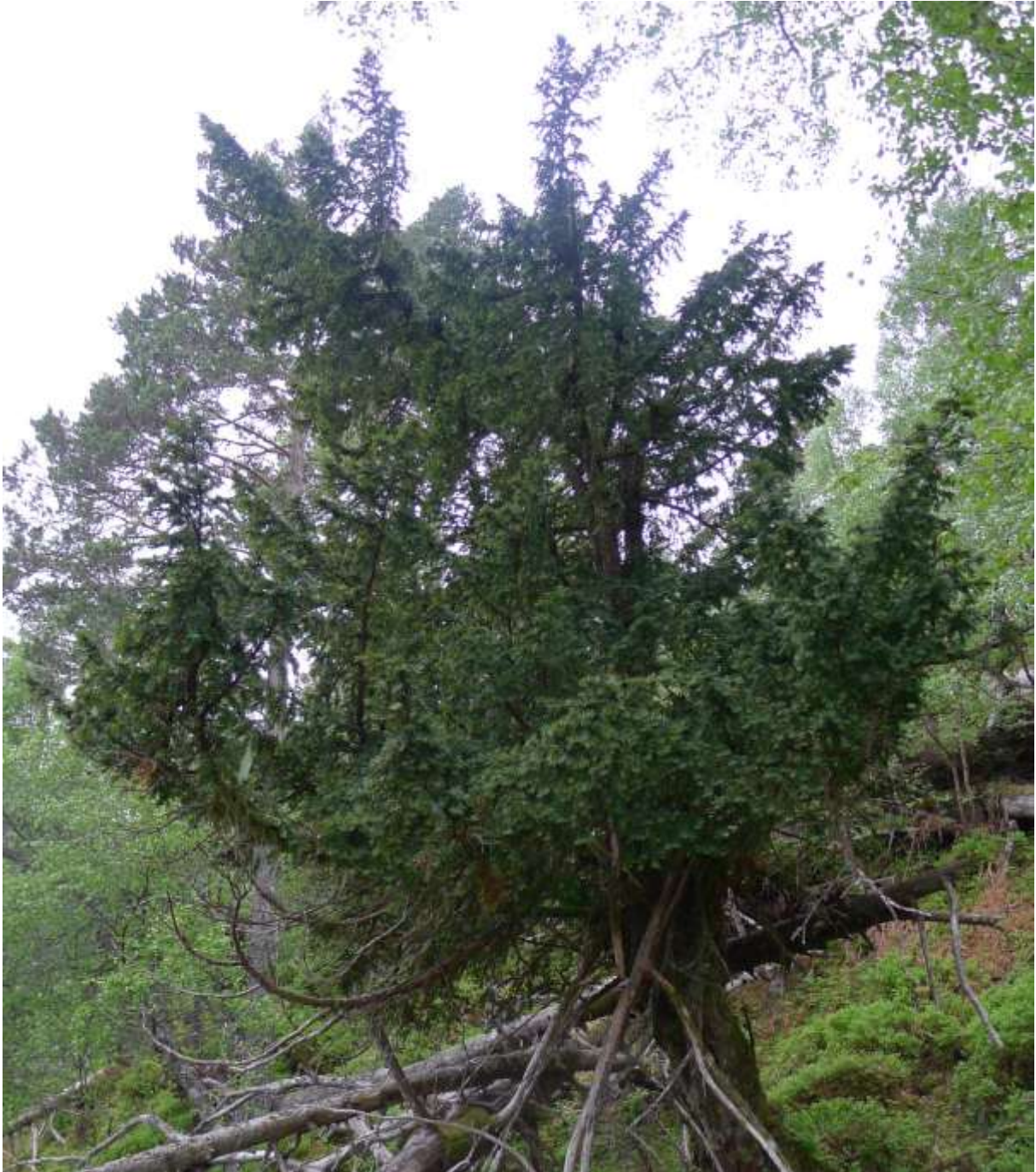
Figur 4.20. Gammal barlind (VU) i Sætrelia.