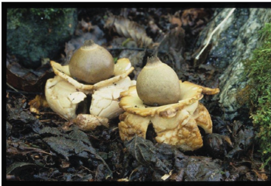
Figur 6. Prestejordstjerne (VU) er ein vakker, sjeldan art, og berre ein av mange raudlista soppar som er funnen på austsida av Steigjelet.

Grunngjeving for verdivurdering: Lokaliteten får verdi A (svært viktig) fordi den velutvikla, intakt og artsrikt, med stor variasjon og mange raudlisteartar.