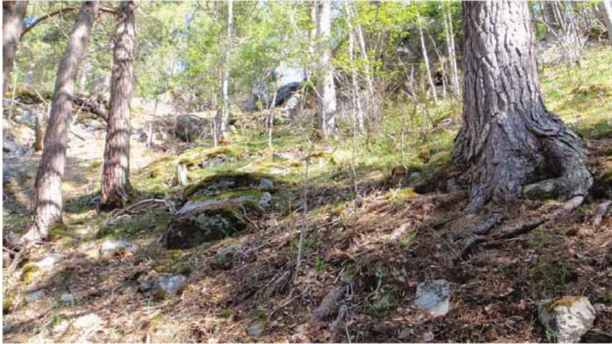
Figur 19. Solsida av Skjegghammaren, med tørr, gammal kalkfuruskog av lågurtypen.