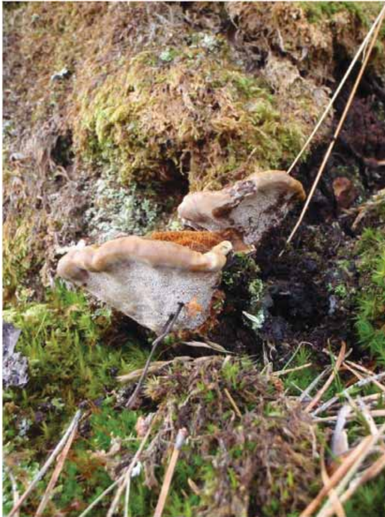
Figur 17. Furufiltkjuke (CR) er utan samanlikning den mest eksklusive av dei raudlista soppene som er funne i furuskogane i Storfjorden til no. Med 12-14 funn, berre to funn andre stader i Noreg (Ringerike) og t.d. kring 5 funn i Sverige, må ein nesten gjere framlegg om å kalle dette for ein verdsarvsopp. Samstundes har området ved Nerhus, kor bildet er teke, mange andre raudlisteartar i høgare kategori, og er det beste området i Storfjorden for sjeldne, vedbuande artar.