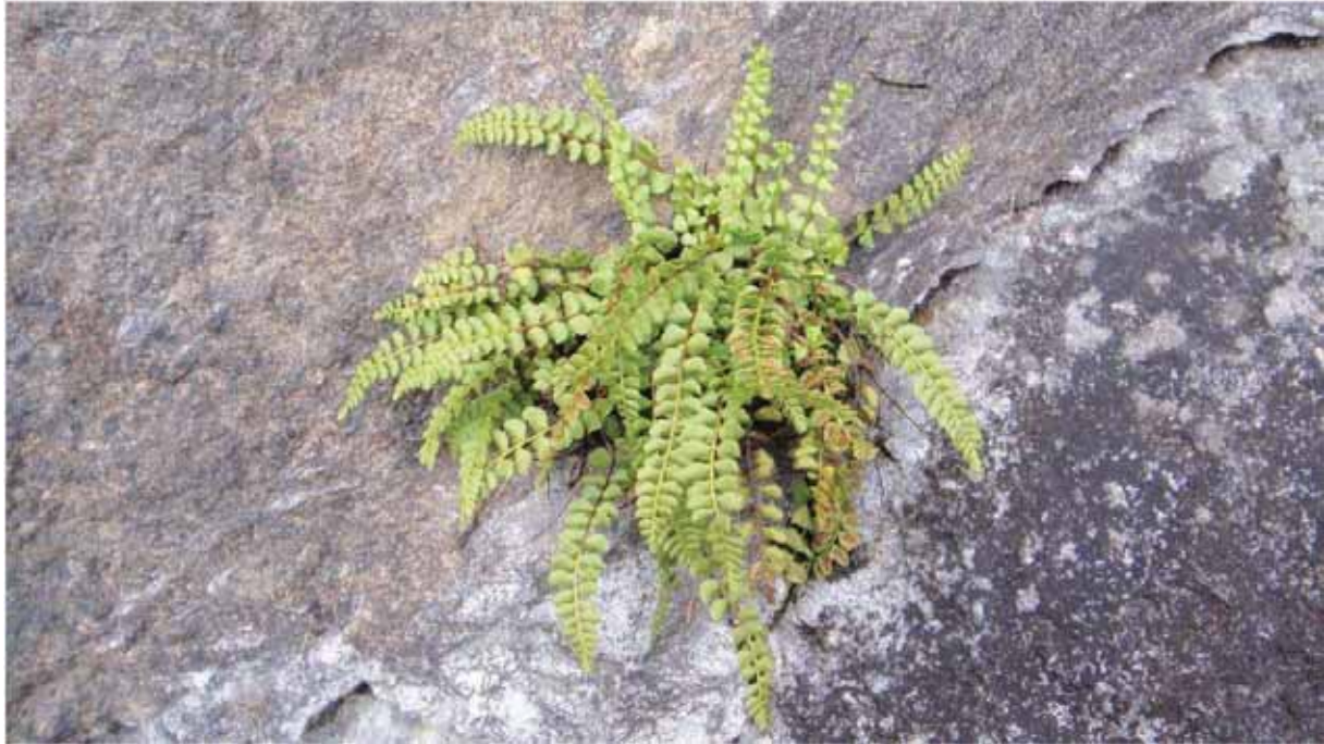
Figur 4. Brunburkne (EN) er den einaste kjende arten som berre veks på olivin. Forsvinn olivinen (t.d. dagbrot) forsvinn også planta.