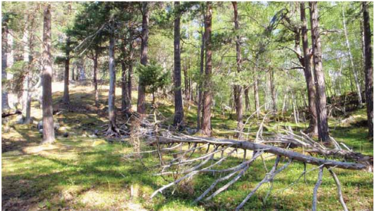
Figur 18. Typisk interiør frå plataet oppe på Skjegghammaren, med mykje gammal furuskog.

Grunngjeving for verdivurdering: Lokaliteten får verdi A (svært viktig) fordi den er stor, intakt og artsrik, med ein høg del gammal skog, stor variasjon og med eit stort og reelt potensial for funn av raudlisteartar i høgare kategori.