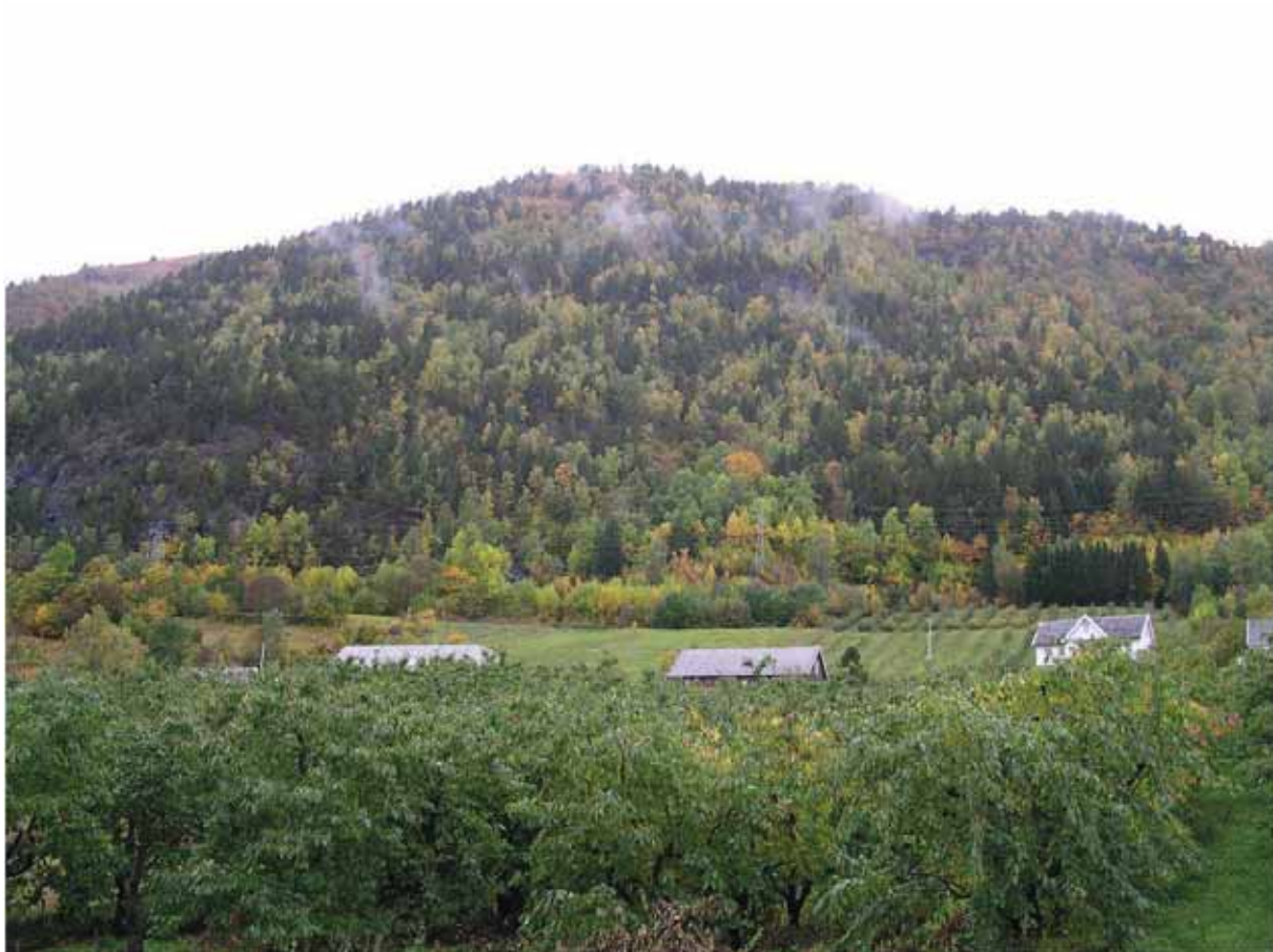
Figur 9. Lindhamrane (til venstre) og skogen her har svært mange høgt raudlista artar.