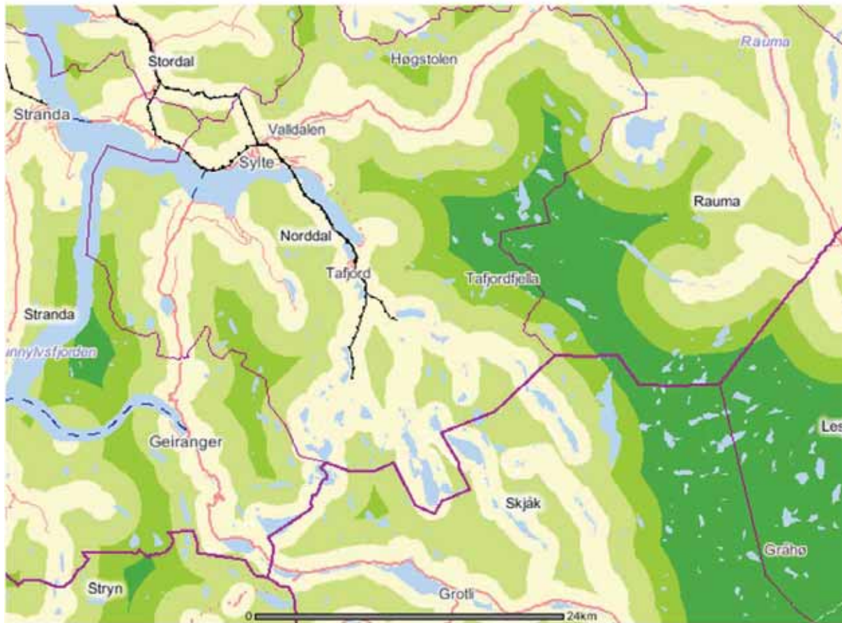
Figur 2. Inngrepsfrie område (INON) i Norddal pr. 2008 ( http://dnweb12.dirnat.no/inon ). Dei lysegrøne felta er 1-3 km frå tekniske inngrep som vegar og kraftliner osv. "Ekte villmark" kjem i kategorien > 5 km frå tyngre inngrep, og dette har ein berre delar av Tafjordfjella.

Om utviklinga held fram på same måte, med vidare nedbygging særleg i låglandet, vil det truleg oftare kunne dukke opp konflikhtar i høve til å få byggje i ein del av dei verdifulle naturtypelokalitetane i kommunen. Dette må ein unngå, både av omsyn til naturmangfaldet, til friluftsliv og turisme, og ikkje minst i høve til mål og føringar frå sentrale myndigheiter, som seier at tap av naturmangfald skal stansast innan 2020. Norddal kommune må snarast utarbeide ein strategiplan i tilhøve til 2020-målet, helst allereie i 2011 (jf. tabell 1 og kapittel 1.5.7). Nytt frå 2009 er også naturmangfaldlova, kor det utarbeidast forskrifter for utvalte naturtypar.