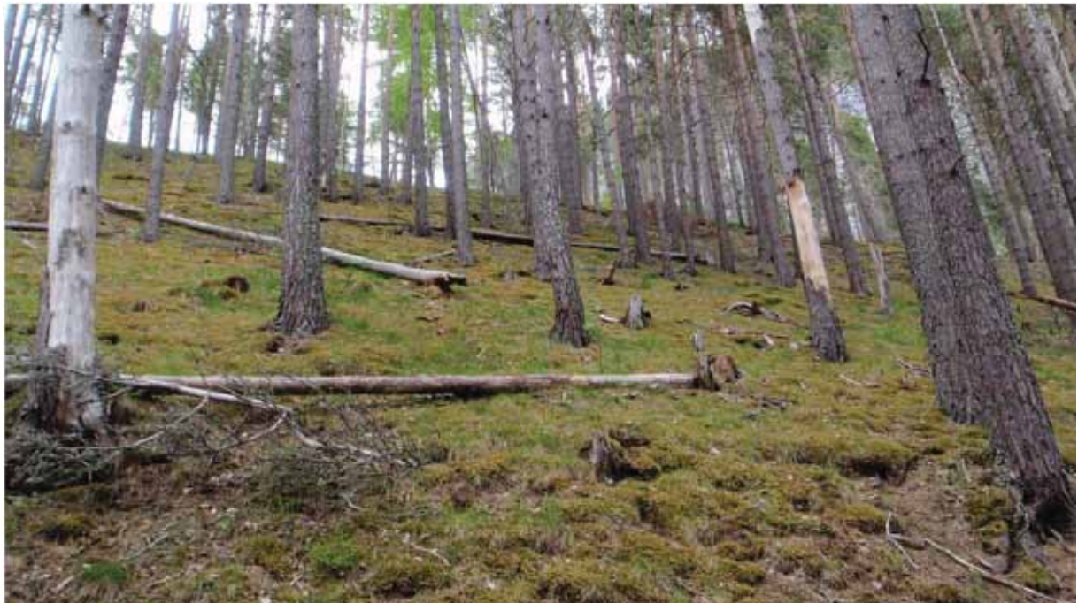
Figur 11. Syltemoen, her med furuskog på gamle morenar.

Grunngjeving for verdivurdering: Lokaliteten får verdi C (lokalt viktig) fordi den er nokså liten har vore utsett for sterk påverknad, og eigentleg er ganske artsfattig samanlikna med furuskogane elles i fjorden. Mest interessant innanfor naturmangfaldet er funn av vivendel, som her har ein utpostlokalitet.