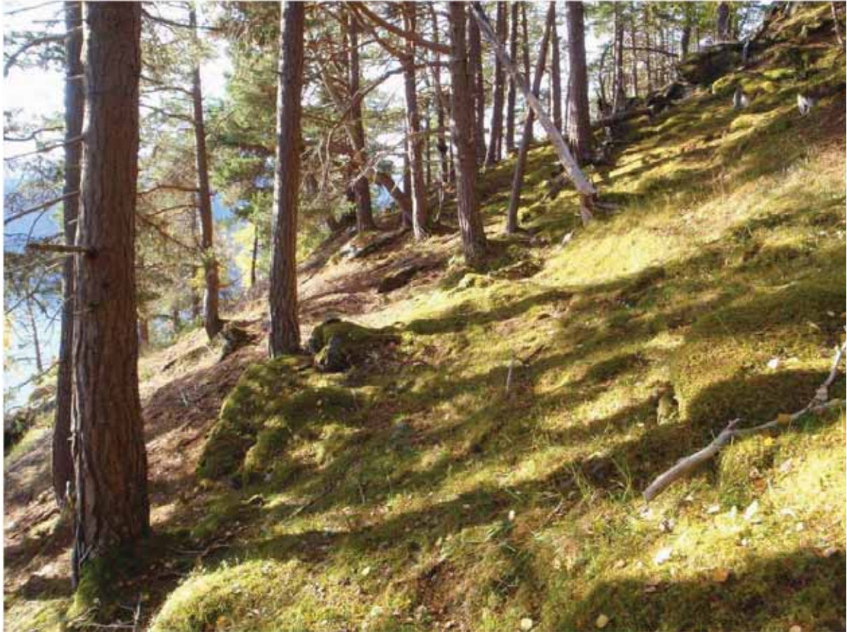
Figur 7. Gammal furuskog i liene vest for Linge. Den kan sjå svært artsfattig ut, men det er ikkje tilfelle.

Grunngjeving for verdivurdering: Lokaliteten får verdi A (svært viktig) fordi den er stor, artsrik og i hovudsak intakt, med uvanleg mange raudlisteartar i dei høgaste kategoriane.