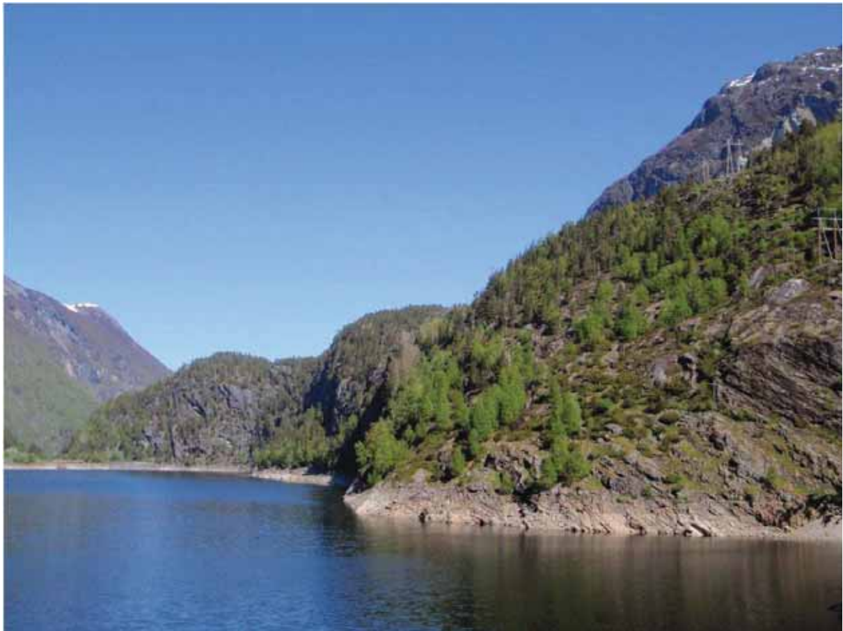
Figur 21. Nordsida av Onilsavatnet, med Høgnausen. Her er det mykje fin kalkfuruskog, særleg i den vestre og nedre delen, lengst bak på bildet.

Grunngjeving for verdivurdering: Lokaliteten får verdi A (svært viktig) fordi den er intakt, variert og artsrik, med raudlisteartar i høgare kategori innanfor fleire artsgrupper.