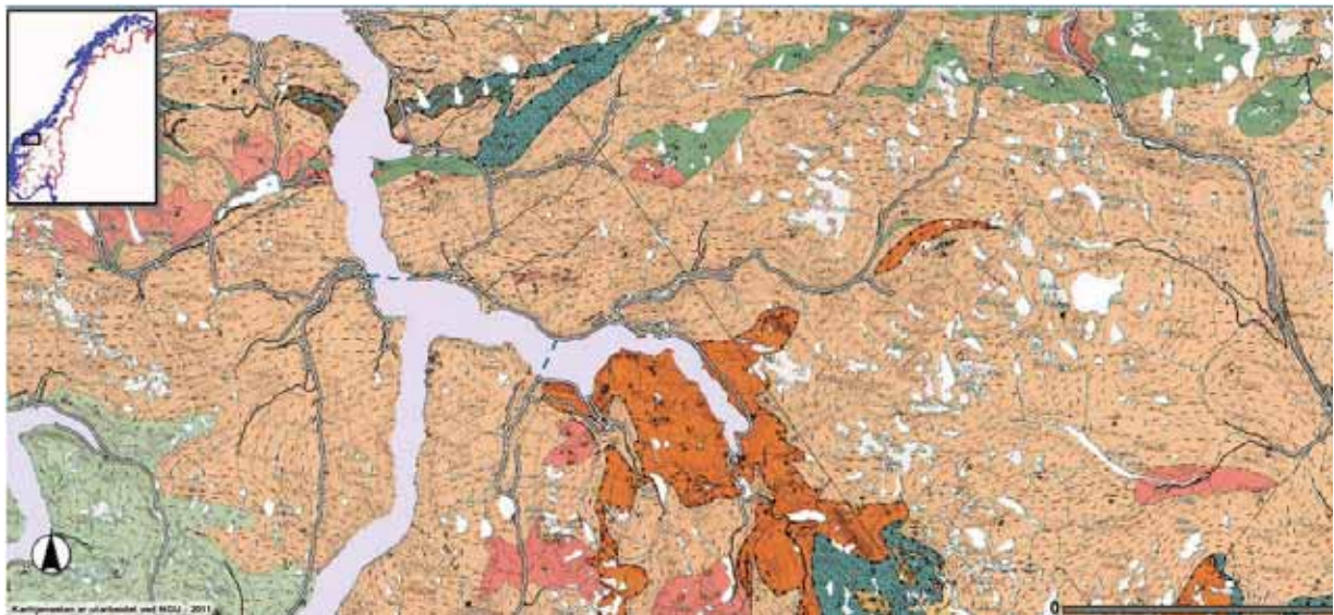
Figur 1. Berggrunnskart over Norddal ( http://www.ngu.no ).

Når det gjeld lausmasser er det mange stader morenemateriale, medan det særleg i fjord- og dalsider er mykje skredmateriale.