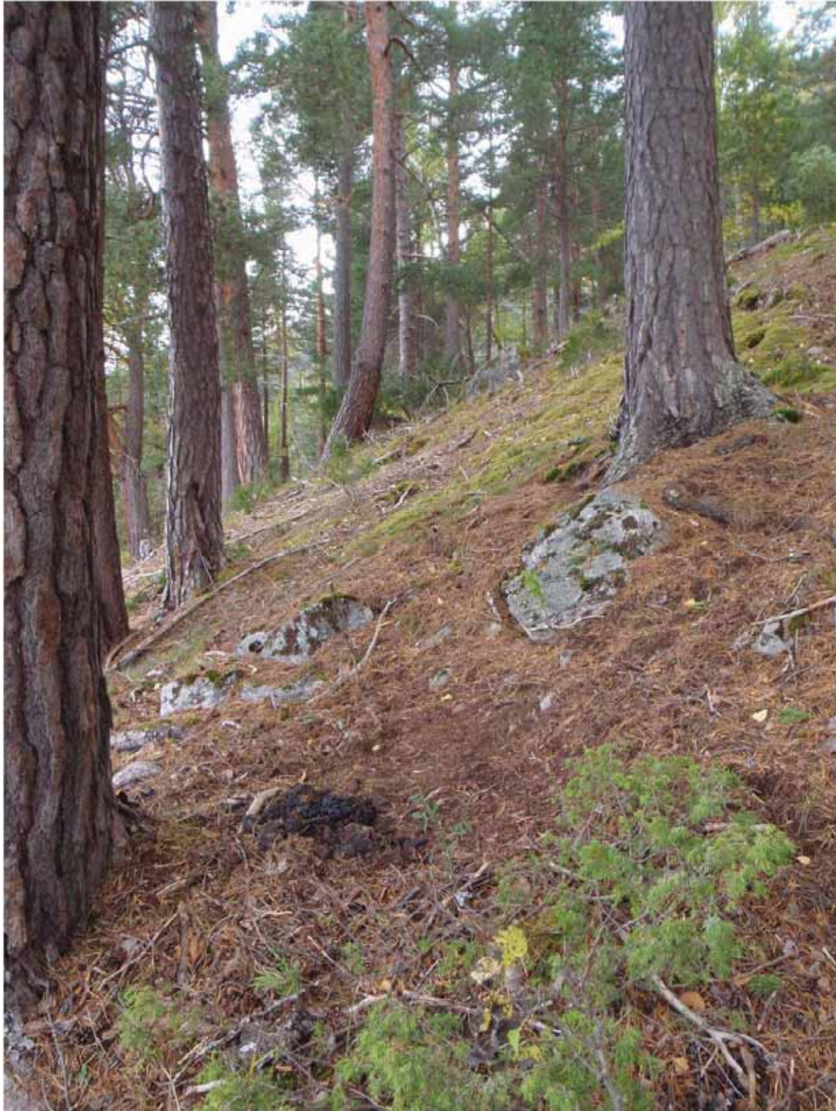
Figur 3. Typisk gammel og tørr kalkfuruskog i Storfjorden, her frå Blikshammaren på vestsida av Steigjelet. Det kan ikkje sterkt nok understrekast kor unike og viktige desse skogane er i ein internasjonal samanheng, sjølv om dei ved eit første blick nok kan sjå svært karrige ut.