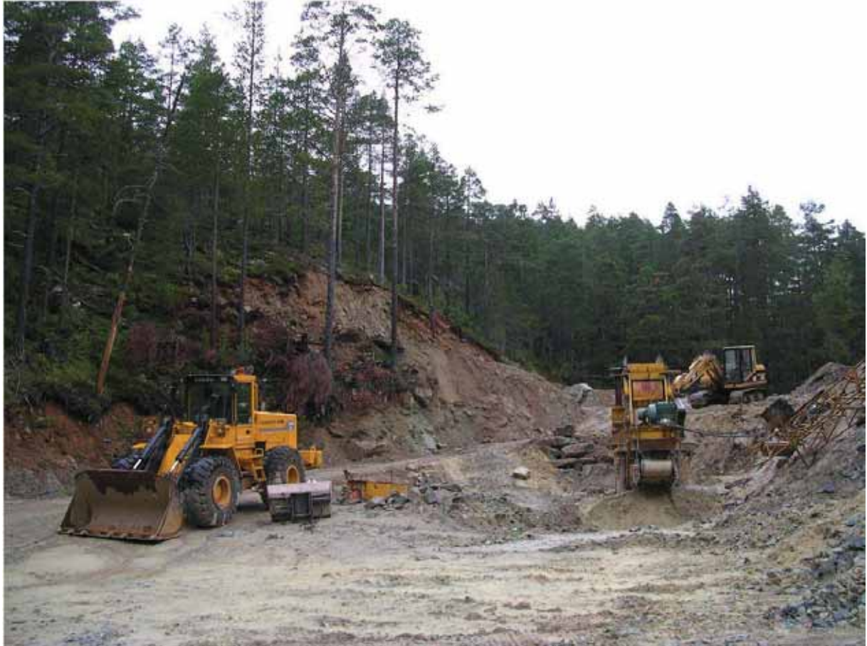
Figur 22. Slike inngrep er eit stort trugsmål mot olivinskogane nasjonalt.