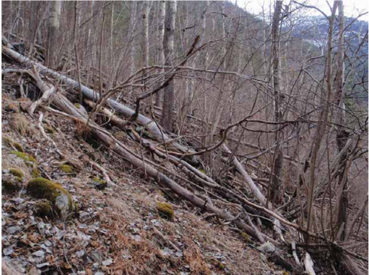
Figur 5. Lauvvikane, her lauvskogsdelen i tidleg vårdrakt, med mykje hassel og osp og mengder av liggande, daud ved.

Grunngjeving for verdivurdering: Lokaliteten får verdi A (svært viktig) fordi den er stor, intakt og artsrik, med raudlisteartar av både planter, sopp og insekt, også i høgare kategori.