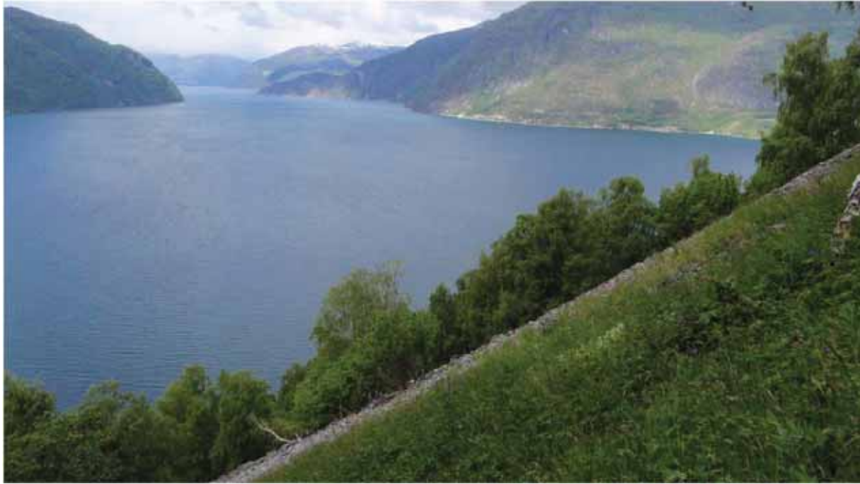
Figur 24. Utsikt frå den artsrike rasmarka/bjørkehagen i Norddal. I bakgrunnen Norrdalsfjorden, med Linge til høgre.