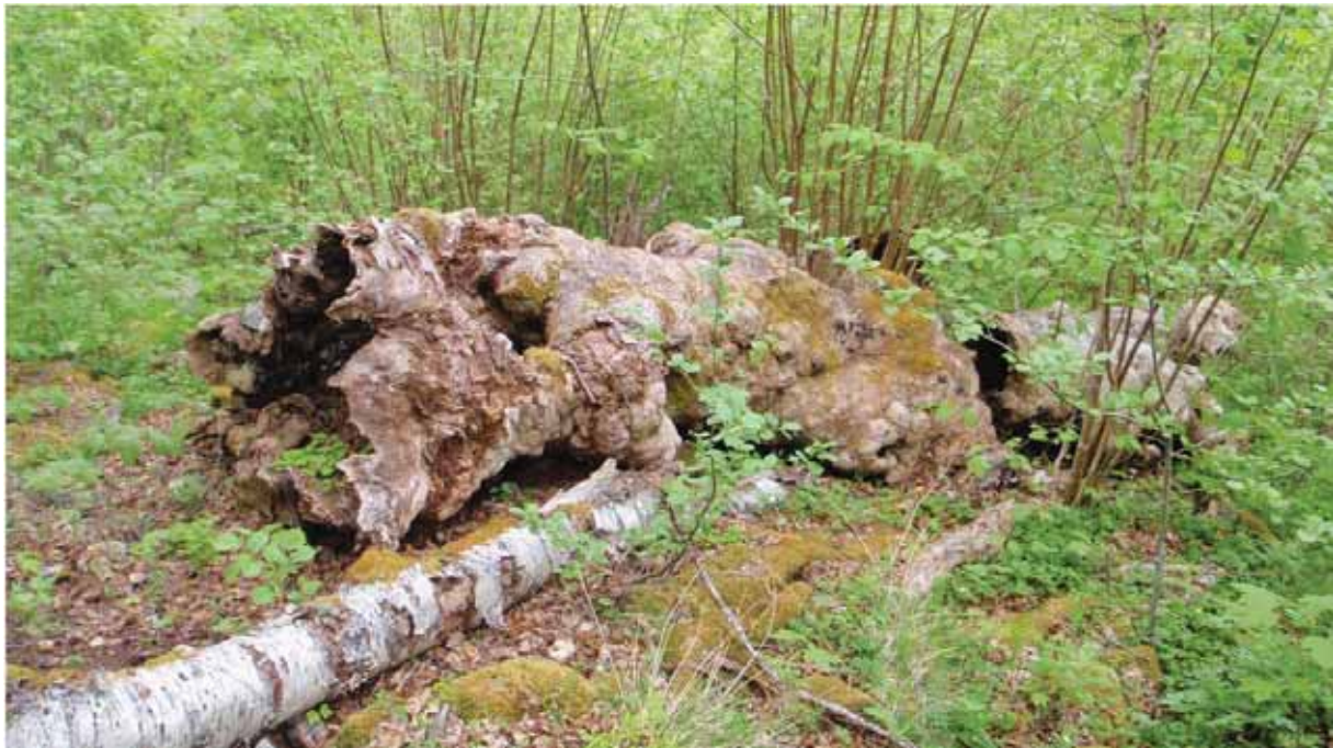
Figur 25. Almelågen ved Berdal, som no skuggast ut av krattskog etter tidlegare vedhogst.

Grunngjeving for verdivurdering: Lokaliteten får verdi C (lokalt viktig) fordi den er nokså liten, sterkt negativt kulturpåverka, med svært mykje platanlønn og ikkje særleg artsrik.