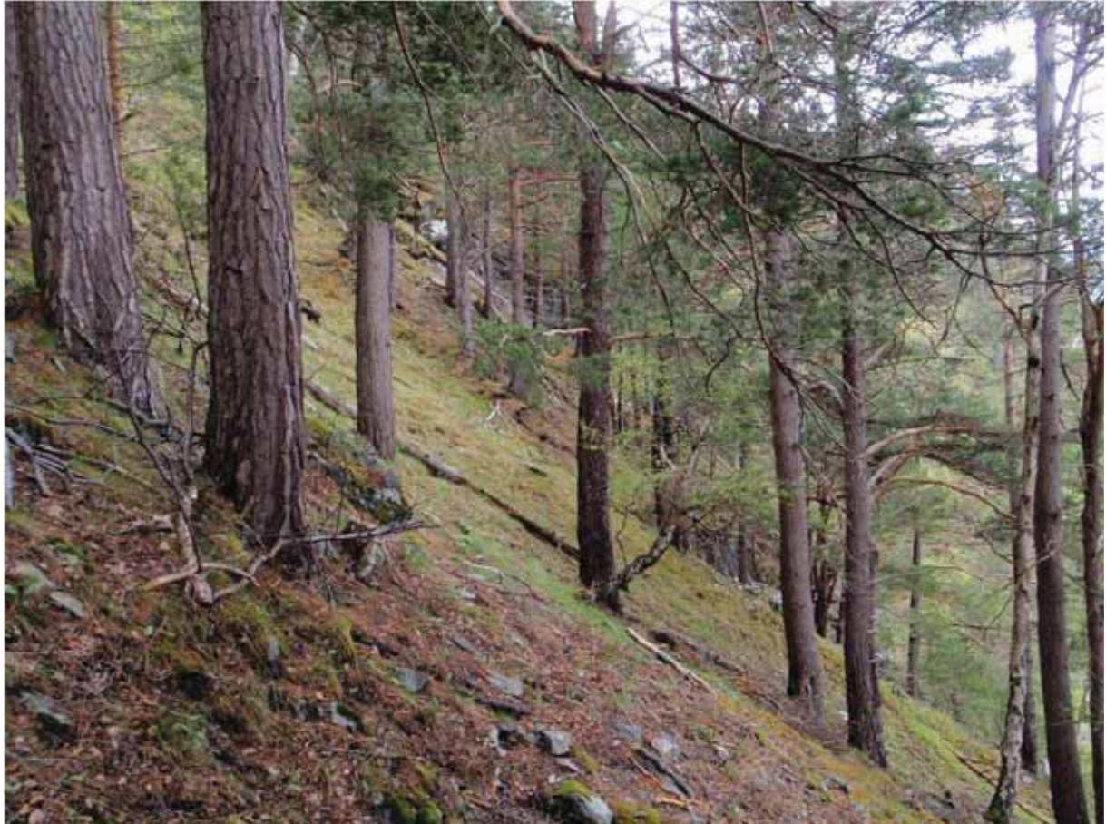
Figur 10. Gammal furuskog frå Syltefjellet.

Grunngjeving for verdivurdering: Lokaliteten får verdi A (svært viktig) fordi den er stor, artsrik og intakt, med ein uvanleg høg del gammalskog, og eit klart potensial for funn av raudlisteartar i høgare kategori.