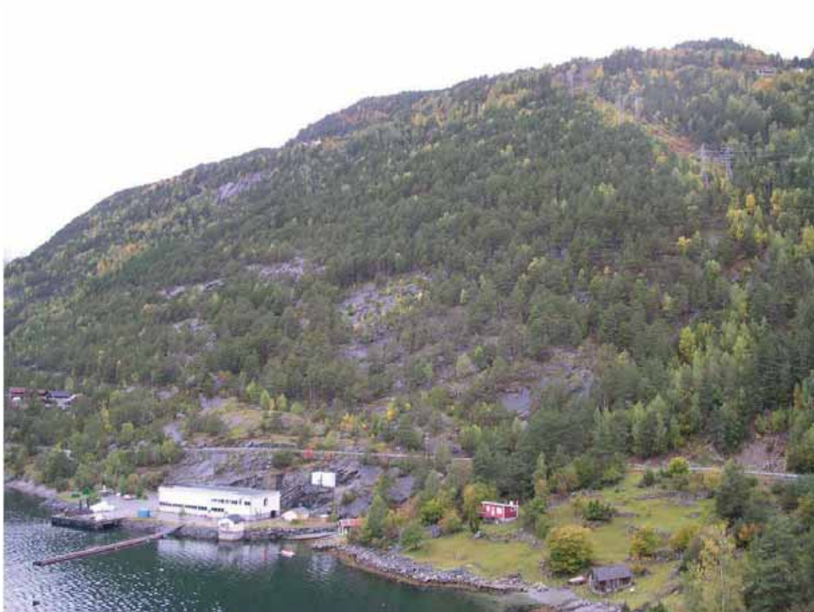
Figur 14. Området mellom Vika og Ytterli kan sjå skrint og magert ut, men faktisk er dette ein av dei viktigaste kalkfuruskogane i Nord-Europa!