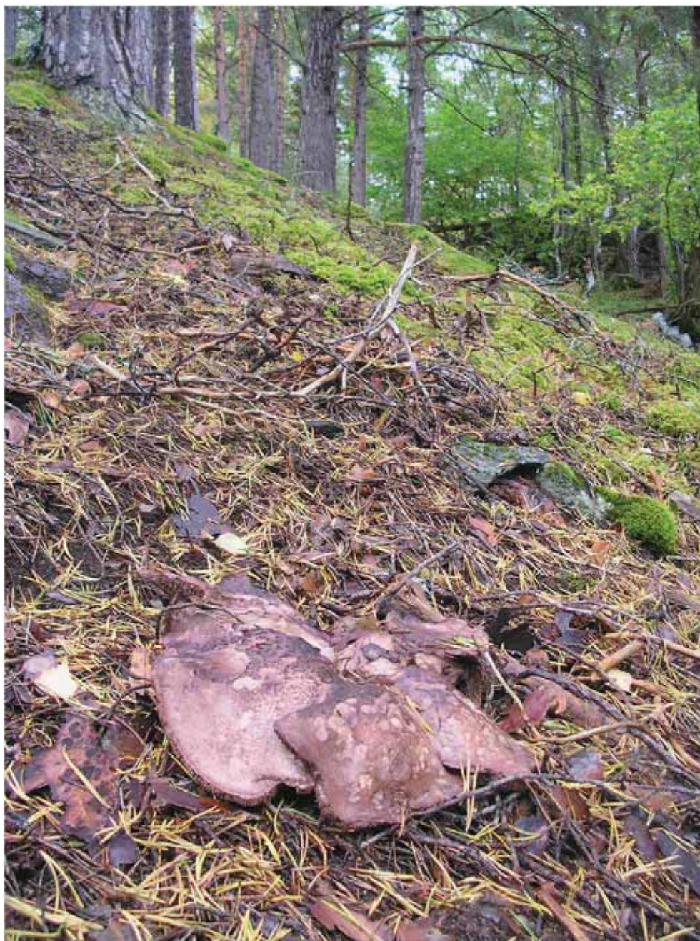
Figur 16. Glattstorpigg (NT) er ein av karakterartane frå dei kalkrike furuskogane i Storffjorden, med ei internasjonalt viktig opphoping. Her frå Vikane ovanfor Fjørå.