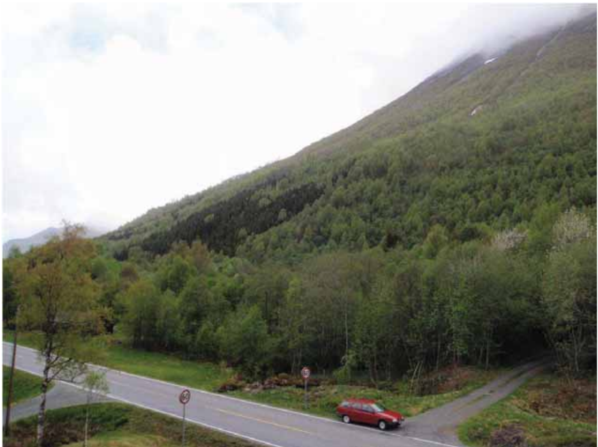
Figur 26. I denne lia har ein altså gjort ein freistnad på å avgrense eit stort skogområde som ikkje kjem i berøring med granplantasjane.

Grunngjeving for verdivurdering: Lokaliteten får verdi A (svært viktig) fordi den, gamle inngrep til trass, er stor og velutvikla, i hovudsak intakt, med svært varierte og dels gamle skogsmiljø som i alle fall har potensial for funn av ein del raudlista soppar.