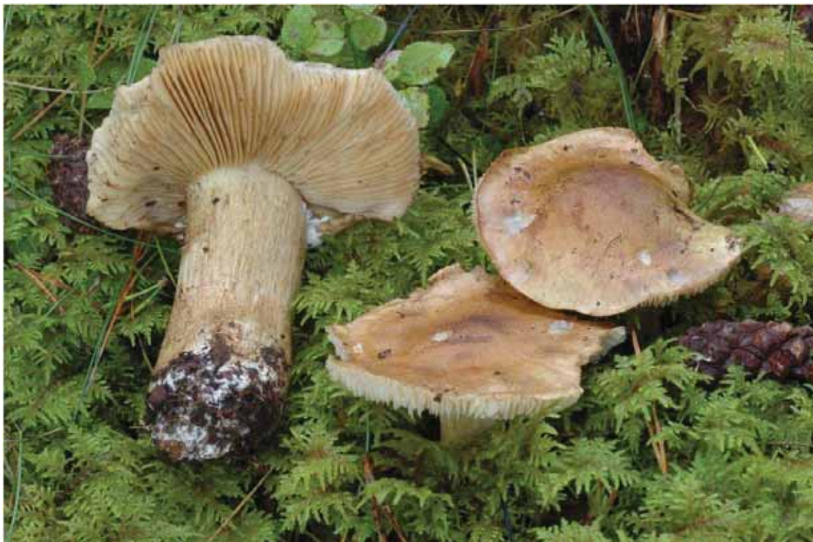
Figur 15. Sienamusserong (EN) er ein sjeldan kalkskogsart både her heime og i Nord-Europa. Den sterke konsentrasjonen mellom Vika og Ytterli er den viktigaste som er kjend, og enda har ein ikkje undersøkt godt nok den vestre tredjedelen av området.