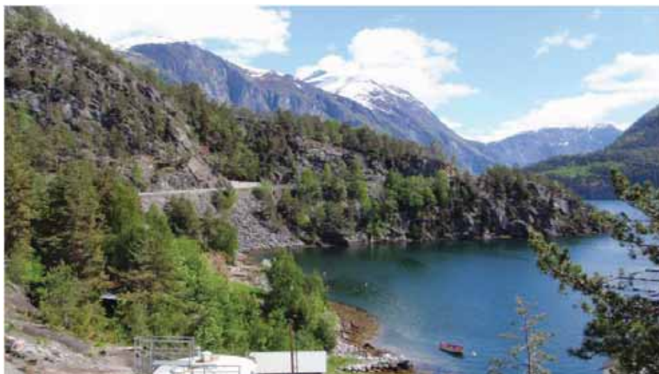
Figur 13. Frå skogen vest for Fjørå.

Grunngjeving for verdivurdering: Lokaliteten får førebels verdi C (lokalt viktig), fordi den er nokså liten, lite variert og etter måten artsfattig.