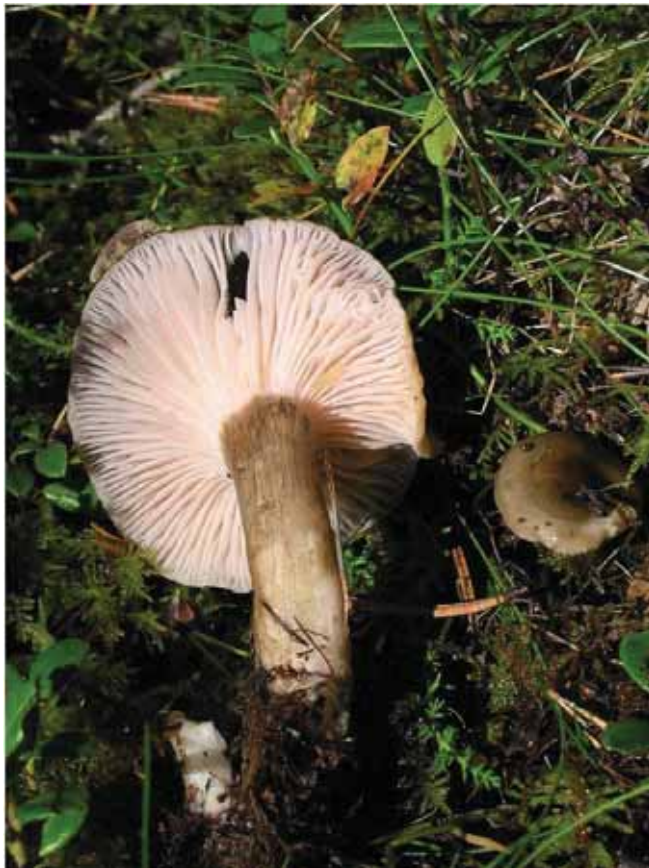
Figur 23. Fagervokssopp (EN) har sin internasjonalt største kjende konsentrasjon ved Onilsafeltet. Det same gjeld nasjonalt også for planta brunburkne (EN). Onilsafeltet er i tillegg den best dokumenterte og viktigaste olivinskogen som er kartlagt, og då må det påpeikast at alle viktige område no er godt undersøkte.