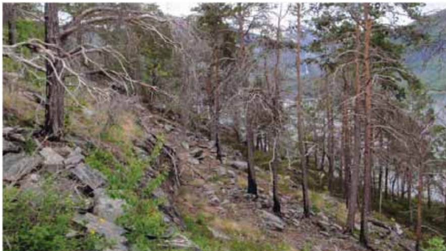
Figur 12. Brannskadd skog ved Honeset.

Grunngjeving for verdivurdering: Lokaliteten får verdi C (lokalt viktig) fordi den er nokså liten, lite variert og etter måten artsfattig.