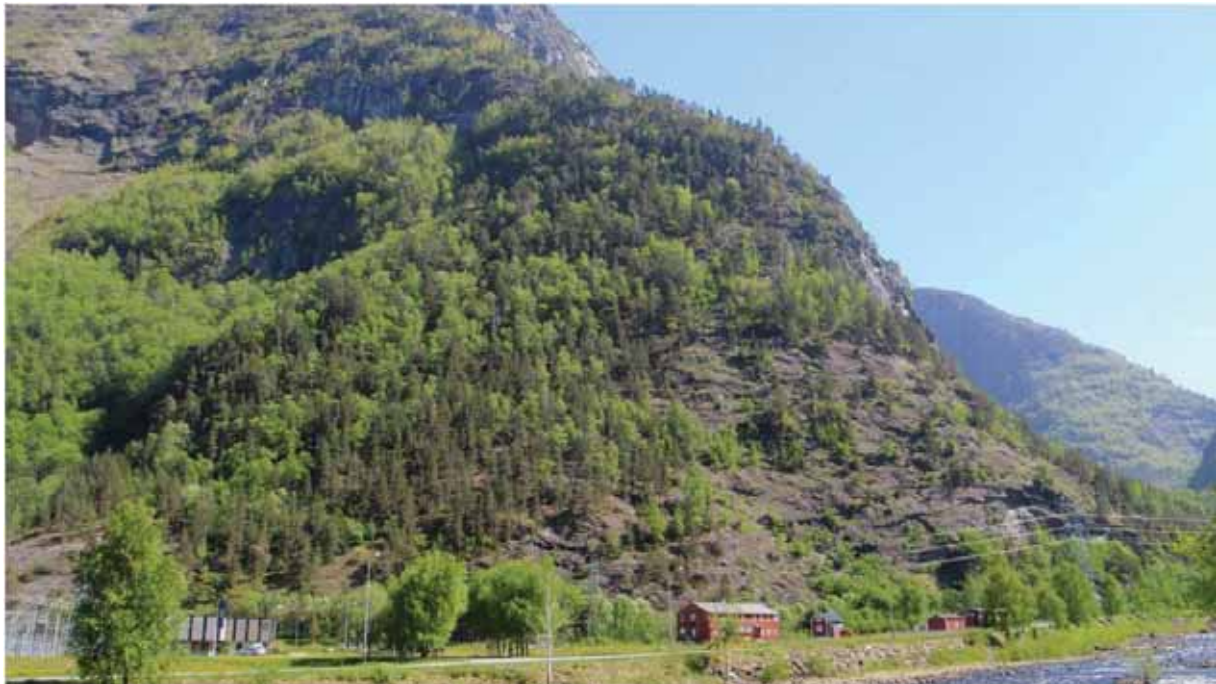
Figur 20. Kamben i Tafjord har kalkrik furuskog og tørrbakkar.

Grunngjeving for verdivurdering: Lokaliteten får verdi B (viktig) fordi den har eit interessant kalkskogsmiljø, men innslag av somme sjeldne eller kravfulle artar. Potensialet for funn av raudlista soppar er lagt litt vekt på ved denne vurderinga.