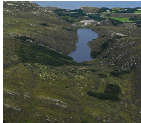
Figur 2: Flyfoto av Sætrredalen naturreservat.

Gran og sitkagran er i ferd med å spreie seg lengst sør i reservatet. Trea vil på sikt dekkje større delar av verneområdet med skog om det ikkje vert sett i verk tiltak for å fjerne dei.