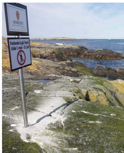
Figur 3: Merking av Grip naturreservat.

Med eit vernevedtak oppstår det behov for å føre kontroll med at verneføresegnene og eventuelle dispensasjonsvedtak vert etterlevd. SNO har ansvaret for oppsyn i verneområda i Noreg.