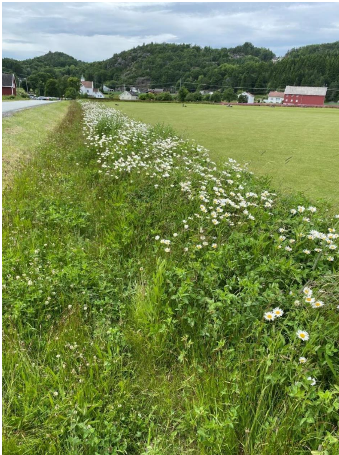
Blomsterstripe på jordbruksareal (Egen stripe, regional frøblanding), Landvik i Grimstad.

Allerede etablerte flerårige soner som inneholder blodkløver kan også gis støtte i 2024, og så lenge sonen blir liggende. Det vil si fram til sonen går ut eller fornyes.