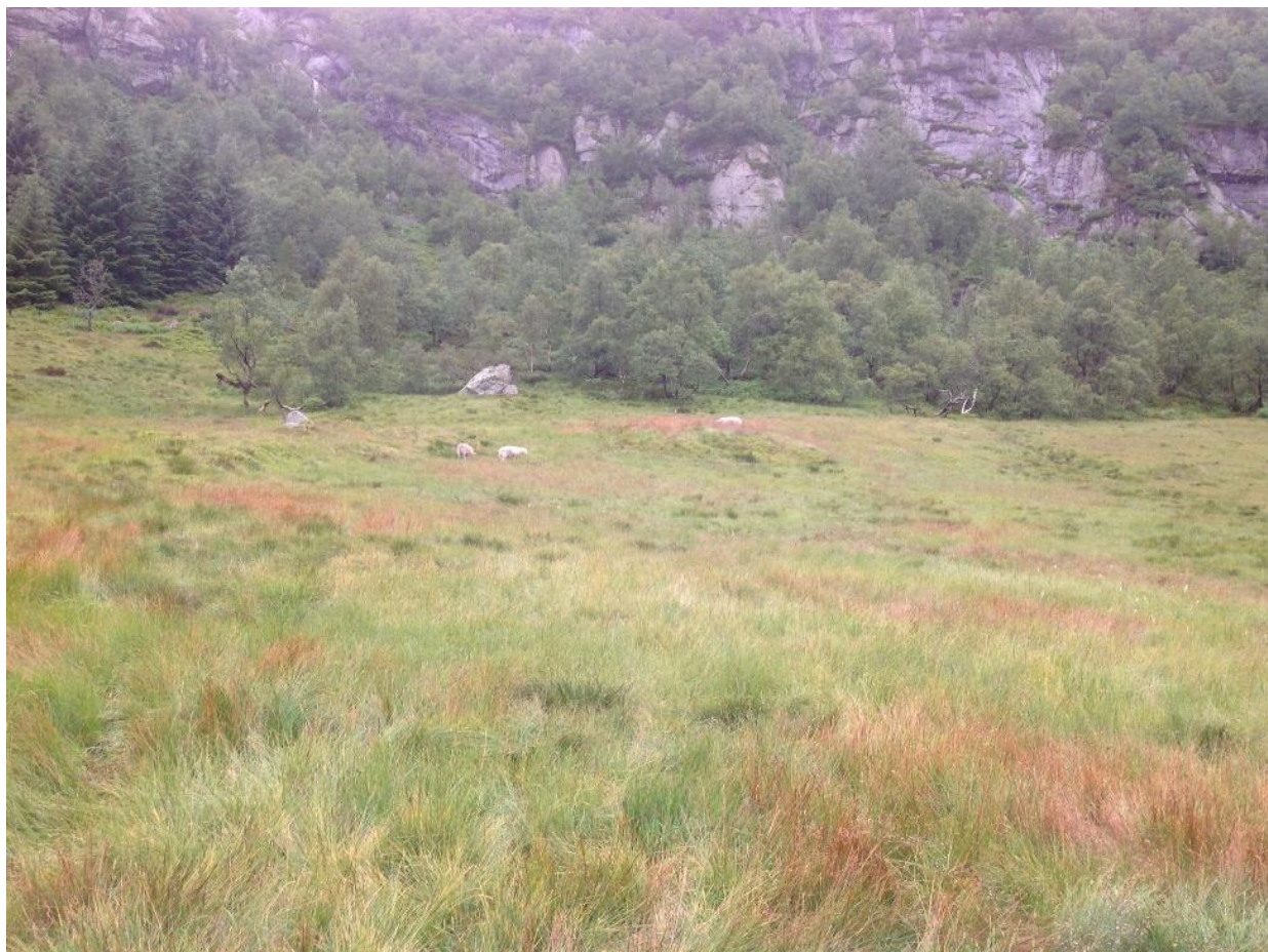
Slåttemark på Bryggesåhommen i Hægebostad.