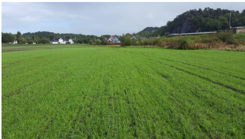
Fangvekster: Raigras og rug sådd etter høsting av tidligpotet, Søgne.