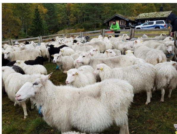
Samling av sauer på heia i Valle.

Tilskuddet utmåles per dyr som er sluppet på beite.