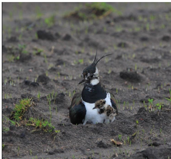
Vipe med nyklekket kylling på Årosjordet i Søgne, Kristiansand.