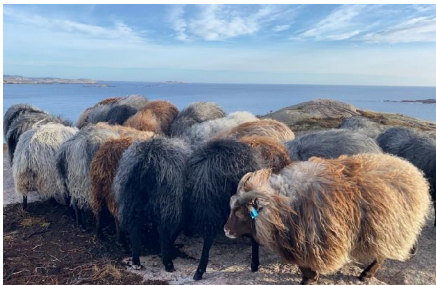
Gammel norsk spælsau på beite, Hillebunga i Lindesnes.

Det kan bare utbetales ett tilskudd til samme beitedyr for en beitesesong der samme område både er prioritert etter § 6 og § 7 for eksempel øya Hille utenfor Mandal. Søker må da velge å enten søke for jordbruksareal i § 6 eller søke for beitedyr på alt areal som beites i § 7.