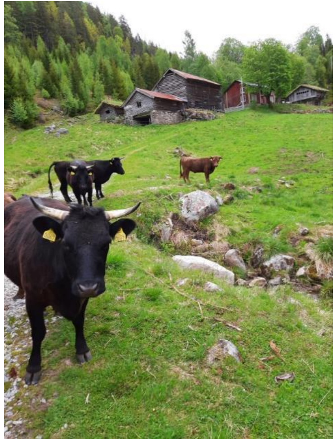
Dexterfe i bratt lende på Skåre i Bygland.