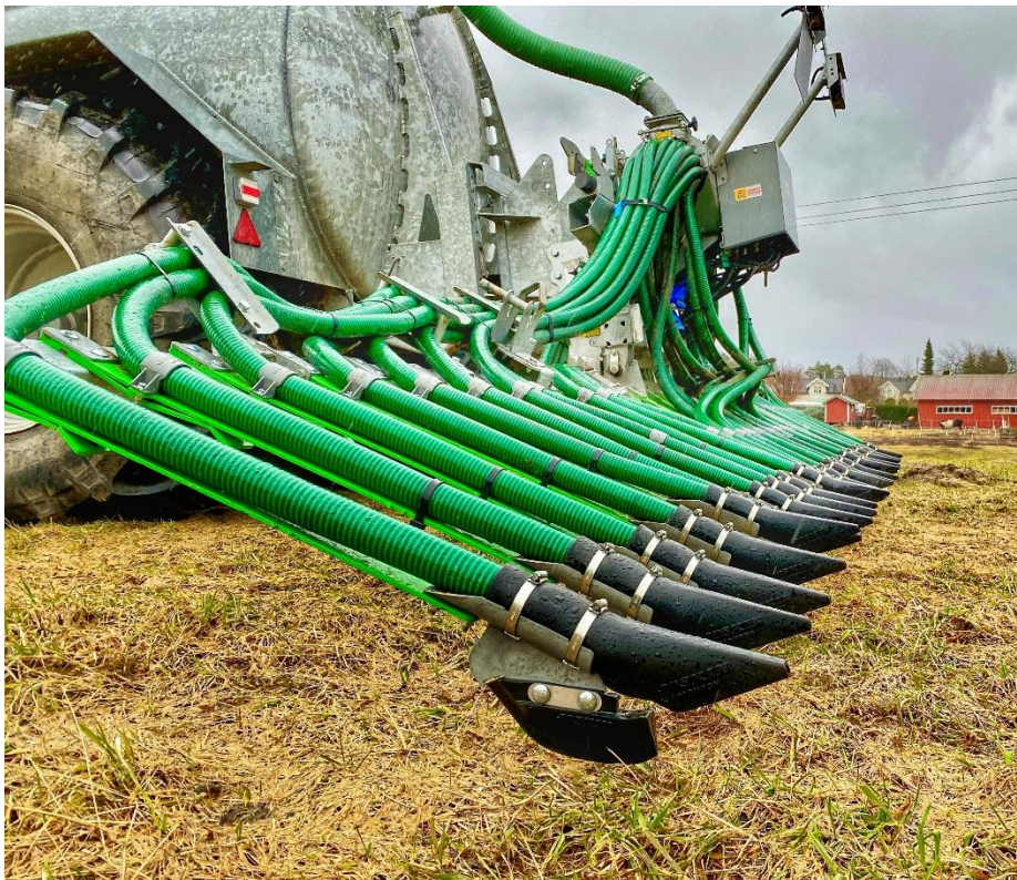
Gjødselvogn med spredebom for nedlegging av husdyrgjødsel, Arendal kommune.