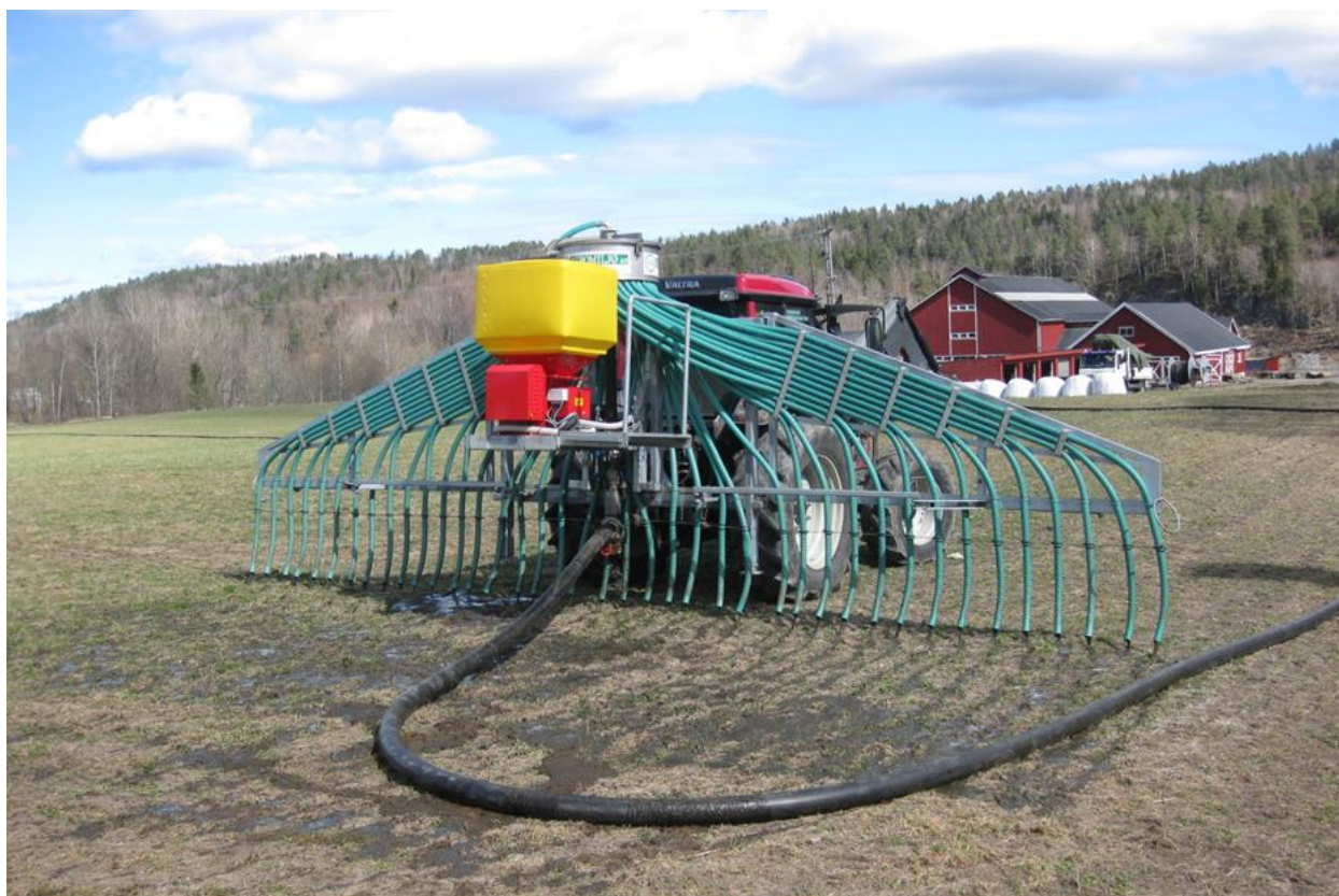
Bruk av tilførselsslange som tillegg til nedlegging av husdyrgjødsel med slangespreder, Mandal.