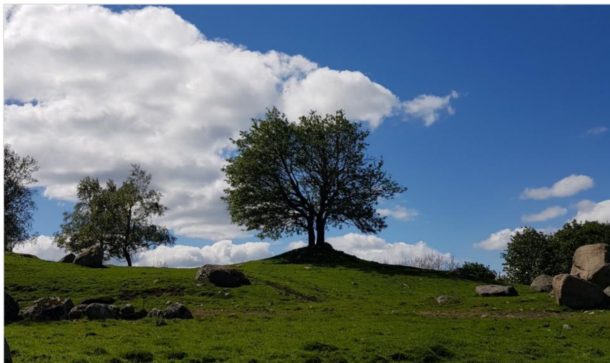
Gravhaug, Tjomsås i Vennesla.

På www.kulturminnesok.no kan man se hva som er registrert av kulturminner på ulike eiendommer.