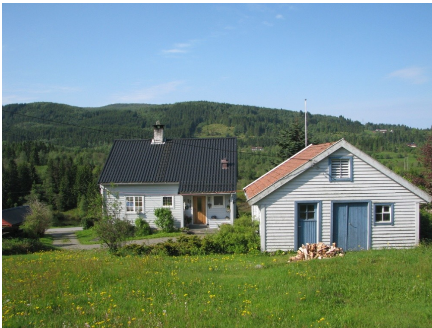
Gnr. 7 bnr. 21 Revheim på Osterøy. Frådelt våning, anneks, garasje og hage. Driftsbygningen som er overteken av nabobruket, ligg på andre sia av vegen noko til venstre for venstre biletkant. Eigar fekk òg frådele nauset på bruket. Sjå kart på side 8.

Kommunen sitt landbrukskontor har ofte ein viss oversikt, og dei lokale faglaga i landbruket kan òg ha noko oversikt. Du kan leite etter annonser om gard til sals i bransjeaviser som Bondebladet og Bondevennen og i andre aviser, eller du kan sjølv sette inn ei annonse med ønskje om å kjøpe gard. Prosjektet " Slipp oss til – ungdom inn i landbruket ", utvikla av Natur og Ungdom, Noregs Bygdeungdomslag og Norsk Bonde- og Småbrukarlag, driv nettsida gardsbruk.no , der du kan finne gardsbruk til sals. Her kan du som seljar òg leggje ut annonser om gardsbruk for sal gratis. Finn.no kan òg nyttast. Nokre eigedomsmeklarar driv òg med sal av landbrukseigedomar.